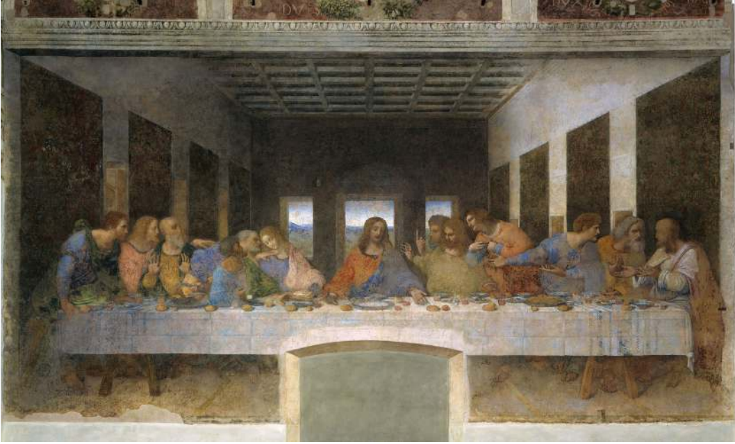
Görsel 1 Leonardo Da Vinci, Last Supper, 1494-98, fresk, 460x880cm, Santa Maria Delle Grazie, Milano, İtalya