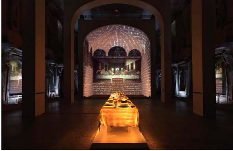
Görsel 4 Peter Greenaway, Park Avenue Armony, 2010, New York, A.B.D.