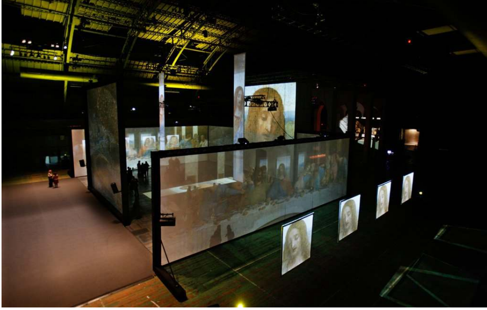
Görsel 5 Peter Greenaway, Park Avenue Armony, 2010, New York, A.B.D.

Kısaca değerlendirmek gerekirse; bakan gözün yerine geçen kamera yardımı ile resmetme, görüntüleme, dijital görüntü işleme, oluşturma 21. yüzyılın gerçekleridir. Geleneksel resim sanatından farklı olarak ortaya koyulan imge tek-biricik değildir. Walter Benjamin tarafından 1936 yılında ortaya koyulan görüşe göre yapıtın teknik olanaklar yardımı ile üretimi ve çoğaltılması ile kitleler tarafından algılanmasındaki genişleme sanat eserinde "büyü" kaybına sebep olur. Aynı zamanda yapıtla kurulan ilişkide başkalaşım ortaya çıkar. Başkalaşım biricikliği ortadan kaldırarak "sergileme ve gösterilme değeri"ne dönüşmektedir. (Dellaoğlu 1994: 146)