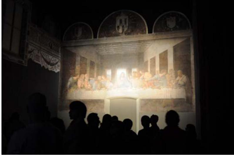
Görsel 3 Peter Greenaway, Last Supper, Melbourne, Art Festival, 2009, Avustralya

2009 yılında Melbourne’da gerçekleştirilen dijital video enstelasyonunda Milano’daki şapel duvarlarının kopyası, orijinal fresk’in kopyası ile oluşturulan mekanda görsel-işitsel yapılara eşlik eden canlı dijital projeksiyonlar kullanılmıştır. Performans mekanı Milano’daki gerçek mekanın yeniden sahnelenmesi, kısaca ses ve ışıkla yaratılan klonu, birebir kopyasıdır. (ABC Radio 2009 :1)