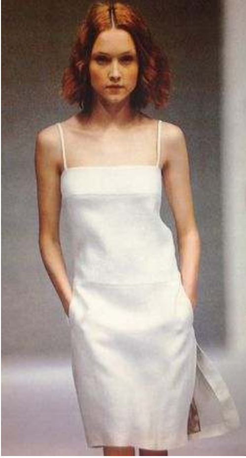
Figür 3. 1990'lar elbise, Jil Sander