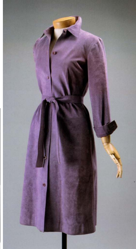
Figür 13. 1973, Halston tasarımı