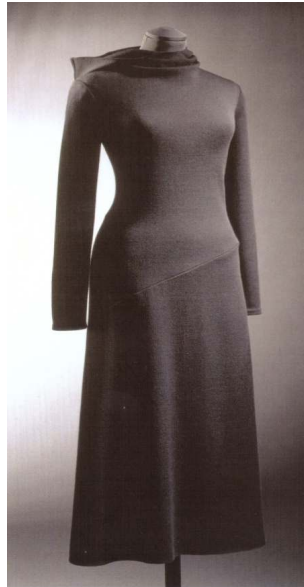
Figür 9. 1996, Calvin Klein (izimler modayı anlamak, Hayalperest Yayınları, 2017, İstanbul, s.124.)