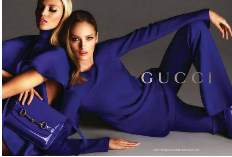
Figür 2. Gucci markasında çift c logolu görseli