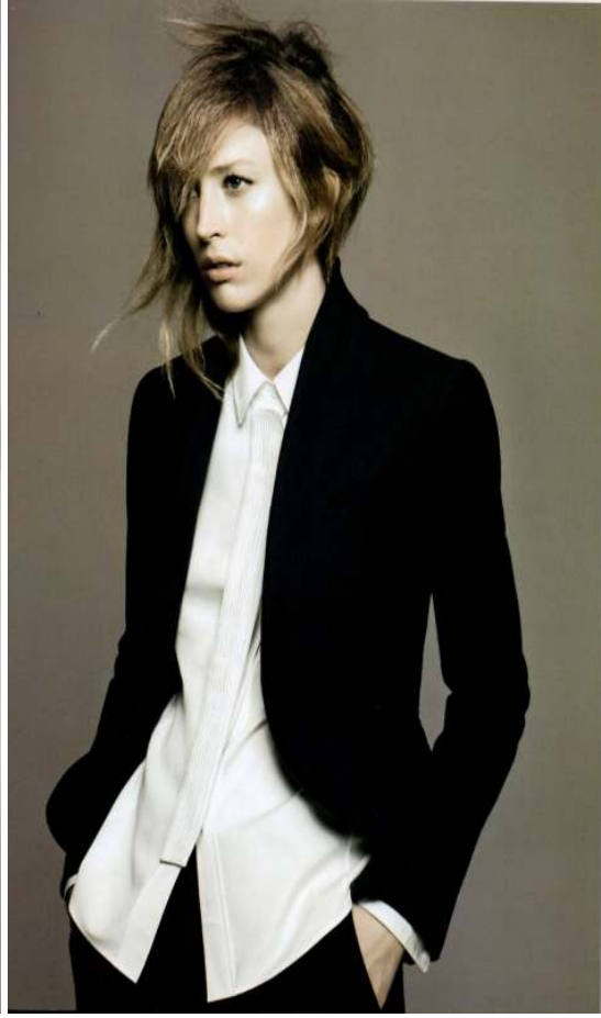
Figür 4. 2010 ceket, Jil Sander

https://tr.pinterest.com/pin/301178293814562368/ adresinden 29.10.2017 tarihinde alınmıştır. (Modanın tarihi 1900'den günümüze, Kerasus Yayınları, 2013, İstanbul, s.317.)