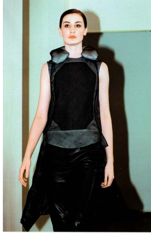
Figür 5. 1997, Helmut Lang taasımı