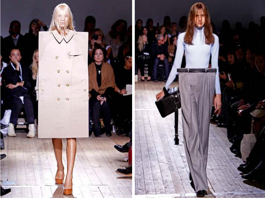
Figür 14-15. 2011, Martin Margiela

https://teacupsandcouture.wordpress.com/2010/11/01/maison-martin-margiela-spring-2011-boardroom-wear/ adresinden 01.11.2017 tarihinde alınmıştır.