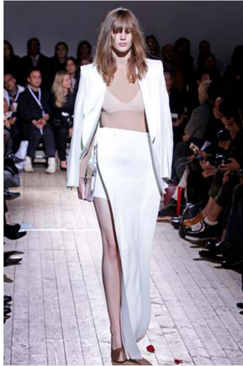
Figür 14. 2011, Martin Margiela

Özellikle 2010’lu yıllardan sonra sunduğu tasarımlarında kavramsal terzilik ile dikkat çekmiştir. Sırdan parçaların biçimini bozarak ve onlara beklenmedik ayrıntılar ekleyerek kıyafet tasarımının sınırlarını zorlamıştır. Çoğunlukla giyilmesi imkansız parçalar tasarlamakla suçlanmasına rağmen, markanın imzası sayılabilecek ve son derece ustalıklı kesime sahip parçalar üretmiştir (Fischel vd.,2013: 411).(Figür 14-15-16).