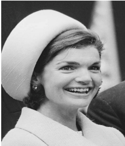
Figür 12. 1961, Halston tasarım şapkasıyla J.Kennedy

Halston Eğitimini bir şapkacı olarak moda dünyasına giren Roy Halston aynı zamanda “poverty de luxe” (pahalı sadelik) konusunda uzmanlaşmıştır. Halston'ın gösterişli isimlerle dolu müşteri listesinde bulunan Jackie Kennedy için resmi törende takılmak üzere tasarladığı asker kepi biçiminde bir şapkada bulunmaktadır (Figür 12). 1972’de gömlek elbiseye yeni bir yorum getirerek piyasaya sunmuştur; yıkanabilir, kırışmaz özellikli, ultra süet kumaşından yapılan bu parça, kısa sürede tüm New York sosyetesine ait herkesin gardırobunda yerini almıştır (Figür 13) (Blackman, 2013: 308). Kendi adına lisans alarak markalaşmaya giden ilk tasarımcı olan Halston; JC Penney ile yaptığı lisans anlaşması sayesinde gelir düzeyi çeşitli kadınlar için erişilebilir fiyatlarda kıyafetler tasarlayarak minimalizmi daha geniş kitlelere tanıtmıştır (URL-3, 2017).