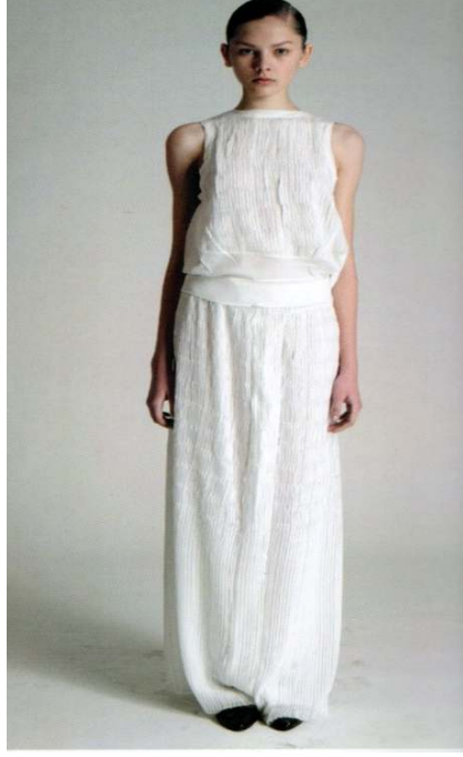
Figür 7. 1974, Calvin Klein tasarımı Figür 8. 2010, Calvin Klein tasarımı (Modanın tarihi 1900'den günümüze, Kerasus Yayınları, 2013, İstanbul, s.307.)