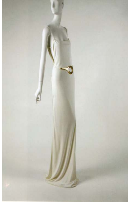
Figür 1. 1996/7 yılında Tom Ford (Modanın tarihi 1900'den günümüze, Kerasus Yayınları, 2013, İstanbul, s.314.)

Tom Ford Amerika doğumlu (d.1961), İtalyan lüks ürün markası Gucci'nin kreatif direktörü olarak çalıştığı süre boyunca baş yönetici Domenico de Sole ile birlikte, 1990'lardaki lüks modasının kültürünü yansıtmış ve şekillendirmiştir. Gucci, dönemin en arzulanan markası olmayı amaçlamıştır (Figür 1). Ford, pazarlama ve reklam konusunda öngörülü bir yaklaşımla beraber, tutarlı ve sıkı şekilde düzenlenmiş bir tasarım politikası izlemiştir. Bu da, zayıf markalarını yeniden canlandırmak ve yeni pazar payı kazanmak isteyen diğer markalar için bir örnek oluşturmuştur. Gucci'de bu strateji, markanın editöryel içeriğe eşlik eden kampanya görsellerin ve markanın kendine özgü ve kolayca ayırt edilebilen logosu olan çift G harfinin kullanımını içermiştir (Figür 2) (Fogg, 2014:474).