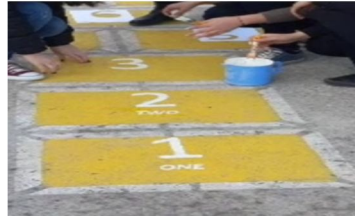
Şekil 3. “Neşeli Bahçemiz” projesinden yansımalar