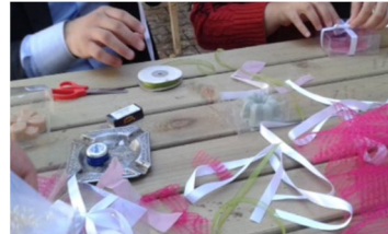
Şekil 1. “Lösemili Çocuklar Gülsün” projesinden yansımalar

Şekil 2’de “Her Sınıfa Bir Kütüphane” projesinden yansımalar sunulmuştur. “Her Sınıfa Bir Kütüphane” projesi kapsamında öğretmen adayları tarafından öncelikle kütüphaneye ihtiyacı olan ilkökul sınıfları belirlenmiştir. Sınıf öğretmenleri ile görüşülerek, öğretmen adaylarının ne tür kitaplar alacaklarına karar verilmiştir. Öğretmen adayları tarafından öncelikle kırtasiyeler ve okullar gezilerek sınıf seviyelerine uygun kitaplar toplanmaya çalışılmıştır. Ardından alınmasına karar verilen kitapların temini için gerekli olan paranın kitap ayıracı satılarak elde edilmesine karar verilmiştir. Eğitim