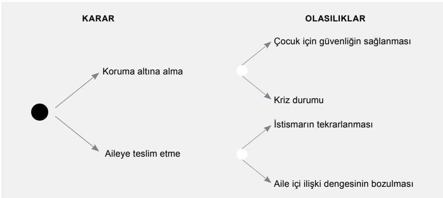
řekil 2. řans Olayları (Alınan karar sonucunda karřılařılabilecek riskler)

řekil 3'te de grlebileceęi gibi, sosyal hizmet uzmanı, ocuęun aileye teslimi ya da alternatif bir mdahale arasında karar verme durumundayken, karar analizi teknięi yardımıyla, nce her iki