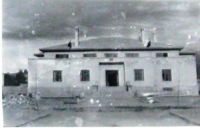
Van Halkevi Binası