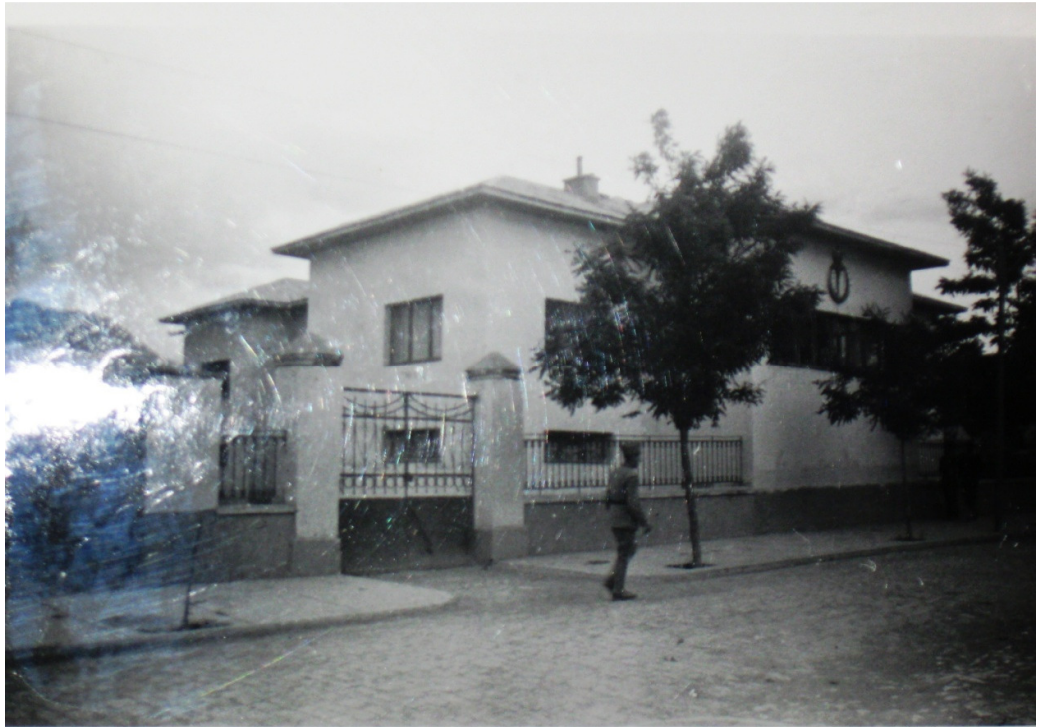
Van Halkevi Binası