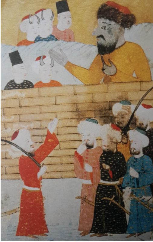
Foto. 1: Medinelilerin Üzerine Yürümesi Sonucu Köyüne Kaçan Deccal'in, Tılsımla Köyünü Duvar İçine Alması ve Medinelilerin Duvar Dışında Kalmaları (Ahvâl-ı Kıyâmet, SK Hafid Efendi 139) (And, 2012:244)