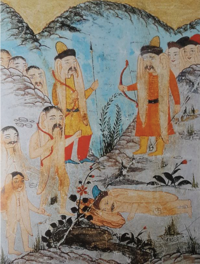
Foto. 10: Elllerinde Yay ve Ok Tutan Erkek ve dişi Yec'üc-Mec'üc ( Ahvâl-ı Kıyâmet , BSB Or. Oct. 1596) (And, 2012:307)

Ahvâl-ı Kıyâmet'in Berlin-Staatsbibliothek Kütüphanesinde bulunan nüshada Yec'üc-Mec'üc daha iyi görülmektedir. Bunlardan biri kulağını üstüne örtmüş yamakta, beşi ayakta ve beş tanesinin ise tepenin arkasından yalnız başları gözükmektedir. Üçünün bıyıkları yoktur, bunların dişi olduğu düşünülmektedir. Ayakta duranlardan ikisi giyimli ve başlıklıdır. Ellerinde yay ve ok tutmaktadır. Bunların bu kavmin iki yöneticisi olduğu düşünülmektedir.