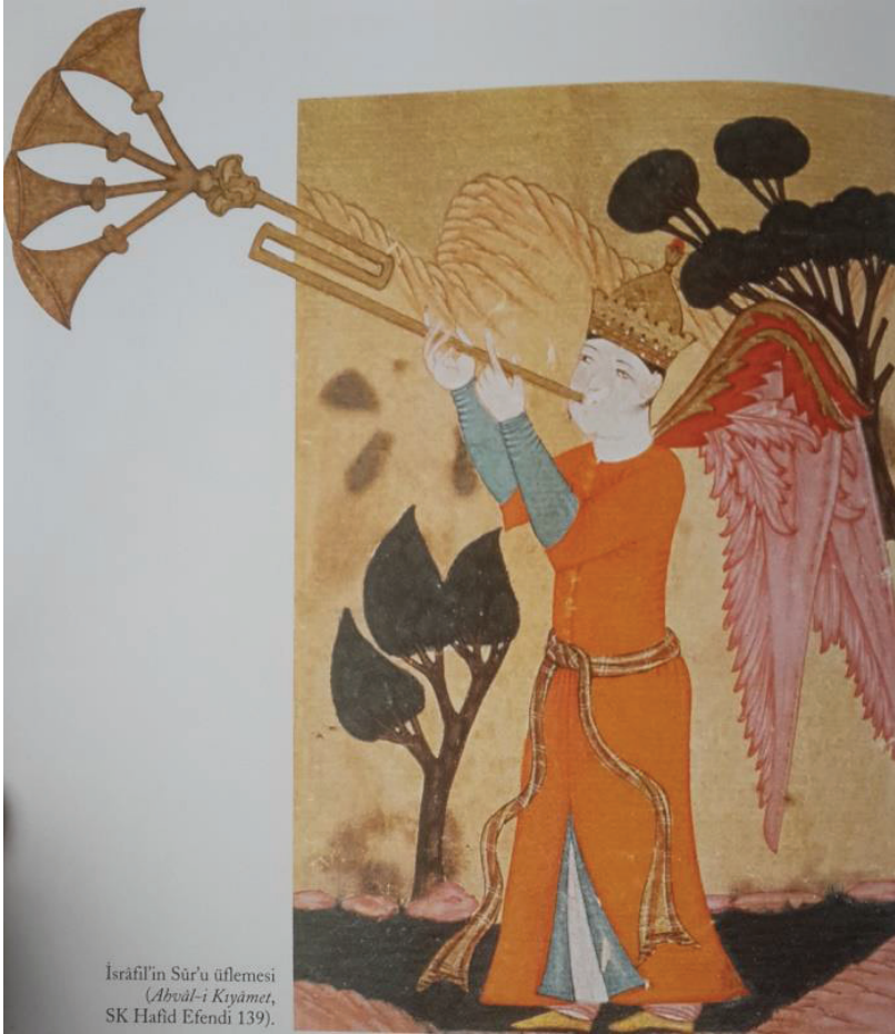
İsrâfil'in Sûr'u üflemesi ( Ahvâl-ı Kıyâmet , SK Hafid Efendi 139).