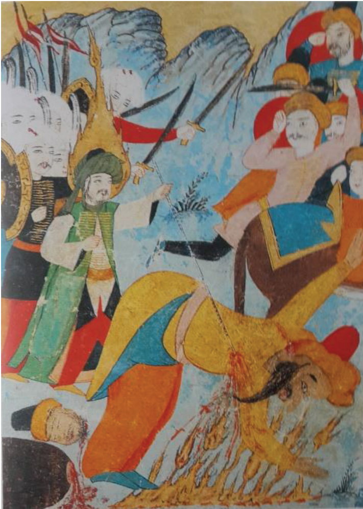
Foto. 9: Hz. İsa'nın Deccal'i Öldürmesi (Ahvâl-ı Kıyâmet, BSB Or. Oct. 1596) (And, 2012:243)

Deccal'in yaptıkları dünyada kargaşaya sebep olmuştur. "Müslümanların Allah'a yalvarması üzerine Allah Hz. İsa'yı gökten indirir." (And, 2012:251) Bazı yorumculara göre "Hz. İsa Şam'ın doğusunda Beytü'l-Makdis'te bir minarenin tepesine inecektir. Daha sonra soluğunun ulaştığı her inançsız öldürdükten sonra Deccal'ı arayarak, onu Kudüs dolaylarındaki Lûd adlı kasaba da ordusuyla birlikte öldürecek." (And, 2012:198) Bu minyatürde Hz. İsa'nın Deccal'ı öldürmek üzere ordusuyla gidişini göstermektedir.