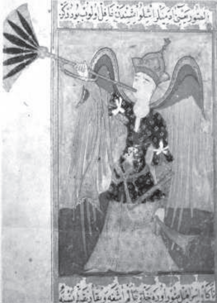
Foto. 11: İsrafil’in Sûr’a Üflemesi (Keir Collection, IV-18, Meredith Owens, 1976, Colour Plate 28) (Yaman, 2007:224)

Daha önce Süleymaniye Kütüphanesinde Hafid Efendi 139 numaralı nüsha başlığı altında geniş bir biçimde anlatılan İsrafil konulu minyatürün Keir Collection’unda bulunan örneği aşağıda gösterilmiştir. Süleymaniye Kütüphanesi’ndekinin aksine Keir Collection’daki minyatürde ‘Sûr’daki sesin çıkış bölüm sayısı yedi olacak şekilde tasvir edilmiştir.