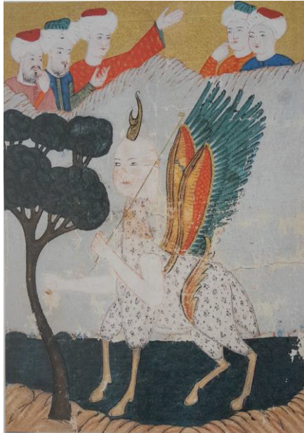
Foto. 4: İnsan Yüzlü, Kuş Gövdeli Bir Dabbetü'l-arz (Ahvâl-ı Kıyâmet, SK Hafid Efendi 139) (And, 2012:304)

Ahvâl-ı Kıyâmet'in Süleymaniye Kütüphanesi Hafid Efendi 139 numaralı nüshasında Dabbetü'l-arz; Yüzü insan gibi olup parlak yapılmıştır. Gövdesi kuş gibi, ayaklarının aslana benzediği söylenmekle birlikte minyatürde ayakları atınki gibidir. Bunun başı göğe değdiği için herkes görebilir şeklinde resmedilmiştir.