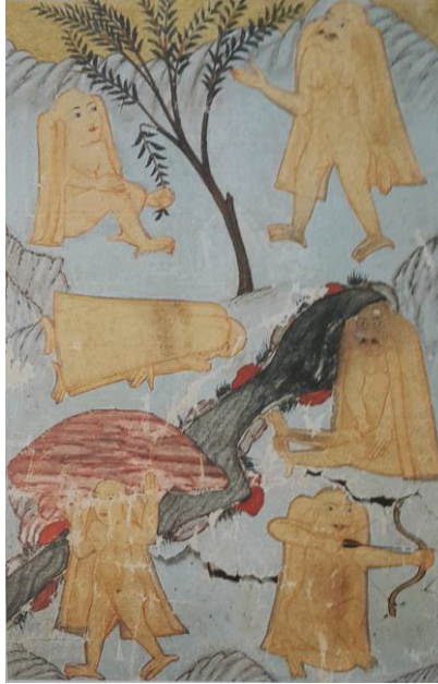
Foto. 3: Ağaçları Yiyen, Taş Taşıyan, Ok Atan Ye'cüc-Me'cüc (Ahvâl-ı Kıyâmet, SK Hafid Efendi 139) (And, 2012:308)

Ahvâl-ı Kıyâmet minyatürlü nüshalarında Yec'üc-Mec'üc ile ilgili ilk minyatürü Süleymaniye Kütüphanesi Hafid Efendi 139 numaralı yazmasından "Ağaçları Yiyen, Taş Taşıyan, Ok Atan Ye'cüc-Me'cüc" adlı minyatürünü aldık. Bu minyatürde bunlar ağaçları yerken, taş taşıırken, uyurken, ok atarken, çıplak, erkekleri bıyıklı olarak gösterilmiştir.