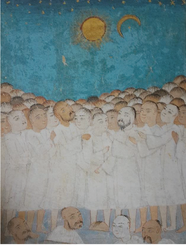
Foto. 6: Mahşer Yerinde Güneş'le Ay'ın Bir Araya Gelmesi ( Ahvâl-ı Kıyâmet , BSB Or. Oct. 1596) (And, 2012:252)

geri dönüp doğudan doğup batıdan batacaaktır. Güneş'in batıdan doğuşu ve ay ile birlikte gözükmesi Ahvâl-ı Kıyâmet yazmasındaki minyatürde gösterilmiştir.