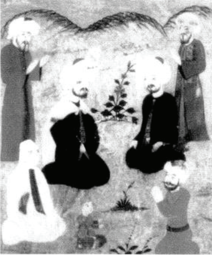
Foto. 8: Deccal zamanında kıtlık (Ahvâl-ı Kıyâmet, Berlin-Staatsbibliothek Ms. Or. Oct. 1596, 14b) (Yaman, 2007:155)

Eserin Berlin Staatsbibliothek’teki nüshasında ki minyatürde dağın yamacında dua eden insan figürleri belirtilmiştir. Bu nüshadaki tasvirde Deccal zamanında Müslümanların tekbir ile karınlarını doyurmalarını, tespih ile susuzluklarını gidermeleri betimlenmektedir. Ayakta ve oturarak dua eden figürlerin yer aldığı sahnede Deccal figürü yer almaz.