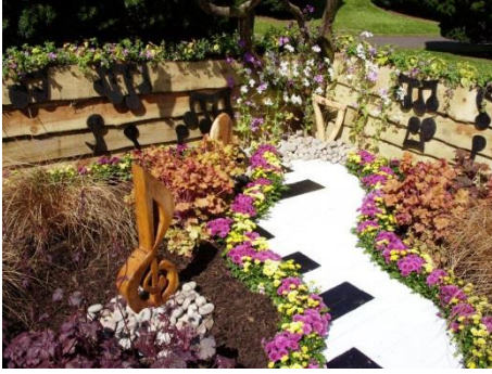
Şekil 1. Kuzey İrlanda'da bir ev bahçesi (URL1, 2014).

Görsel açıdan ise; müzik ve müzik aletlerini hissettiren unsurlara peyzaj tasarımları içerisinde yer vermek Peyzaj Mimarlığı - müzik ilişkisinin ortaya konulmasında somut yaklaşımlar sergilemektedir. Bu anlamda sanattan ilham alan birçok peyzaj mimarı, müzik unsuruna gerek görsel gerekse işitsel anlamda tasarımlarında yer vermektedirler. Buna ilişkin örnekler aşağıda görülmektedir.