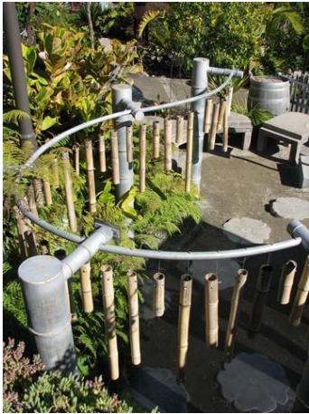
Şekil 3. San Diego Botanik Bahçesi'ne ait müzik bahçesi (URL3, 2014).