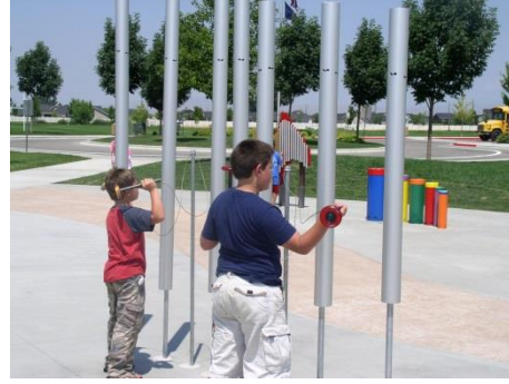
Şekil 2. Meridian Settlers Park, Idaho – Amerika (URL2, 2014).