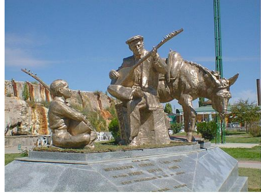
Şekil 16. Kırşehir’de Muharrem ve Neşet Ertaş heykeli (URL16, 2014).

Peyzaj mimarlığı mesleğinde yaygın kanı, ev ve apartman bahçelerinin düzenlemelerini yaptığı yolundadır ve genellikle 'peyzaj' denildiğinde, ressamların çok kullandığı ve sözlükteki anlamı ile 'manzara' akla gelmektedir (Akkan ve Çulçuoğlu, 1993). Oysa peyzaj, insanlar tarafından algılandığı şekliyle, karakteri doğal ve/veya insani unsurların eyleminin ve etkileşiminin sonucu olan bir alan anlamına gelir (Avrupa Peyzaj Sözleşmesi, 2003).