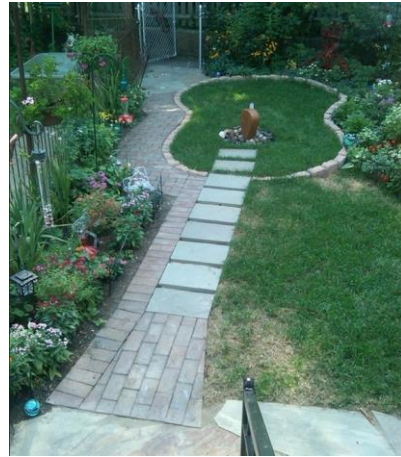
Şekil 4. Gitar şeklinde bahçe tasarımı örneği (URL4, 2014).