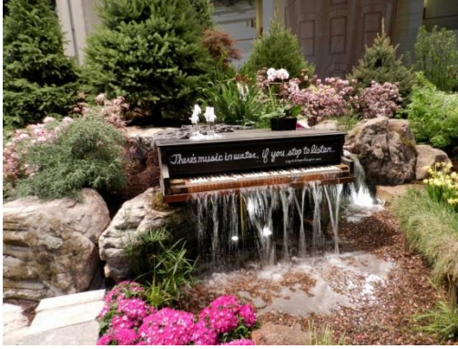
Şekil 11. Piyano şeklinde şelale örneği (URL11, 2014).