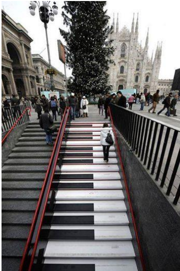
Şekil 9. Piyano şeklinde merdiven örneği (URL9, 2014).