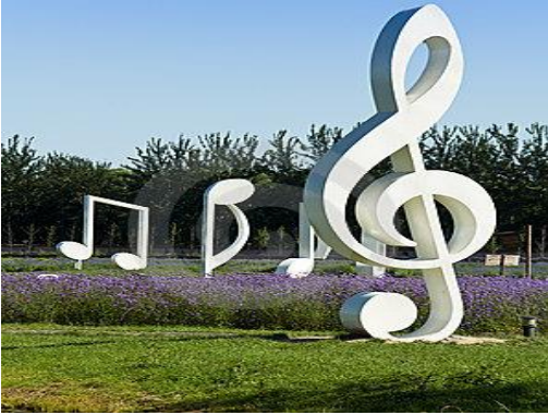
Şekil 13. Parkta müzik işaretleri (URL13, 2014).