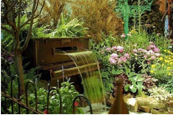
Şekil 5. Piyano şelalesi (URL5, 2014).