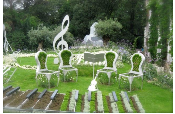
Şekil 12. Viyana müzik bahçesi (URL12, 2014).