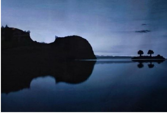
Şekil 7. Keman biçimi verilmiş peyzaj (URL7, 2014).