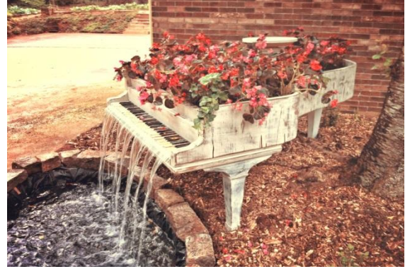
Şekil 8. Piyano şeklinde su ögesi (URL8, 2014).