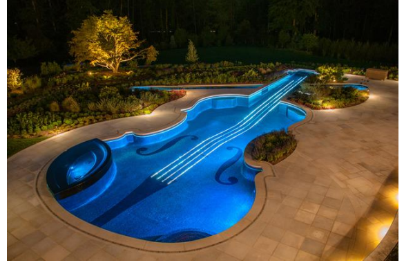
Şekil 6. New York' da bir ev bahçesi (URL6, 2014).