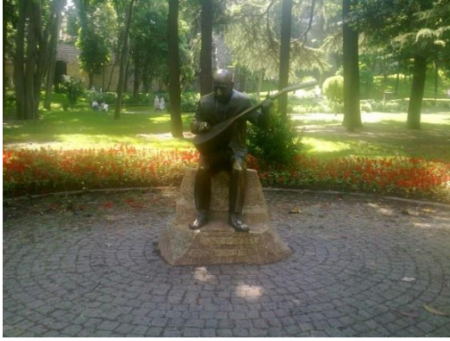
Şekil 15. Gülhane Parkında Aşık Veysel heykeli (URL15, 2014).

Aynı biçimde, eğer bir sokak konservatuvarıyla ünlüyse, o sokaktaki kuartet çalanların oluşturduğu bir heykelin bulunması ya da bir bölgede Romanlar yoğun olarak yaşıyorsa klarnet, darbuka vb. çalgılarla müzik yapan bu etnik topluluğun, olabildiğince gerçekçi bir biçimde, hatta -hırpani- gıysileriyle birlikte, caddenin uygun bir noktasına dikilmesi, peyzaj mimarlığı müziksel donatılarının bağlamsal olarak düzenlenmesi durumuna verilebilecek güzel bir örnektir.