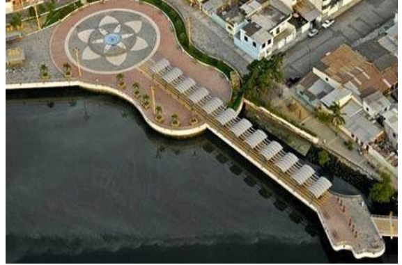
Şekil 14. Gitar şeklinde tasarlanmış kıyı örneği (URL14, 2014).