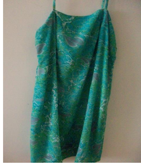
Şekil 4. Bahtiyar Hıra'ya ait elbise çalışması.

Ebru uygulanan tekstil ürünlerini; giyim eşyası olarak kullanılanlar ve ev eşyası olarak kullanılanlar şeklinde sınıflandırmak mümkündür. Hemen hemen tüm giyim eşyalarında ebrunun uygulandığı görülmüştür. Kullanım alanları; şal, fular, eşarp (başörtüsü), elbise, mendil, pantolon, gömlek, t-shirt, kravat şeklinde sıralanabilir (Şekil 4). Ebrunun, tekstil ürünleri olarak ev eşyasında kullanım alanı, giyim eşyasında kullanım alanına göre daha azdır. Bu grup; nevresim takımı, masa örtüsü, el bezi ve mendilden oluşmaktadır.