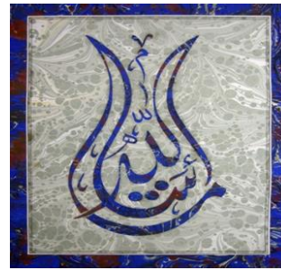
Şekil 1. Mesut Dikel'e Ait akkase ebru çalışması.

Klasik ebru çeşitlerinin sayısı oldukça fazladır. Genellikle bir çok ebruda zemin olarak kullanılan aynı zamanda ilk ebru çeşidi olan battal ebrudur. Onu takiben; gelgit ebrusu, şal ebru, taraklı ebru, hatip ebrusu, hafif ebru, bülbül yuvası, çiçekli ebrular, İspanyol ebrusu, kumlu-kılçıklı ebru, çift ebru, yazılı-akkase ebru, serpmeli ebru, neft ebru çeşitleri gelmektedir (Uzunca, 2012).