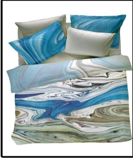
Şekil 7. Umut Eren'e ait nevresim takım çalışması.

tadır. Mesut Dikel ebru uygulanan kumaşın fiksaj yöntemi ile boyaların kumaşa sabitlenmesi sağlamaktadır. Umut Eren ise grafiti bilgisine sahip olduğundan dolayı grafitide kullanılan özel montana spreyi kullanıp kumaşlara ebru uygulamaktadır.