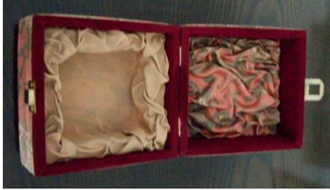
Şekil 2. Bahtiyar Hıra'ya ait ebru uygulanmış ahşap kutu çalışması.

dallarına göre daha fazla alternatifte sahiptir. Bu durum, ebrunun sadece kağıt süsleme sanatı olarak kalmayıp farklı materyaller üzerinde denenmesine yol açmıştır. Kitap kapaklarının içleri, yaprakları veya yazı kenarlarının kenarlarını bordür olarak süslemek için kullanılmış, kimi zaman da birbirine uygun düşen ebrulardan panoların yapıldığı görülmektedir. Ayrıca ebru tekniği, tekstil, dekoratif sanatlar, ahşap, cam, seramik gibi hemen her malzeme ve kullanım alanında yer almaktadır (Şekil 2).