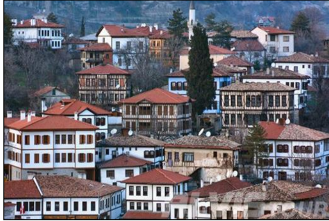
Şekil 1: Vadi yamaçlarına konumlanmış Safranbolu Evleri

Kent merkezinin farklı yükseklikler üzerinde kurulması ve çevresinde ormanların bulunması Çarşı kesimiyle Bağlar arasındaki sıcaklık farkından dolayı Safranbolu'da yazlık ve kışlık olmak üzere iki ayrı oturma düzeni kurulmuştur. Birincisi "Şehir" diye bilinen vadiler içerisindeki yerleşme yeridir. "Şehir" kışın oturlan kent parçasıdır. Daracık sokakları, han, hamam, cami ve çeşmeleriyle günümüze kadar korunmuş adeta 1/1 ölçekli bir maket bir müze görünümündedir (Çetinor, 1976).