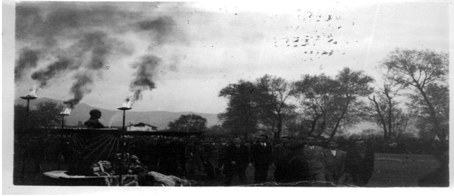
Ek 24: Turhal - 21 Kasım 1938