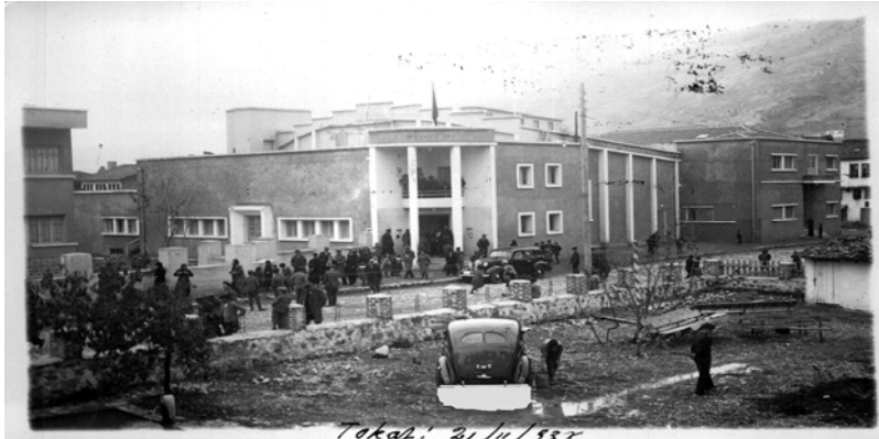
Ek 6: Tokat - 21 Kasım 1938