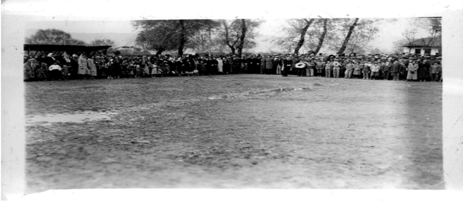
Ek 22: Turhal - 21 Kasım 1938