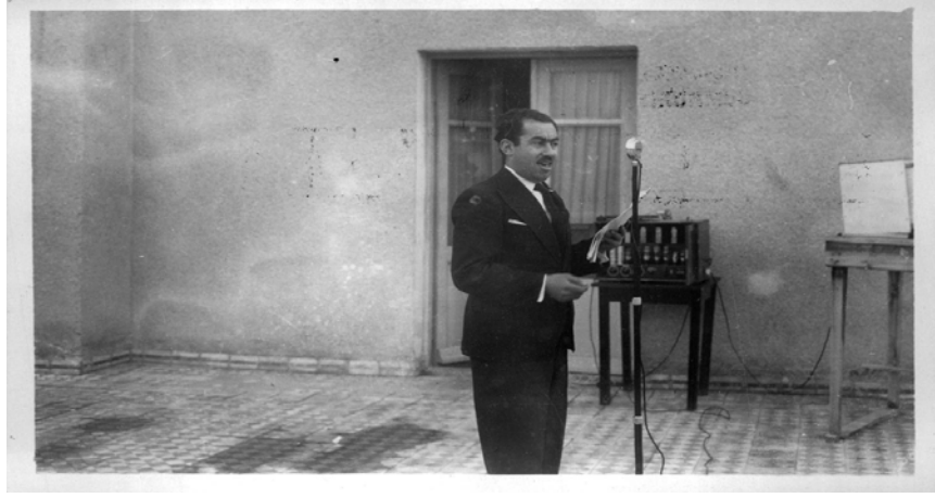
Ek 16: Fahri Alpay Tören Alanında Konuşma Yaparken - 21 Kasım 1938