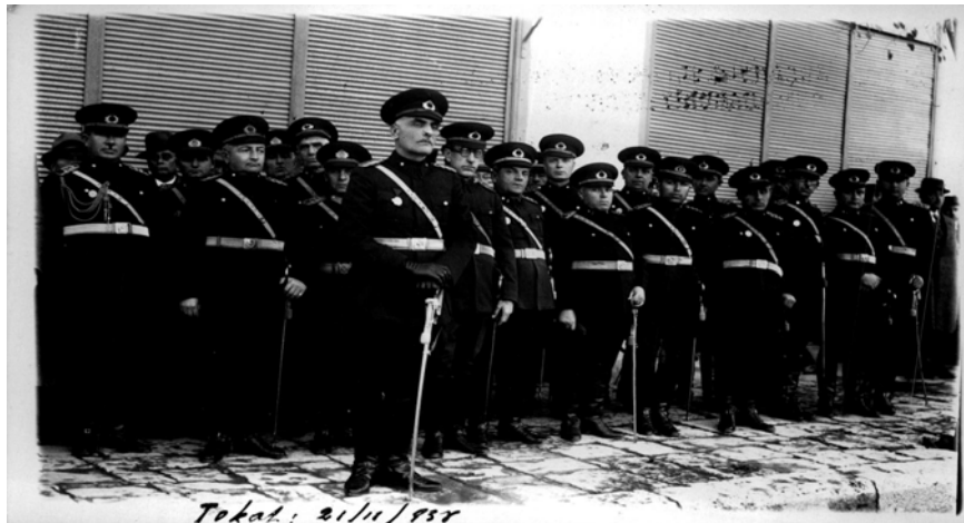
Ek 14: Tokat - 21 Kasım 1938