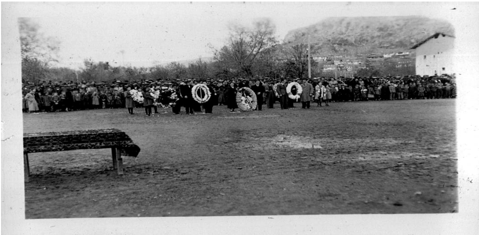
Ek 23: Turhal - 21 Kasım 1938