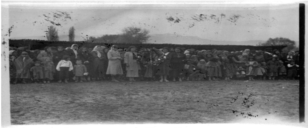
Ek 20: Turhal - 21 Kasım 1938