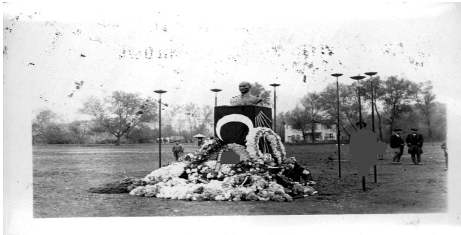
Ek 26: Turhal - 21 Kasım 1938