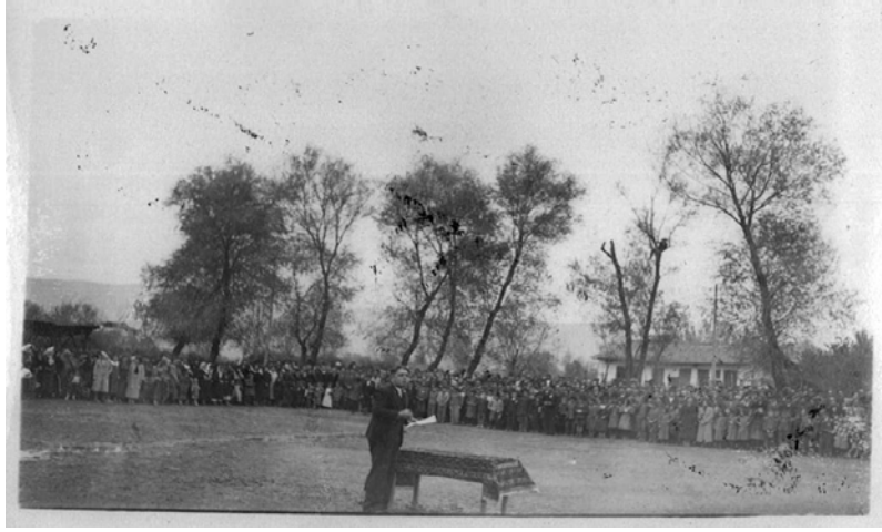
Ek 19: Turhal - 21 Kasım 1938