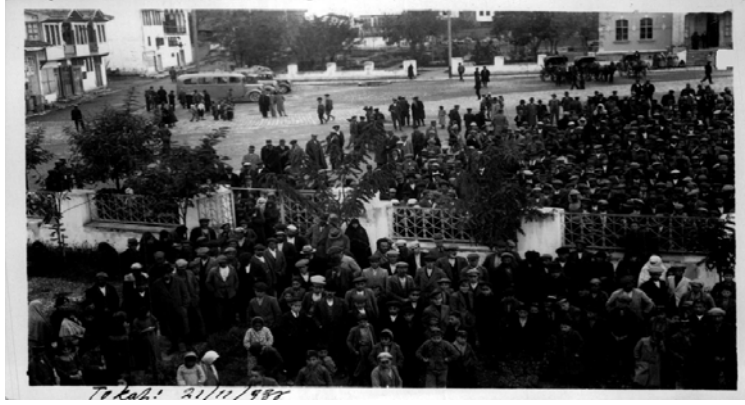
Ek 1: Tokat - 21 Kasım 1938