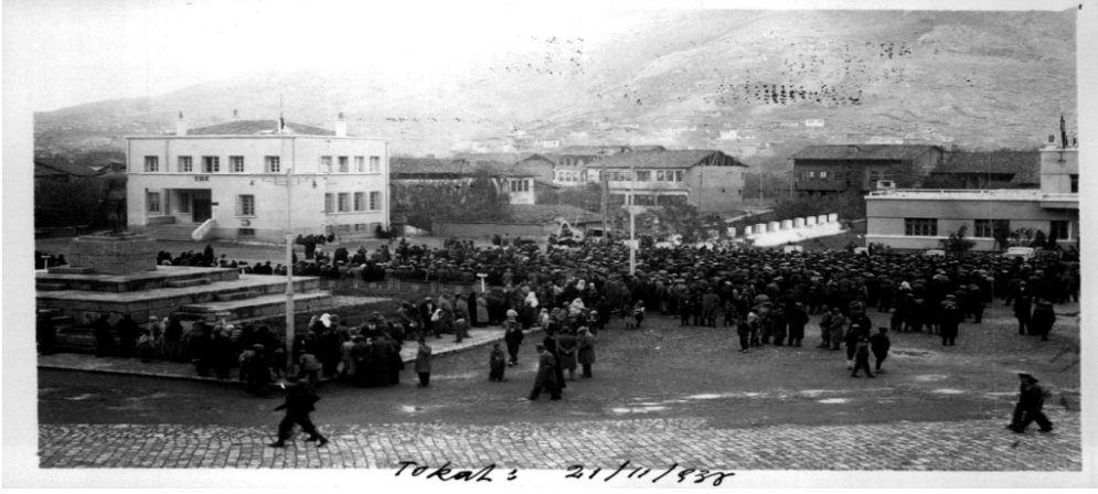
Ek 7: Tokat - 21 Kasım 1938