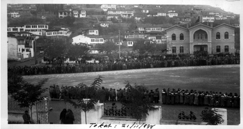
Ek 5: Tokat - 21 Kasım 1938