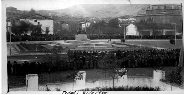
Ek 2: Tokat - 21 Kasım 1938