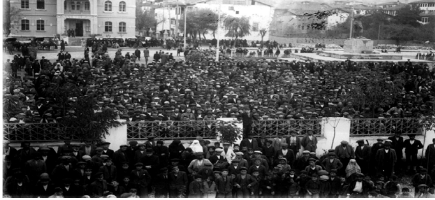
Ek 9: Tokat - 21 Kasım 1938