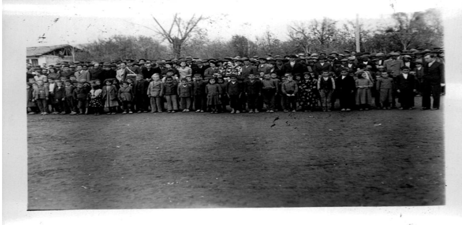
Ek 25: Turhal - 21 Kasım 1938