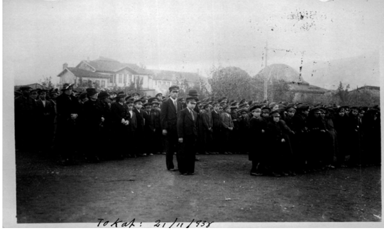
Ek 4: Tokat - 21 Kasım 1938