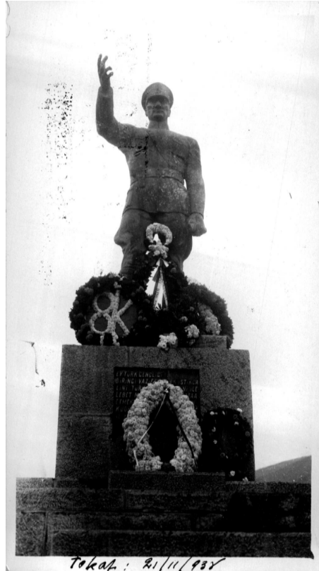
Ek 8: Tokat - 21 Kasım 1938