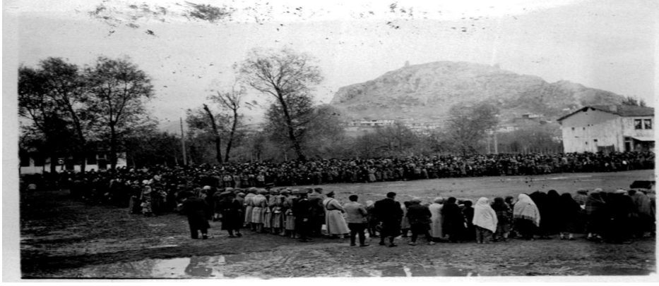
Ek 21: Turhal - 21 Kasım 1938