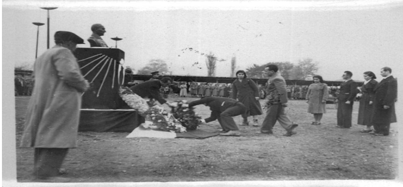
Ek 18: Turhal - 21 Kasım 1938