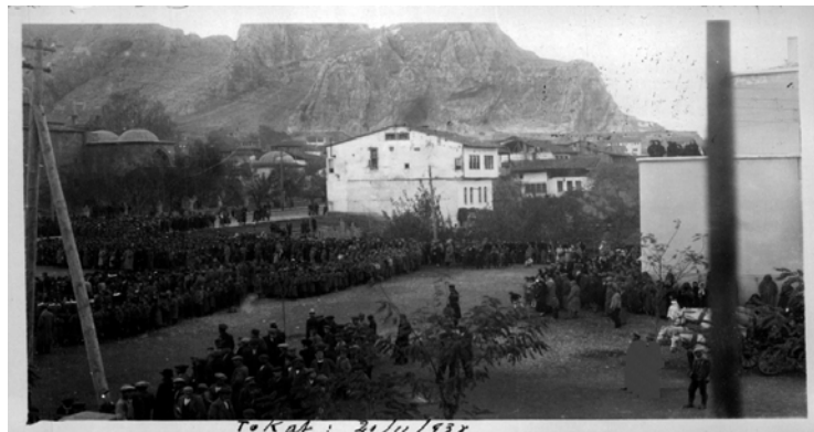
Ek 3: Tokat - 21 Kasım 1938