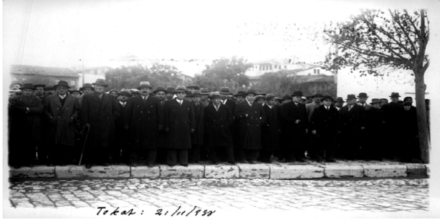
Ek 13: Tokat - 21 Kasım 1938