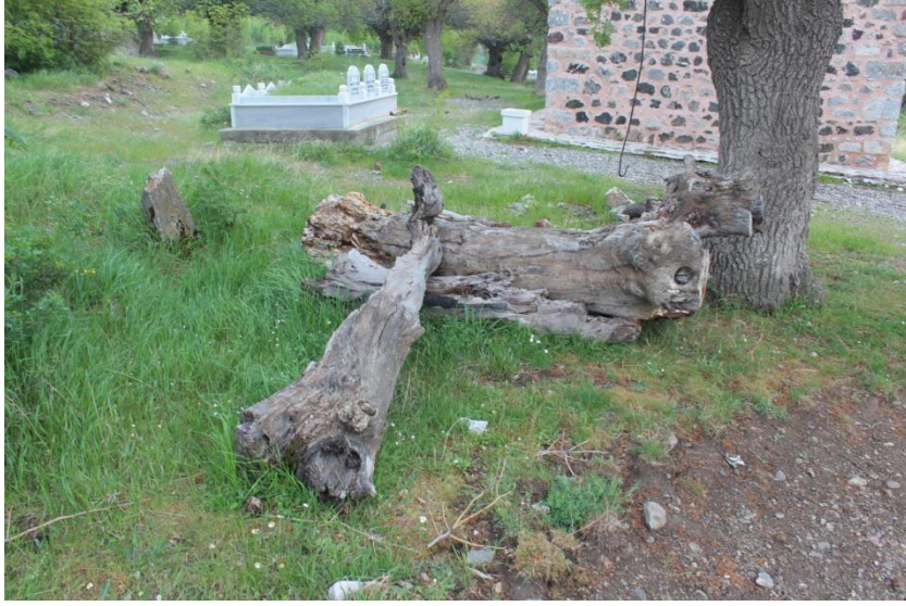
Foto 3:Çöreğibüyük ziyaret yerinde kurumuş sakız ağacı kalıntıları.

Köylülerin anlatılarına göre, köy sakinlerinden biri tekkeden ağaç alıp evinin bahçesine çit örmüş ve evi ile bahçesini sel götürmüştür. Karakaya köyünde yaşayan birisi Çöreğibüyük Tekkesine, “Bana bir çocuk vereceksin yoksa seni kazmayla yıkarım”, demiş ve dilek tutmuş; bir oğlu olmuş. Oğlunun ismini Mehmet koymuş. Tekkeye gelip çocuklarının olması için dilek tutanlar da erkek çocuğu olduğunda çocuğun ismini Mehmet koymaktadır. Köylülerin hayvanları buzağıladığında buzağılar sürekli ölüyorsa “Bundan sonraki yavruyu türbeye kurban vereceğim.” deyip yavrunun yularını bırakırlar; eğer buzağı yaşarsa tekkede kurban olarak kesilir.