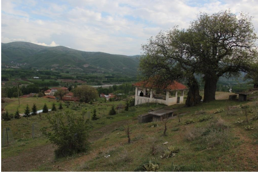
Foto 8: Kızılköy ziyaret yerindeki sakız ağaçları ve köylüler tarafından dikilen sedir ağaçları.

Köy, Tokat kent merkezinin kuzeydoğusunda ve il merkezine 15 km uzaklıktadır. Köydeki ziyaret yeri etrafında yer alan sakız ağaçları Çöreğibüyük köyünde olduğu gibi bu köy sakinleri tarafından da inançları gereği korunmaktadır. Ayrıca Kızılköy'de de ziyaret yeri etrafına köylüler tarafından sedir ağaçları dikilmiş ve bu ağaçlar da korunmaktadır (Foto 8).