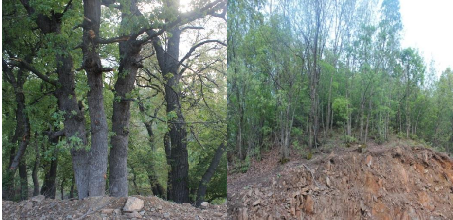
Foto 5:Döllükköyünde Pehlivan adı verilen ziyaret yerindeki kutsallık atfedilerek korunan (solda) ve korunmayan (sağda) ağaçlar birbirine çok yakın yer almaktadır.

Dut ağacı gibi Anadolu'da kutsallık atfedilen ağaçlardan birisi de meşe ağacıdır. Heybetinden dolayı kutlu ağaçlardan sayılan meşe ağacı, "dede, baba" gibi sıfatlarla anılarak yiğitlerin, erenlerin mekânı sayılmaktadır. Ayrıca halk arasında bu ağacın kutsallığıyla ilgili "Hançerli Dede" gibi efsaneler de yaşamaktadır. Genellikle bir türbe ya da mezar etrafında bulunan ağaçlara kutsallık atfedilmesinin yanında Anadolu'da bazı yerlerde türbe ya da mezar olmadan da kutsallık atfedilen ağaçlık alanlar mevcuttur. Nitekim araştırma sahamızdaki Döllük Köyü Ziyaret Yeri'nde türbe ya da mezarın bulunmaması bu durumun somut örneklerindedir (Ergun, 2004: 235-236; Güneş, 2013).