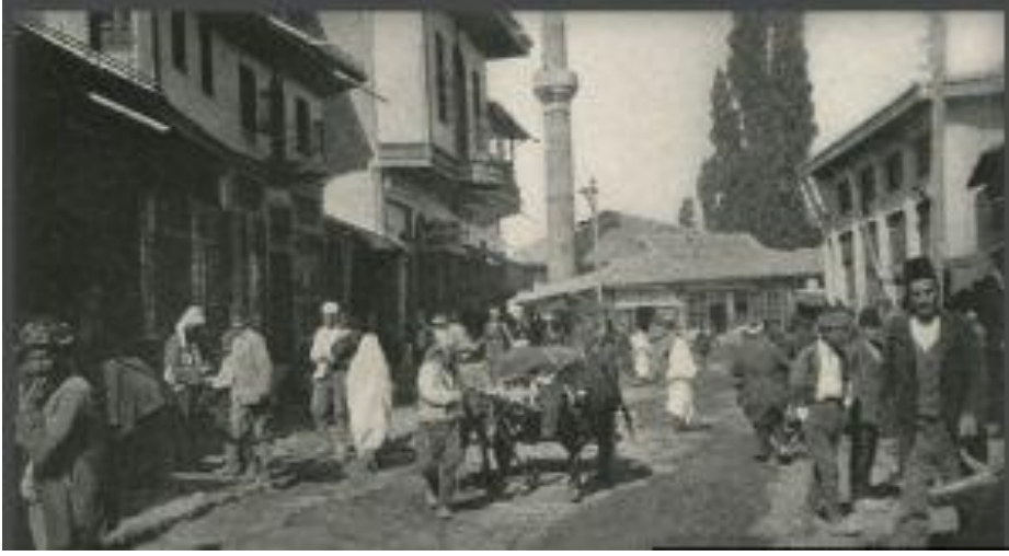
Cepheden Çıkmalı Sivas Evi