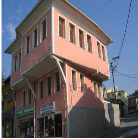
Demürcüler Ardı Mahallesi Evleri