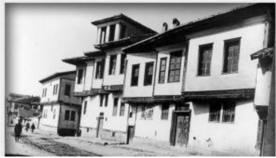
Tek Tarafı Çıkmalı Sivas Evi