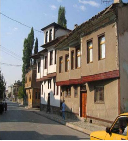
Bezirci Mahallesi Evleri