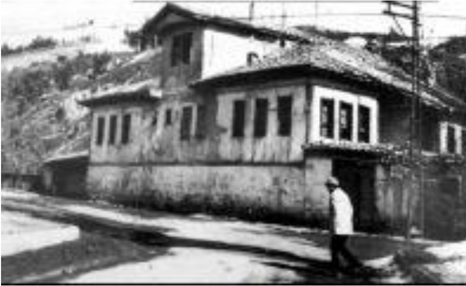
Osman Ağa Konağı