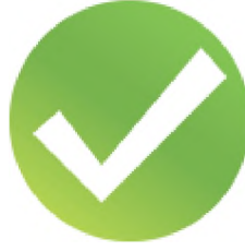
(Şekil 2a): DOAJ'a Kabul Edilmiş Dergi İşareti

Bu işaret, Mart 2014'te ilan edilen daha sıkı koşullar çerçevesinde yeniden başarılı bir başvuru yaparak DOAJ'da dizinlenmeye devam eden dergilere DOAJ tarafından verilir.