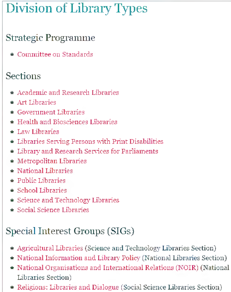
(Şekil 2): Kütüphane Türleri Bölümü (IFLA, 2016c)

IFLA'nın çalışma yapısının daha iyi anlaşılabilmesi adına Şekil 2'de Kütüphane Türleri Bölümü ile ilgili olan bağlantılar gösterilmektedir. Kütüphane Türleri, Stratejik Program olarak Standartlar Komitesi ile ilişkilendirilmekte, Birim olarak ise Akademik ve Araştırma Kütüphaneleri, Sanat Kütüphaneleri, Devlet Kütüphaneleri, Sanat ve Yaşam Bilimleri Kütüphaneleri, Hukuk Kütüphaneleri, Engellilere Yönelik Hizmet Veren Kütüphaneler, Parlamento Kütüphaneleri, Metropol Kütüphaneleri, Ulusal Kütüphaneler, Halk Kütüphaneleri, Okul Kütüphaneleri, Bilim ve Teknoloji Kütüphaneleri, Sosyal Bilim Kütüphaneleri şeklinde ayrılmaktadır. Konuyla ilgili Özel İlgi Grupları altında ise Tarım Kütüphaneleri, Ulusal Bilgi ve Kütüphane Politikası, Ulusal Organizasyonlar ve Uluslararası İlişkiler, Dinler: Kütüphaneler ve Diyalog şeklinde bir sınıflamaya gidilmiştir.