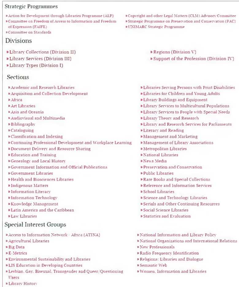
(Şekil 1): IFLA'nın genel çalışma yapısı (IFLA, 2016c)

Dünya çapında yaklaşık 150 ülkeden 1500'ün üzerinde üyesi bulunan IFLA, kâr amacı gütmeyen bir yapı olarak kütüphane ve bilgi hizmetlerinin en iyi şekilde sağlanabilmesi için gerekli standartları ortaya koymak, söz konusu hizmetlerin değerinin anlaşılması için geniş çapta tanıtım yapmak, farklı ülkelerdeki kütüphanecilikle ilgili kuruluşlar arasındaki işbirliğini geliştirmek gibi bir dizi amacı yerine getirmeye çalışmaktadır. Söz konusu amaçları yerine getirmeye çalışırken de çok farklı uluslararası yapılar (UNESCO, International Council of Scientific Unions, World Intellectual Property Organization, International Organization for Standardization, World Trade Organization gibi) ile işbirliği faaliyetinde bulunmaktadır (IFLA, 2016b). IFLA, bilgi profesyonellerine yönelik olarak çeşitli yayınlar üretmekte ve bunları kendi arşivi aracılığıyla sunmaktadır. 2 Ayrıca IFLA farklı hedef kitleler için çeşitli raporlar yayımlamakta ve IFLA Journal adında yılda dört sayı olarak hazırlanan hakemli bir dergi de çıkarmaktadır. IFLA Stratejik Programlar (Strategic Programmes), Bölümler (Divisions), Birimler (Sections) ve Özel İlgi Grupları (Special Interest Groups) adı verilen yapı içerisinde faaliyetlerini yürütmektedir. 2016 yılı itibarıyla IFLA bünyesinde altı Stratejik Program, beş Bölüm, 44 Birim ve 15 Özel İlgi Grubu yer almaktadır (IFLA, 2016c, bkz. Şekil 1).