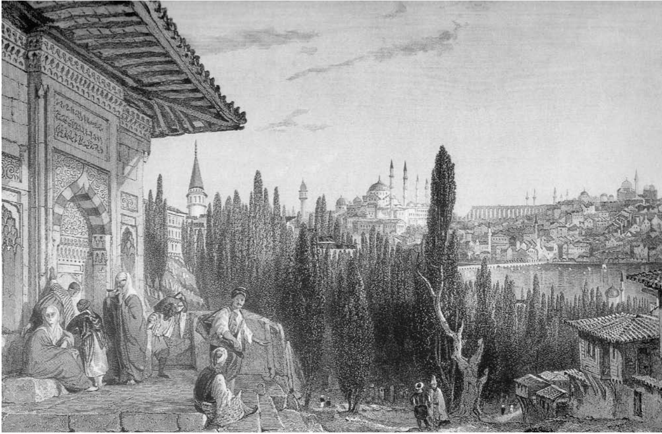
Şekil 4. Pera'da çeşme, Thomas Allom (Kültür Bakanlığı, 1996a, s.134)

Osmanlı'da alışveriş merkezleri, açık alışveriş merkezleri (hafta pazarları, sürekli pazarlar) ve kapalı alışveriş merkezleri (bedesten, han, çarşı) şeklinde ayrılabilir. Küçük boyuttaki dükkanlar, arasta, han, bedesten ve çok düzensiz olmayan, genelde ahşap pergola ve saçaklarla, daha seyrek olarak da örgü duvar ile örtülmüş dar sokaklar, sekiz yüzyıl boyunca Türk-Anadolu ticaret merkezinin değişmez öğeleri olmuşlardır (Cerasi, 1999).