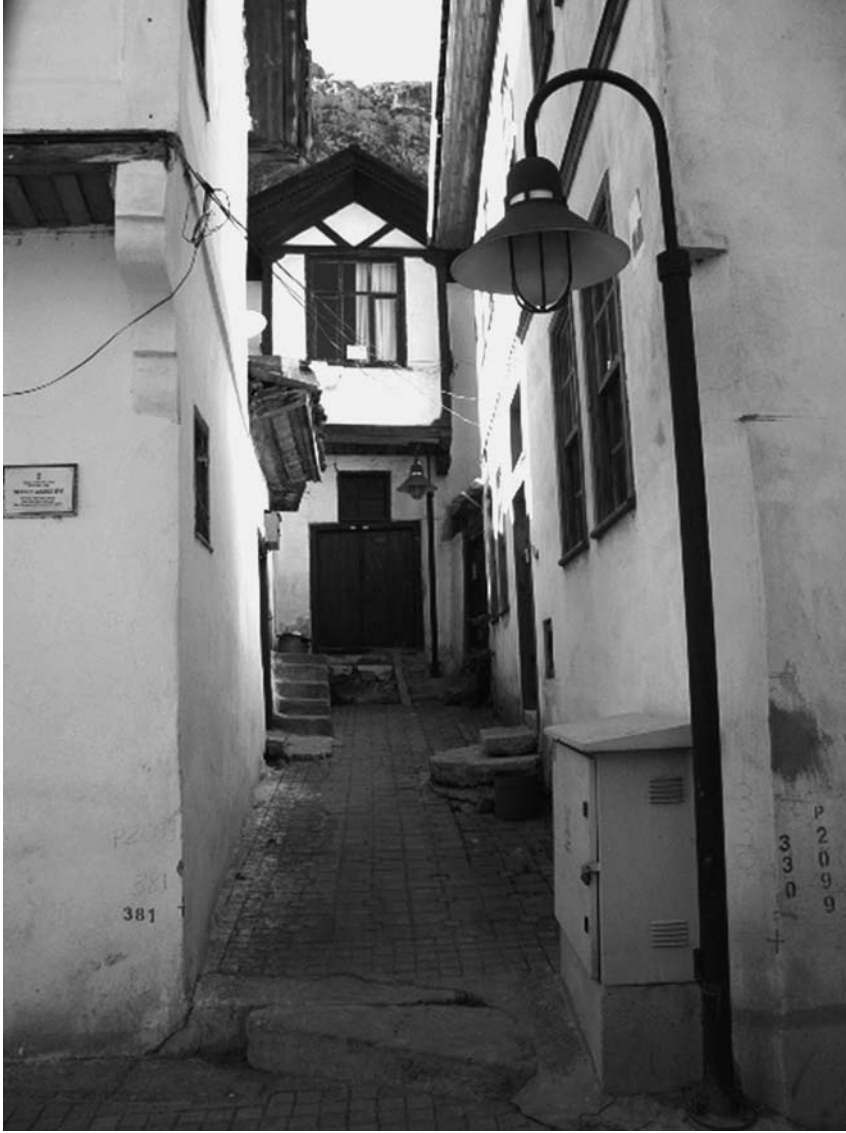
Şekil 2. Amasya Hatuniye Mahallesi'nde bir çıkma sokak (Seçkin, 2003)

Çıkma sokak konuta daha büyük bir mahremiyet sağladığından, kültürel etmenlerle de ilişkili sayılabilmektedir. Ama onların ortaya çıkışının sadece İslami mahremiyet anlayışıyla ilişkili olduğunu söylemek yeterli değildir. Kuban (1995)'in da belirttiği gibi, yol ağının geometri dışı oluşumunun ne-