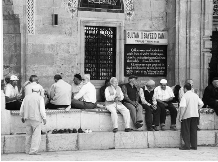
Şekil 3. Amasya Sultan II. Bayezid Camisi son cemaat yerinden bir görünüm (Seçkin, 2003)

Zamanla daha fazla ibadethane gereksinimi doğmuştur. Türkler, kentlerinde birden fazla Ulu Cami yaptırmakta sakınca görmemişlerdir; Küfe ve Basra kentlerinde olduğu gibi ortada bulunan 'meydan - ulu cami - vali sarayı' modeli, Anadolu Türk kentlerinde hiç uygulanmamıştır (Barthold, 1977). Dolayısıyla kale içindeki veya kent merkezi olarak adlandırılabilir alanındaki caminin dışında, kentin bir çok noktasında, pek çoğu görkemli camiler inşa etmişlerdir.