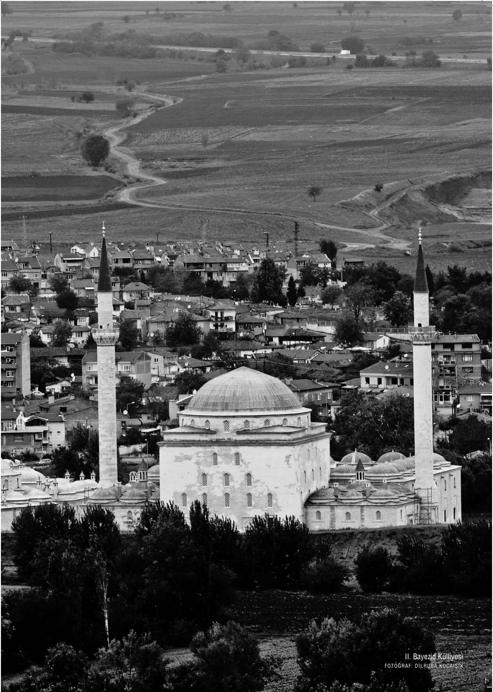
II. Bayezid Külliyesi