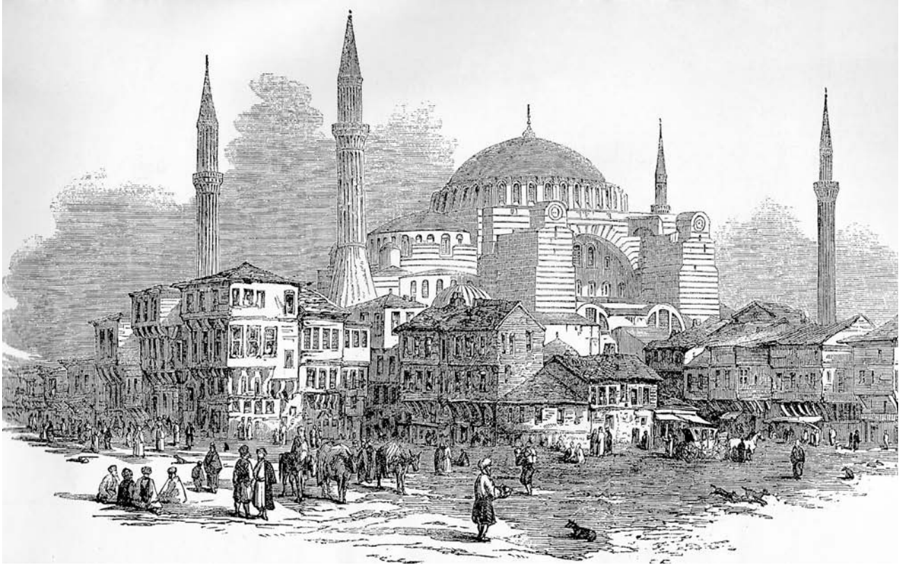
Sekil 5. Ayasofya Meydanı (Kültür Bakanlığı, 1996b, s.19)

Anadolu - Türk kentinde meydanın varlığı ve işlevi, Batı'daki örnekleriyle karşılaştırıldığında çoğunlukla yetersiz kalmakta-