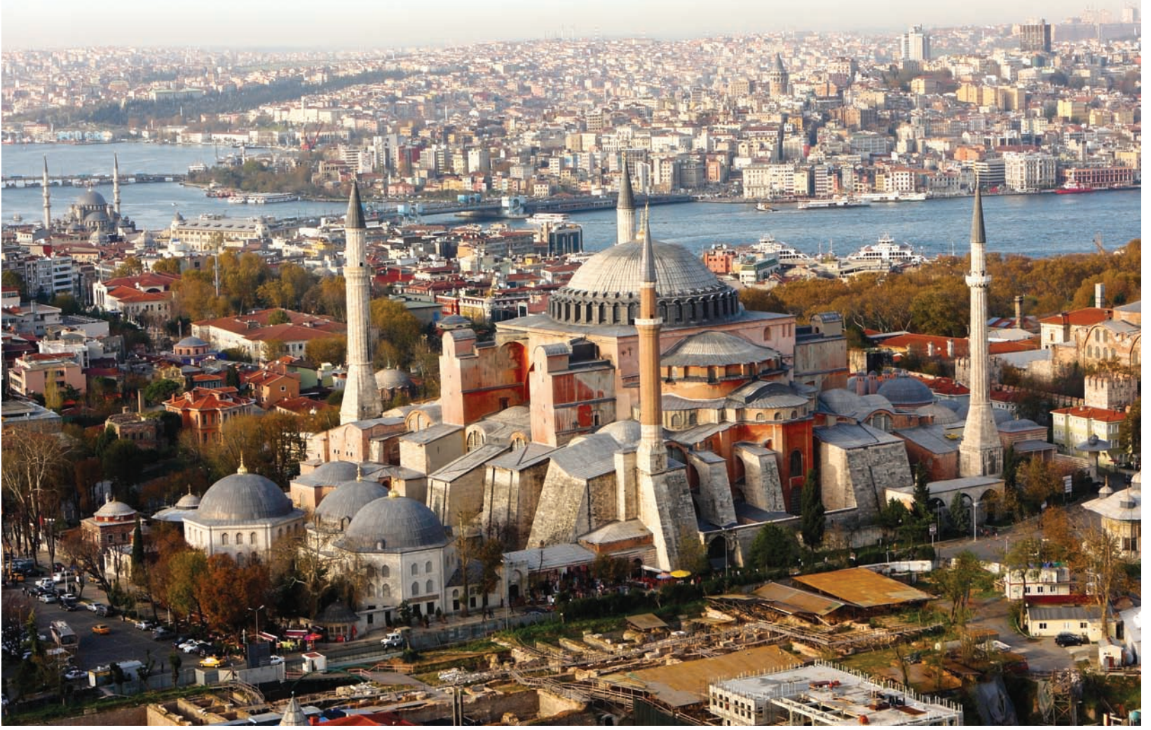
Ayasofya Müzesi, Tarihi Yarımada

miştir. Kültürel mirasın korunması; Türkiye'nin henüz imzalamadığı COE'nin "Kültürel Mirasın Toplum İçin Değeri Konulu Avrupa Konseyi Çerçeve Sözleşmesi"nin 4. Maddesi ile "İnsan Hakları" boyutuna taşınmıştır (COE, 2005). Türk bilim insanları ve hukukçuları tarafından Hasankeyf'in korunması için AİHM'e yapılan başvuruda, AİHM yürütmeyi durdurma kararı almamış olmasına rağmen başvuruyu görüşmeye değer bulmuş ve Türkiye Cumhuriyeti hükümetinden bilgi istemiştir. (Avrupa İnsan Hakları Mahkemesi'nin kararı/ Tarih: 31 Temmuz 2006/ Yer: Strasbourg, Konu. Başvuru no: 6080/ 06/ Taraflar: Ahunbay ve diğerleri; Türkiye, Almanya ve Avusturya'ya karşı)