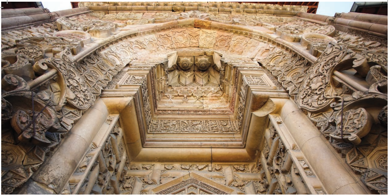
Divriği Ulu Camii ve Dar'üş-şifası

mutlaka yapılmalıdır. Bilindiği üzere ülkemizde Uluslararası Mimarlar Birliği'nin önerisi ve Türkiye'nin Avrupa Birliği'ne üyelik sürecinde "meslekte serbest dolaşım" düzenlemeleri gereği, mimarlık eğitiminin süresinin uzatılması, mimarlık mesleğine kabul öncesinde "zorunlu staj / meslek pratiği" uygulamasının getirilmesi ve Mimarlık Yasası'nın çıkarılması ile ilgili tartışmalar sürmektedir. Bu tartışmaların kısa sürede sonuçlandırılması ve hatalı mimari restorasyon nedeniyle tahrip olan mimari mirasımızı oluşturan yapıların sayısının artmasını engellemek için eğitimini tamamlamış Restoratör Mimarlar için, mesleğe kabul öncesinde zorunlu staj/meslek pratiği şartının getirilmesine öncelik verilmelidir. Ulusal Yeterlilik Sistemi'nde ve meslek tanımında "Konservatör-Restoratör Mimar, Mimari Koruma-Onarım Yöneticisi..." gibi ifadeler olmalıdır.