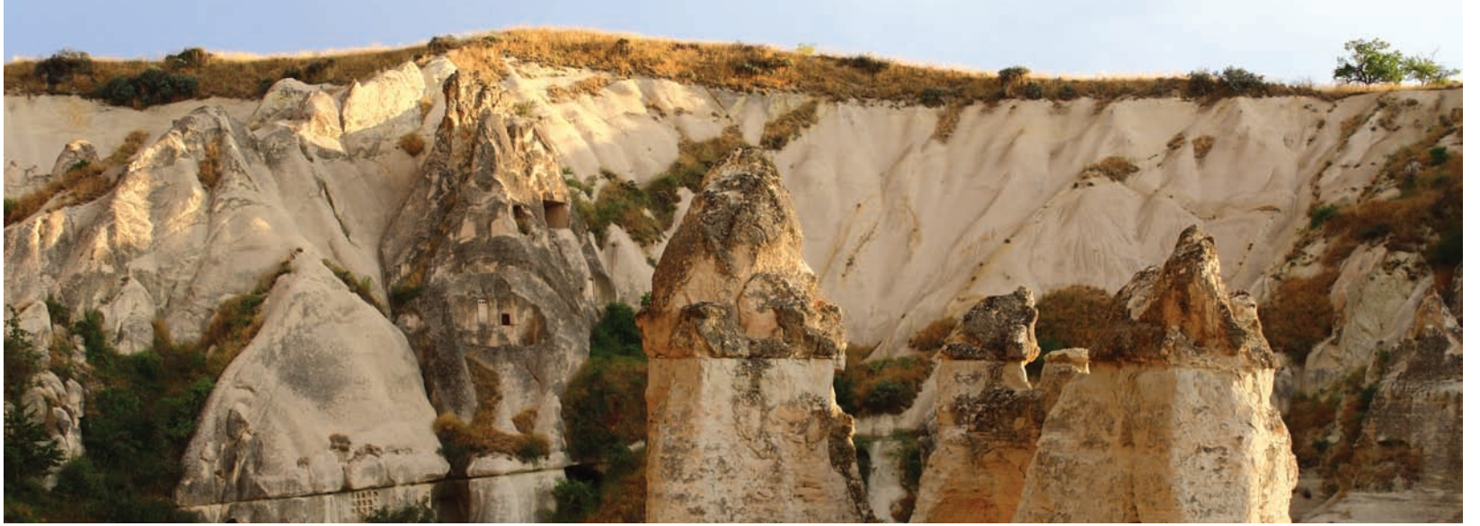
Kapadokya, FOTOĞRAF: DILRUBA KOCAŞIK