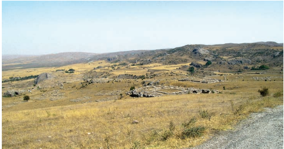
Türkiye'deki Dünya Miras Alanlarından Hattuşa Antik Kenti FOTOGRAF: MINE ESMER, 2006

“Uluslararası Mevzuatlar Işığında Türkiye'deki Eğitim Sisteminde Koruma Eğitimi: Genel Değerlendirmeler Öneriler I”: Restorasyon Konservasyon Çalışmaları Üç Aylık Bilim Dergisi, Sayı 6, Temmuz-Ağustos-Eylül 2010, s. 61-69'da yayınlanmıştır.