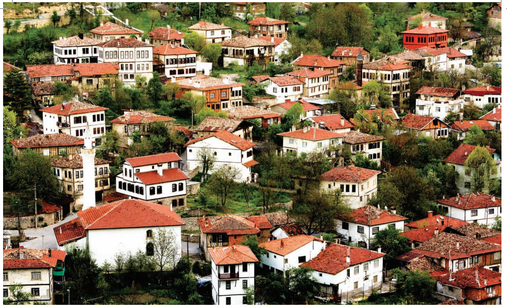
Safranbolu Evleri