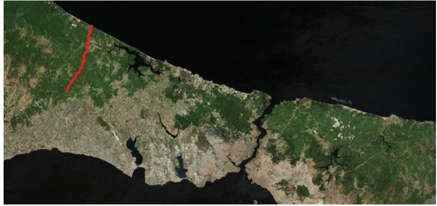
Şekil 1. Uydu görüntüsü üzerinde Anastasios surlarının konumunu gösterir harita.

Bu tarzda inşa edilen uzun sur duvarları aslında Roma askerî mimarisine özgü bir savunma sistemidir. Bu yapılar, İmparatorluğun eyalet sınırlarını ( limes ) belirleyen sur duvarlarının bir örneğini oluşturur (İmparator Hadrianus'un İngiltere'de, Traianus'un Balkanlar, Dobruca'da inşa ettirdiği uzun sur duvarları gibi). 2 Anastasios Surları'nun işlevi, başta başkent olmak üzere, sur dışı yerleşim yerlerini ve başkenti besleyen su sistemlerini tehdit edebilecek saldırılara karşı bir çeşit kalkan görevi görmektir.