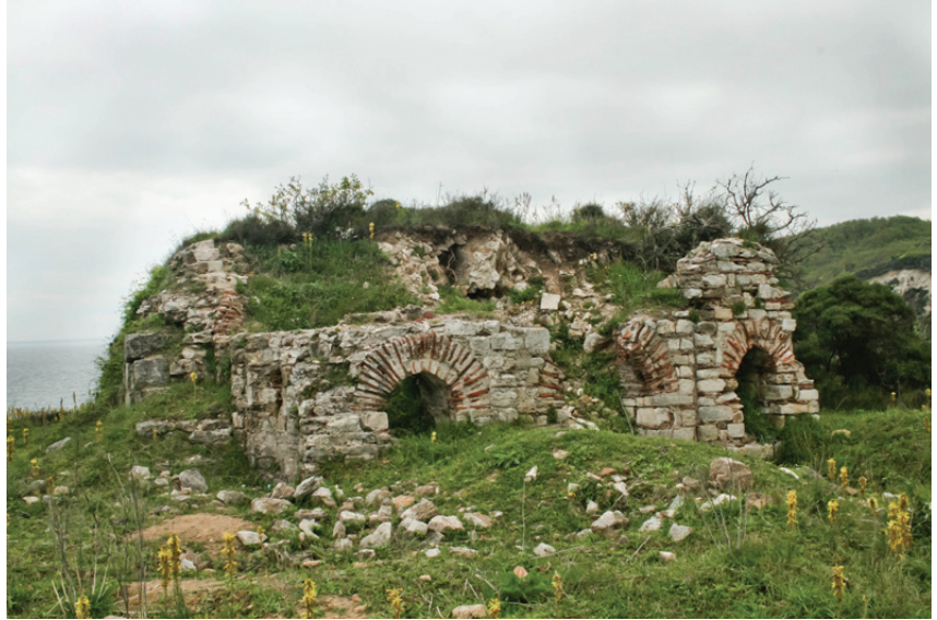
Şekil 3. Karadeniz kıyısında, Anastasios surlarının kuzey ucunda yer alan kilise kalıntısı

Anastasios Surlarının Karadeniz kıyısındaki ucu Avcık İskelesi'dir. Surlar bu noktadan sadece 500 metre batıya gittikten sonra, güneybatıya yönelerek Hisar-tepe'ye varır. Ardından Karacaköy'ün 2 km. kadar kuzeybatısındaki tepeleri izleyerek bu köyün batısından geçer; Balçıkdere, Karacaköy ve Hamza derelerini aşarak Küçük Kuşkaya tepesine, oradan da Hırsıztepe'ye varır. Duvarlar daha sonra Kurfalı köyünün içinden geçerek 245 metre