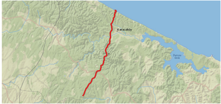
Şekil 2. Karadeniz kıyısından başlayan, Karacaköy batısından Silivri kuzeyindeki Kurfallı köyüne kadar surların kesikli olarak izlenebildiği hattı gösteren harita.

Bu uzun istihkâm yapısının genel olarak İmparator I. Anastasios (491-518) tarafından inşa ettirildiği kabul edilmektedir. 3 Bu görüş Prokopius'un, "İmparator Anastasios yaptırdı" şeklinde vermiş olduğu