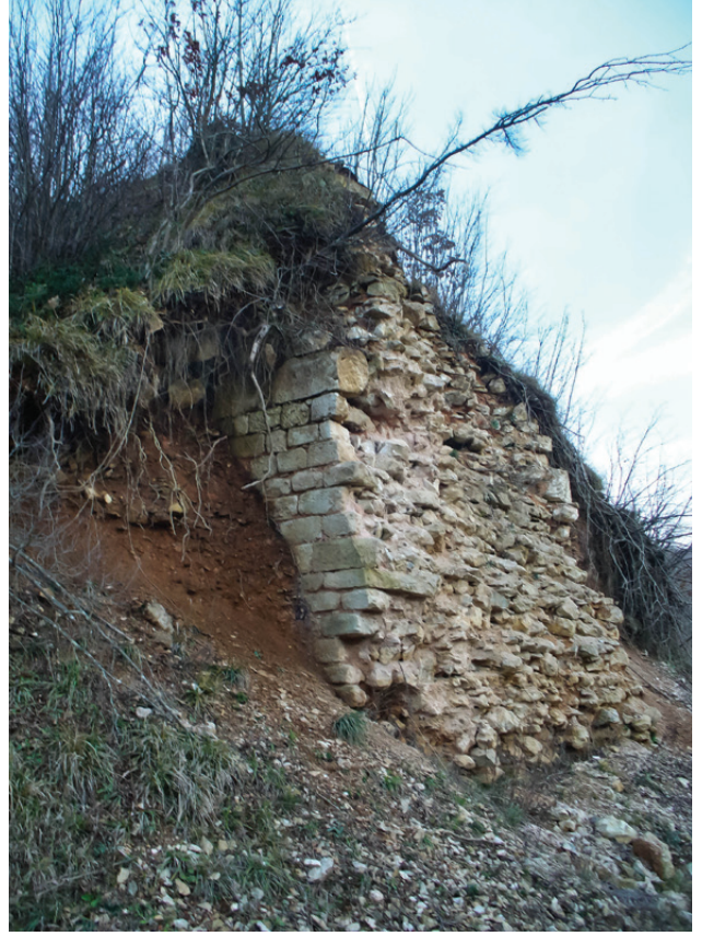
Şekil 5. b) Sur kalıntısının yoldan görünümü

fakat bu duvarlara ait herhangi bir burca rastlanmadığını söyler. 17 Oysa Schuchhardt, Karanlık Ayazma ile Çilingirtepe arasında, ondan fazla burç bulunduğunu saptamıştır. Bunlar yarım daire şeklinde kulelerdi. Schuchhardt'ın incelemeleri sırasında sur kapıları da büyük ölçüde sağlam durumda idi. Kapıların bir kısmı, burçlarla takviye edilmiş ana kapılar, diğerleri ise daha küçük ölçülerdeki ikincil (talî) kapılardı.