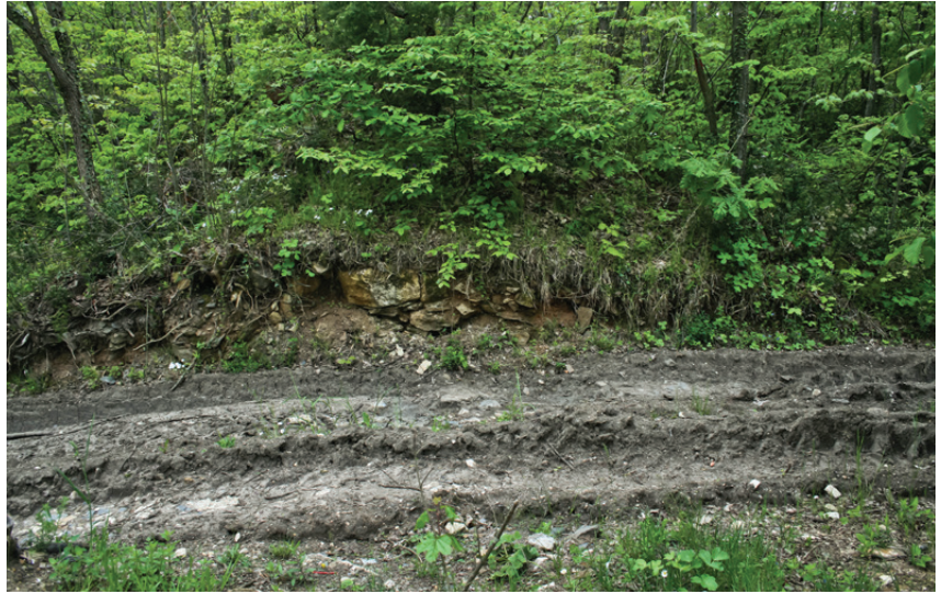
Şekil 4. Anastasios surlarının ormanlık alandaki kalıntıları. Bu kalıntılar yukarıda gösterilen kırmızı hat boyunca izlenmektedir.

yüksekliğindeki Çilingirtepe'ye, bu tepeden de Kurfalı-Fener köyü yolunun doğu kenarını izleyerek Serinkum civarındaki Sancaktepe'ye ulaşır ve Karınca burnunda Marmara Denizi'ne kavuşur.