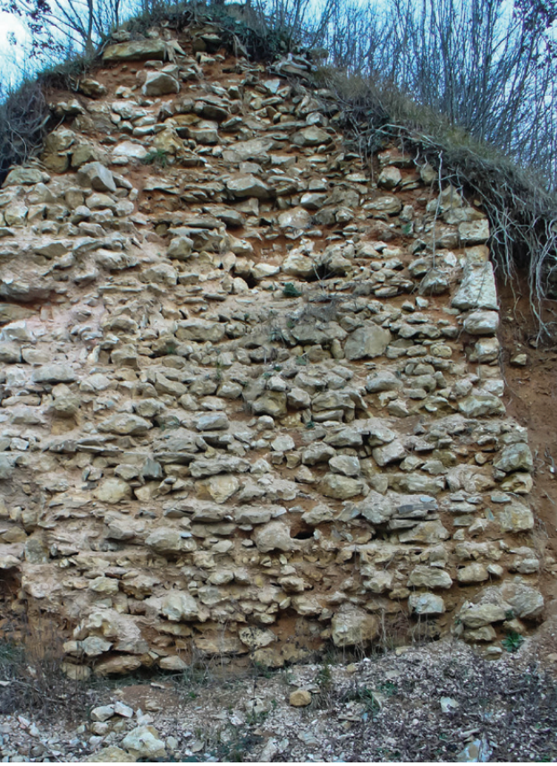
Şekil 5. a) Anastasios surları iç yapısı