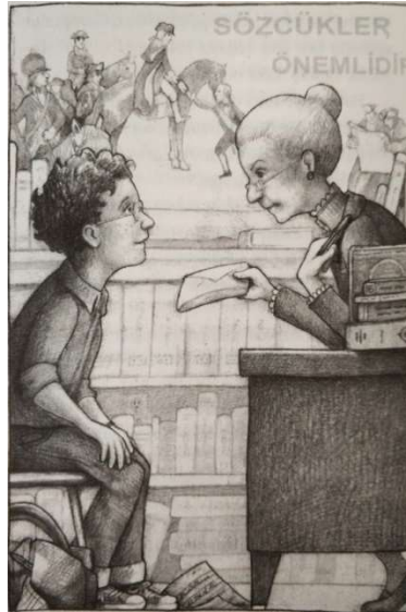
Resim 3. Bunun Adı Findel adlı eserin bir sayfası (s. 54)

"Okulda Bayan Granger ya da herhangi bir öğretmene karşı saygısızlık ettiğini öğrenirsem başın belada demektir." (s. 64)