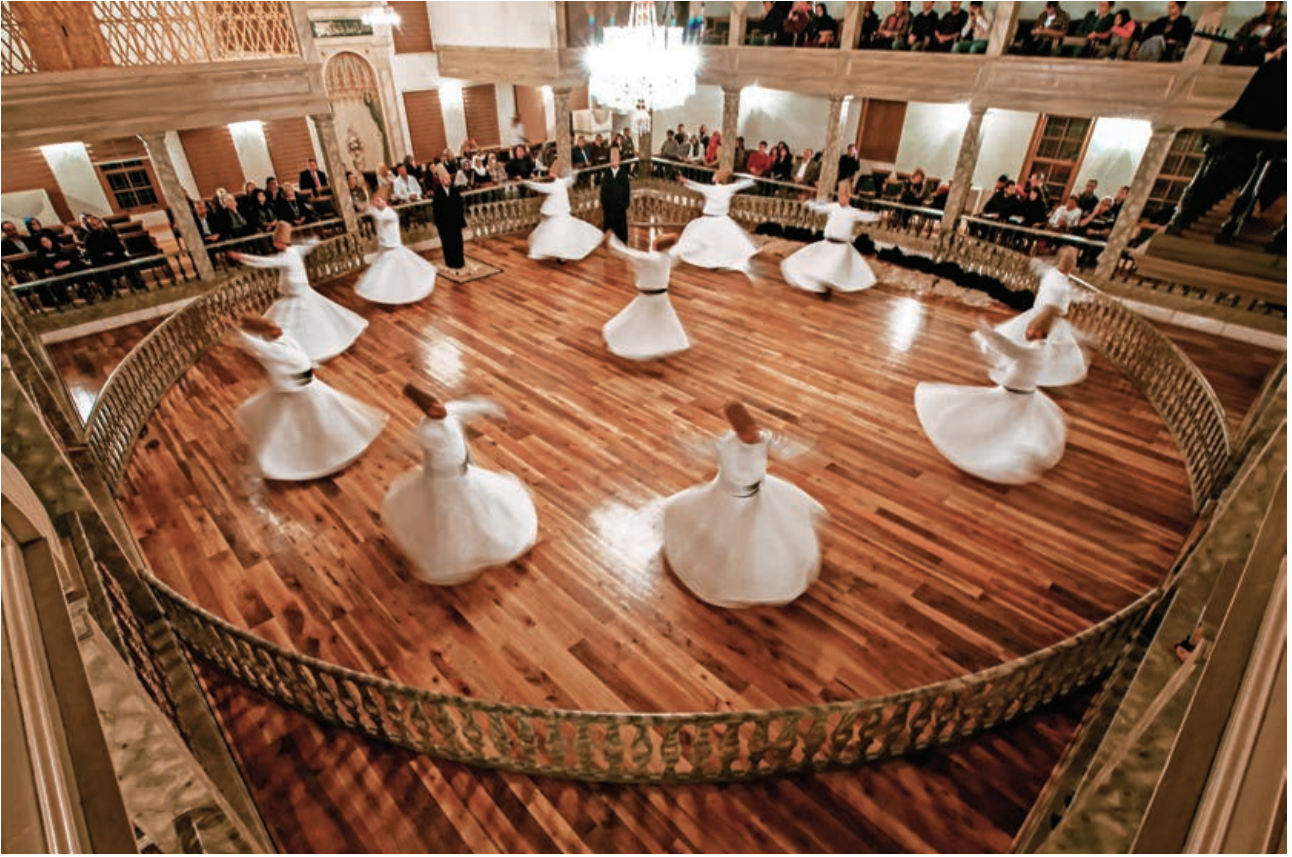
Mevlevihanede bir sema töreni, 2013

Hünkar Mahfili ve Şerbethane ana giriş kapısı ile tüm cephe detayları, eldeki arşiv fotoğrafları ve alandaki mevcut izler dikkate alınarak ve restitüsyon projesinin uygulama detayları ile uyumlu bir şekilde oluşturularak tamamlanmıştır.