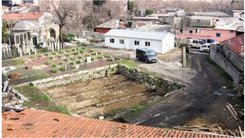
Şekil 6. Semahane binası, Sema alanı (2006)

Bu alandaki çalışmada ilk olarak Sayın Ahmet Ersen'in denetiminde, mevcut arazideki otlar ve moloz itinalı bir şekilde temizlenmiş, semahane binasına ait mevcut temeller ve izler net olarak ortaya çıkartılmıştır (Şekil 6, 7). Semahane binası, türbe ve şerbethane ile birlikte ortak çatı altında olduğundan bu mekânlara ait izlerin bulunmasına özen gösterilmiştir. Şerbethanenin temel duvarlarının gecekonduların olduğu alanda bulunması nedeniyle, bu alandaki kamulaştırma çalışmalarına hız verilmiştir. Kamulaştırma yapıp alan boşaltıldıktan sonra üzerindeki gecekondular önce temel kotuna kadar yıkılmış, daha sonra daha düşük kotta çıkabilecek kalıntılar dikkate alınarak sökümlere devam edilmiştir. Bu çalışmanın ardından şerbethaneye ait döşeme kaplamalarına, bu bölümün bağlı olduğu haremlik kısmına ve hamama ait temel izlerine ulaşılmıştır (Şekil 8).