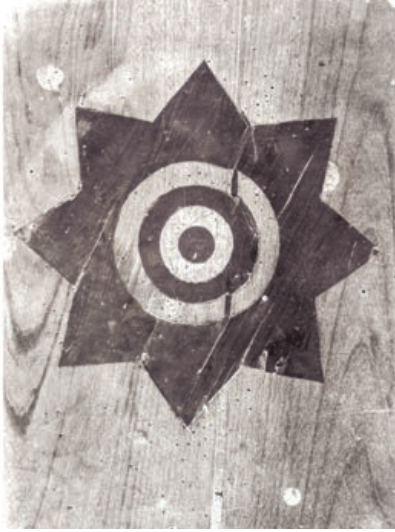
Şekil 20. Sema alanındaki kutup yıldızı detayı (Restitüsyon Aşamasında Kullanılan Arkeoloji Müzesi Fotoğrafhane Arşivinden )