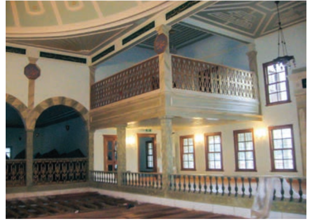
Şekil 27. Semahane Hünkar Mahfili, restorasyon sonrası

varak kaplama uygulanmıştır. Semahane'nin mihrabı ahşap karkas içerisinde oluşturulduktan sonra, arşiv fotoğrafları esas alınarak kalem işi ile ilgili restitüsyon projeleri hazırlanmış ve uygulaması yapılmıştır (Şekil 22, 23). Semahane'nin ikinci katında, ana giriş kapısının üstünde ve mihrabın karşısında yer alan, mıtırıp heyetinin (saz heyeti) yer aldığı mahfilin (Şekil 24, 25) doğusunda L planlı, saygın misafirlere ait diğer bir mahfil, batısında ise kadınlar mahfili yer almaktadır. Kadınlar mahfilinden şerbethane'nin üst katına, buradan da konağın harem kısmına geçiş bulunmaktadır. Mihrabın solundaki (doğu) bölüm ise Hünkâr Mahfili olarak tanımlanmaktadır (Şekil 26, 27). Semahane'ye zemin