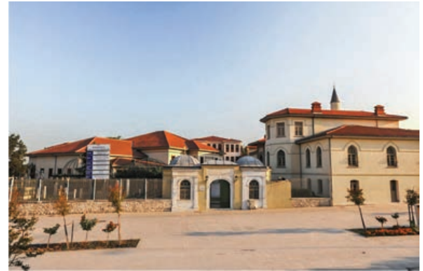
Şekil 39. Mevlevihane, restorasyon sonrası