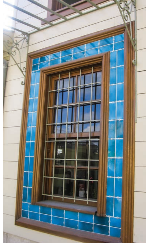
Şekil 36. Türbe niyaz penceresi, restorasyon sonrası