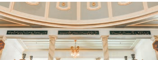
Şekil 18. Semahane kuşak yazıları