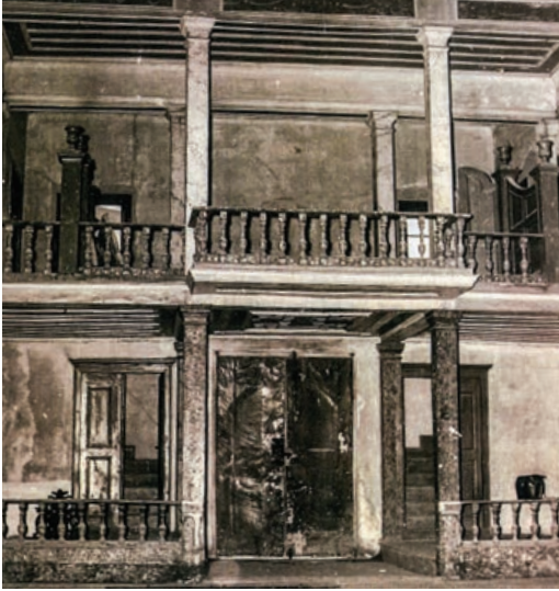
Şekil 24. Semahane ana girişi ve mıtırıp genel görünüş