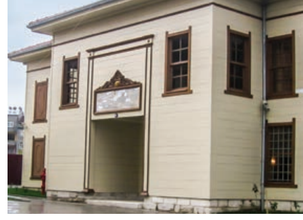
Şekil 32. Semahane giriş cephesi, restorasyon sonrası