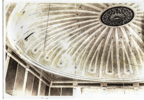
Şekil 16. Semahane'nin ahşap kubbesi