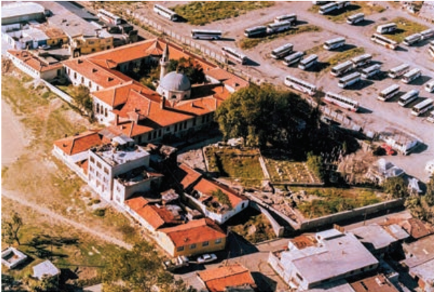
Sekil 4. Zeytinburnu Yenikapı Mevlevihanesi genel görünüm (2005)