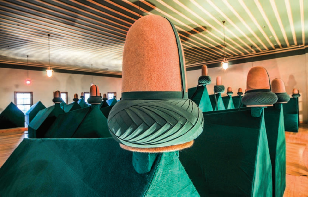
Şekil 28. Semahane Türbe, genel restorasyon sonrası