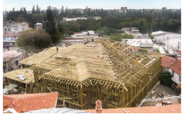
Şekil 11. Semahane ahşap karkas strüktür (2007)