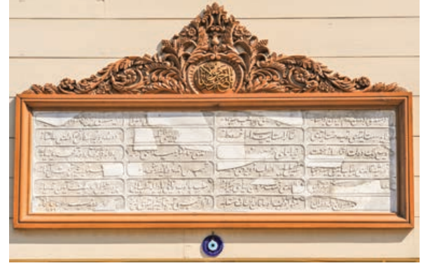
Şekil 34. Semahane giriş kapısı üzerindeki kitabe ve ahşap çerçevesi, restorasyon sonrası