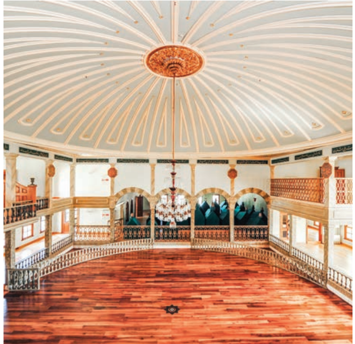
Şekil 19. Semahane iç mekândan genel görünüm