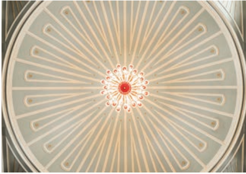
Şekil 15. Semahane ahşap kubbesi restorasyon sonrası