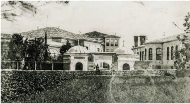
Şekil 38. Mevlevihane genel görünüm