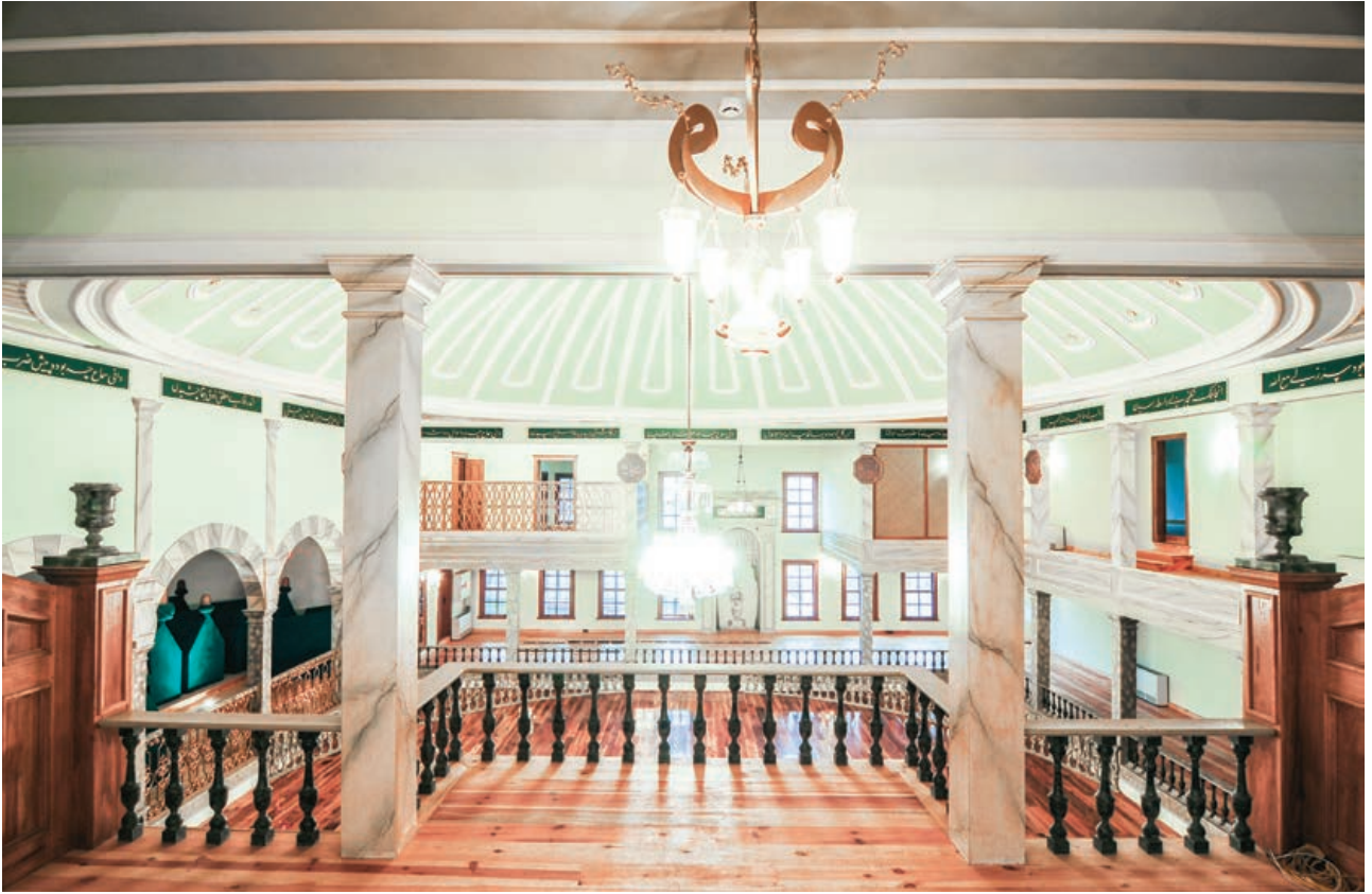
Şekil 37. Semahane mitrıbdan mihraba doğru, restorasyon sonrası