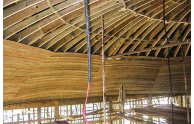
Şekil 13. Semahane ahşap kubbesinin karkas detayı

mekânların konumları ve birbirleriyle ilişkilendirilmesi konusu net olarak ortaya çıkarılmıştır.