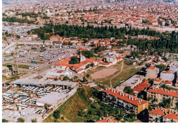
Şekil 2. Zeytinburnu Yenikapı Mevlevihanesi genel görünüm (2009).

Yenikapı Mevlevihanesi, tekke mimarisinde "Asitane" olarak adlandırılan grubun en önemli örneklerden biridir. Mevlevihane'nin kuruluşuna ilişkin en eski kayda göre 2 inşa edilen ilk yapılar şunlardır: Mescit, semahane, matbah, somathane (yemekhane bölümü) ve 24 adet derviş hücre. Ayrıca dergâh müstemilatı olarak da; çeşme, 5 su kuyusu, 2 büyük musluk, kahvehane, 2 ekme fırını, birer adet aktar,