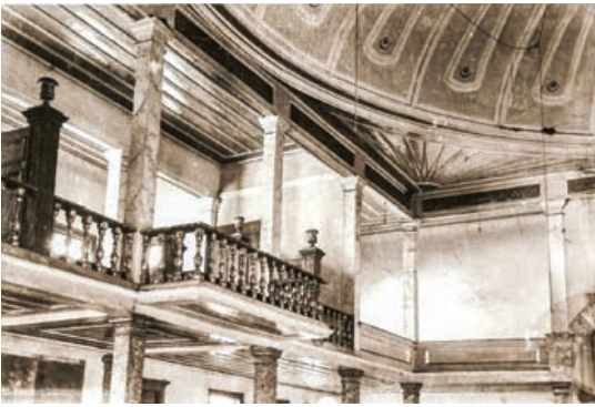
Şekil 17. Semahane Mitrip detayı