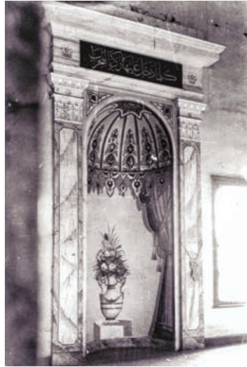
Şekil 22. Semahane mihrap detayı

bezeme programı oluşturulmuştur (Şekil 14). Restitüsyon projesine göre, kubbenin merkezine barok üslupta oymalı ve yıldızlı ahşap bir göbek oturtulmuş, onun dışında kalan yüzey ise çıtalarla 24 dilime ayrılmış ve bunlar; ince, uzun üçgenler, ay-yıldız ve yıldız motifleri ile bezenmiştir (Şekil 15, 16). Semahane kubbe kasnağı ile tavan arasında kalan üçgen alanlarda ise, “Sultan Mahmut Güneşi” olarak adlandırılan ışınal bir bezeme yapılarak monte edilmiştir. Arşiv fotoğrafları incelendiğinde, kubbe kasnak kotunda; üst kattaki sütunlar ile ahşap kubbe arasındaki alında her sütun açıklığına birer tane olmak üzere yirmi adet kitabe olduğu görülmekteydi (Şekil 17, 18). Bu kitabelerle ilgili olarak Prof. Dr. Uğur Derman’ın bir makalesi- ne 7 ve eldeki verilere dayanılarak istif yapılabilmekteydi; buna göre yeşil zemin üzerine altın varak ile bu ahşap hat panolar hazırlanmıştır (Şekil 19). Semahane merkezi kubbeye kanvas üzeri ahşap kaplama uygulanmış; diğer mekânlarda ise, arşiv fotoğraflarından yararlanılarak tüm profil detayları aslına uygun bir biçimde oluşturularak çıtalı tavan kaplamaları yapılmıştır. Semahanenin, ana mekân hariç olmak üzere diğer tüm bölümlerinin döşemelerinde