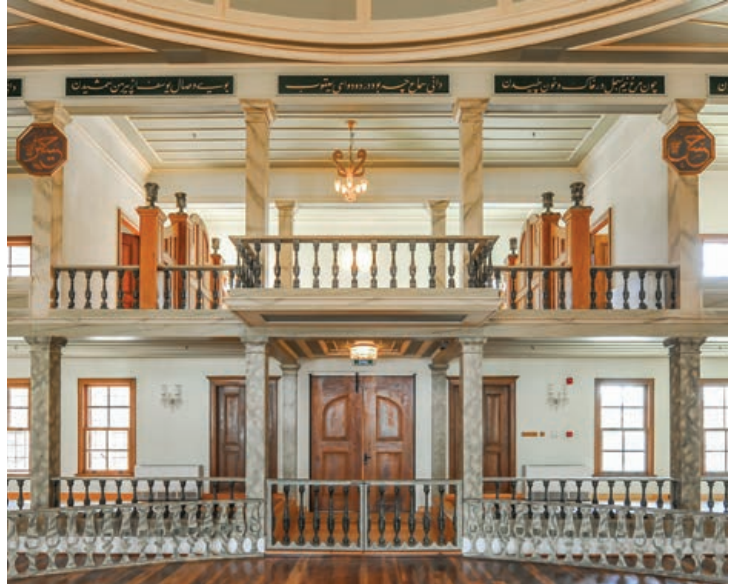
Şekil 25. Semahane ana girişi ve mıtırıp genel görünüş, restorasyon sonrası