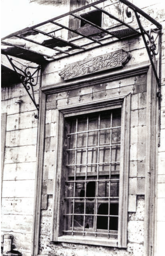
Şekil 35. Türbe niyaz penceresi