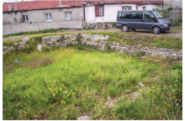
Sekil 5. Zeytinburnu Yenikapı Mevlevihanesi, Semahane (2006)

dan danışmanların denetiminde çalışma başlatılmıştır (Şekil 3a-b). Onaylı restorasyon projesinde, en az müdahale ile mümkün olduğunca özgün elemanların değerlendirilerek onarılması önerilmiş; uygulamada da bu yaklaşım korunmuştur.