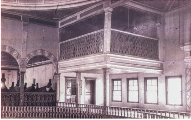
Şekil 26. Semahane Hünkar Mahfili (Restitüsyon Aşamasında Kullanılan Arkeoloji Müzesi Fotoğrafhane Arşivinden )