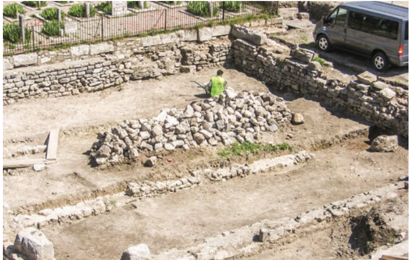
Şekil 7. Semahane binası, Sema alanı temel kalıntısı (2007)

Bu aşamada proje revize edilmiş ve alanda net ölçüler alınarak yapıların gerçek boyutlarına ulaşılmıştır. Bu veriler, Sayın Ahmet Ersen'in arşivindeki kaynak kitaplarda 5 ve diğer dönem yapılarındaki 6 ölçülerle karşılaştırılarak onaylı restorasyon projesi üzerinden uygulama projeleri ve nokta detayları hazırlanmıştır.