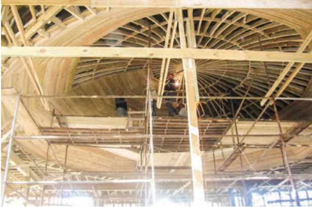
Şekil 12. Semahane'nin ahşap kubbesi