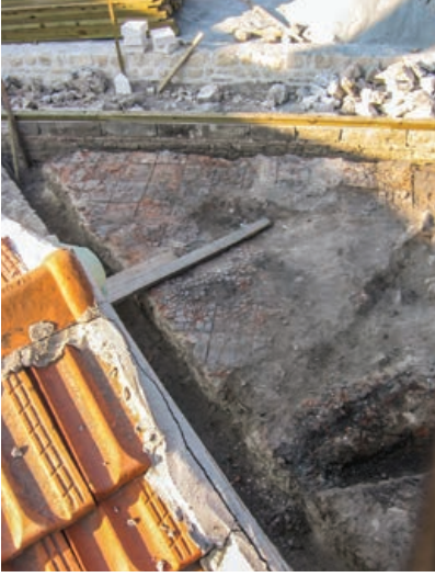
Şekil 8. Şerbethane temel kalıntısı