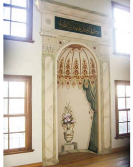
Şekil 23. Semahane mihrap detayı, Restorasyon Sonrası

budaksız çam kaplama kullanılmıştır. Sema alanında ise, aslına uygun olarak döşemede kendi yağını koruyan ceviz kaplama tercih edilmiştir. Ayrıca bu mekân ile ilgili olarak, mevcut arşiv fotoğraflarında görülen “kutup yıldızı” motifi ile ilgili birçok araştırma yapılmış, ayrıca semazenler ve semahanenin son bekçisiyle yapılan görüşmeler sonucunda, zeminde, merkezde sert ağaçtan (koyu renkler abanoz ağacı) “kutuphane” sembolü olan figür işlenmiştir (Şekil 20, 21). Sema alanının tam