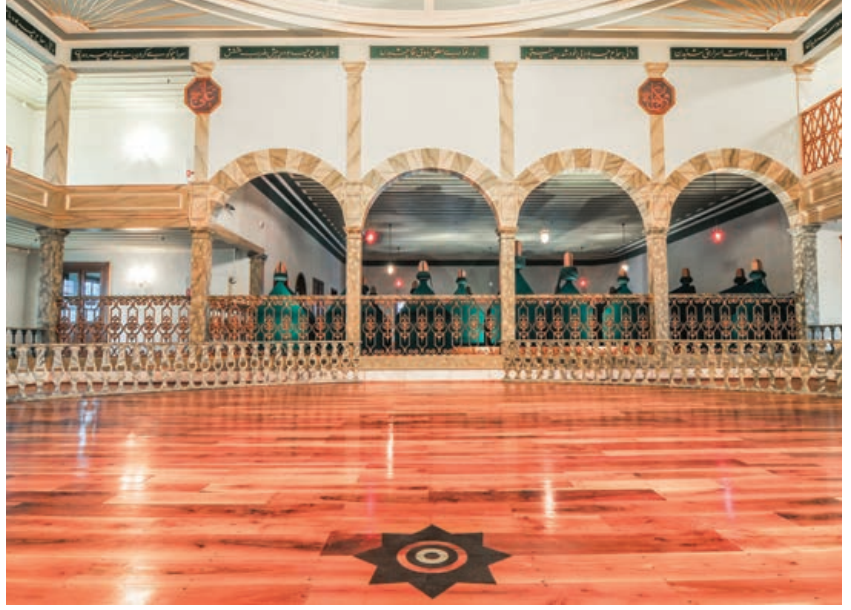
Şekil 21. Sema Alanı, restorasyon sonrası

bezeme programı oluşturulmuştur (Şekil 14). Restitüsyon projesine göre, kubbenin merkezine barok üslupta oymalı ve yıldızlı ahşap bir göbek oturtulmuş, onun dışında kalan yüzey ise çıtalarla 24 dilime ayrılmış ve bunlar; ince, uzun üçgenler, ay-yıldız ve yıldız motifleri ile bezenmiştir (Şekil 15, 16). Semahane kubbe kasnağı ile tavan arasında kalan üçgen alanlarda ise, “Sultan Mahmut Güneşi” olarak adlandırılan ışınal bir bezeme yapılarak monte edilmiştir. Arşiv fotoğrafları incelendiğinde, kubbe kasnak kotunda; üst kattaki sütunlar ile ahşap kubbe arasındaki alında her sütun açıklığına birer tane olmak üzere yirmi adet kitabe olduğu görülmekteydi (Şekil 17, 18). Bu kitabelerle ilgili olarak Prof. Dr. Uğur Derman’ın bir makalesi- ne 7 ve eldeki verilere dayanılarak istif yapılabilmekteydi; buna göre yeşil zemin üzerine altın varak ile bu ahşap hat panolar hazırlanmıştır (Şekil 19). Semahane merkezi kubbeye kanvas üzeri ahşap kaplama uygulanmış; diğer mekânlarda ise, arşiv fotoğraflarından yararlanılarak tüm profil detayları aslına uygun bir biçimde oluşturularak çıtalı tavan kaplamaları yapılmıştır. Semahanenin, ana mekân hariç olmak üzere diğer tüm bölümlerinin döşemelerinde