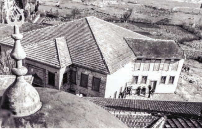
Şekil 29. Semahane-Türbe-Şerbethane