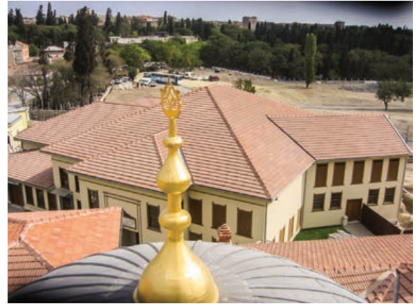
Şekil 30. Semahane-Türbe-Şerbethane, restorasyon sonrası

geçiş için kullanılan, hem tavanı hem de döşemesi ahşap kaplama olan bir mekândır. Zemin kat ise şerbet yapıp dağıtılan bir yer olup bu mekânın da tavanı ahşap kaplıdır, döşemesiyse kazı sonrasında çıkan kare tuğla izi esas alınarak yeniden bu malzeme ile kaplanmıştır. İç mekân düzenlemesi ile ilgili net bilgi olmadığı için yalnızca bir lavabo, tezgâh ve üst kotlarda da istif için raf yapılmıştır (Şekil 29, 30).