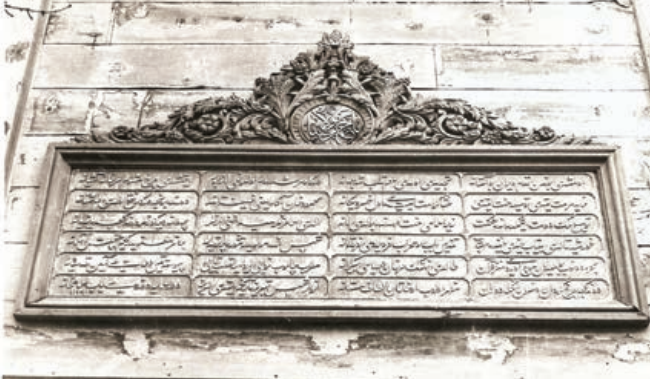
Şekil 33. Semahane giriş kapısı üzerindeki kitabe ve ahşap çerçevesi