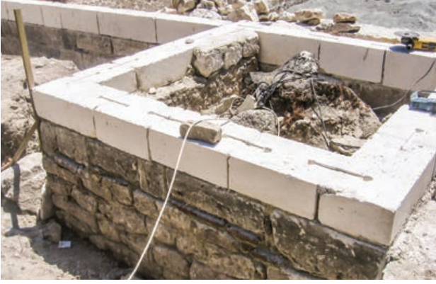
Şekil 10. Kesme taş ankraj detayı