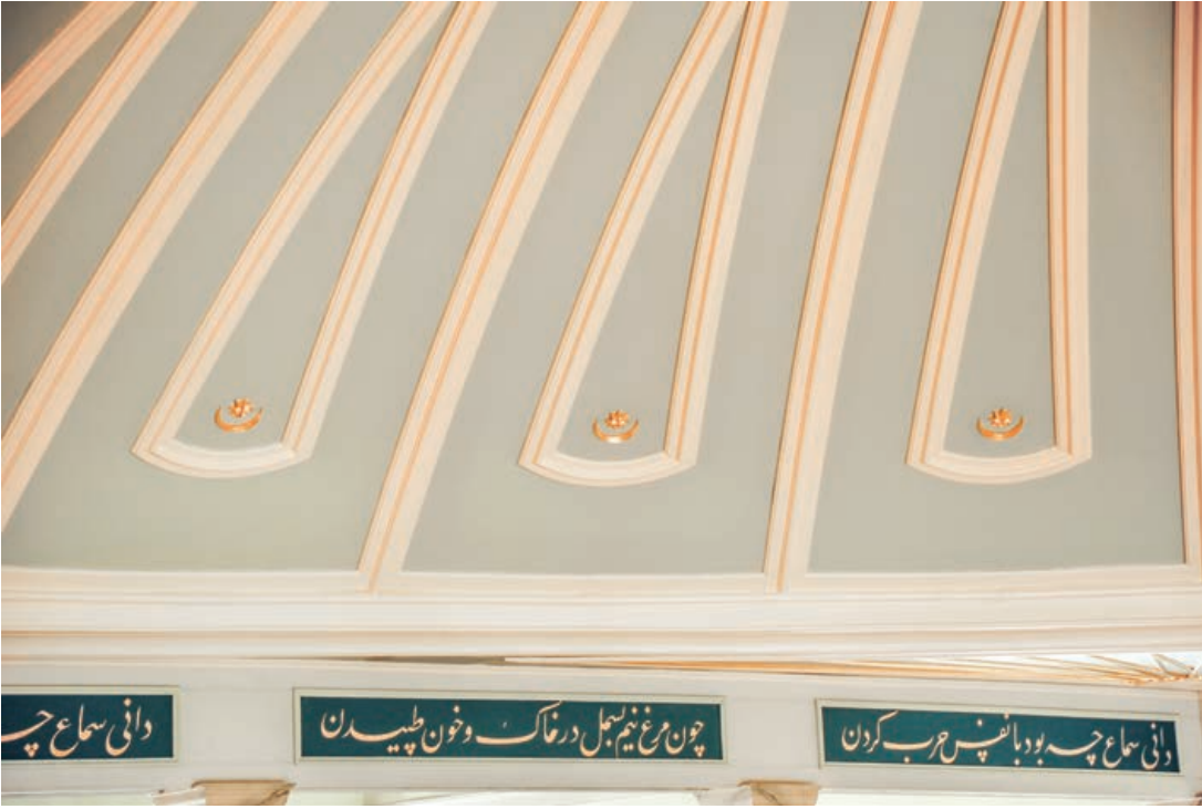
Şekil 14. Semahane ahşap kubbesinin bezeme detayı