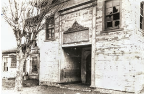
Şekil 31. Semahane giriş cephesi