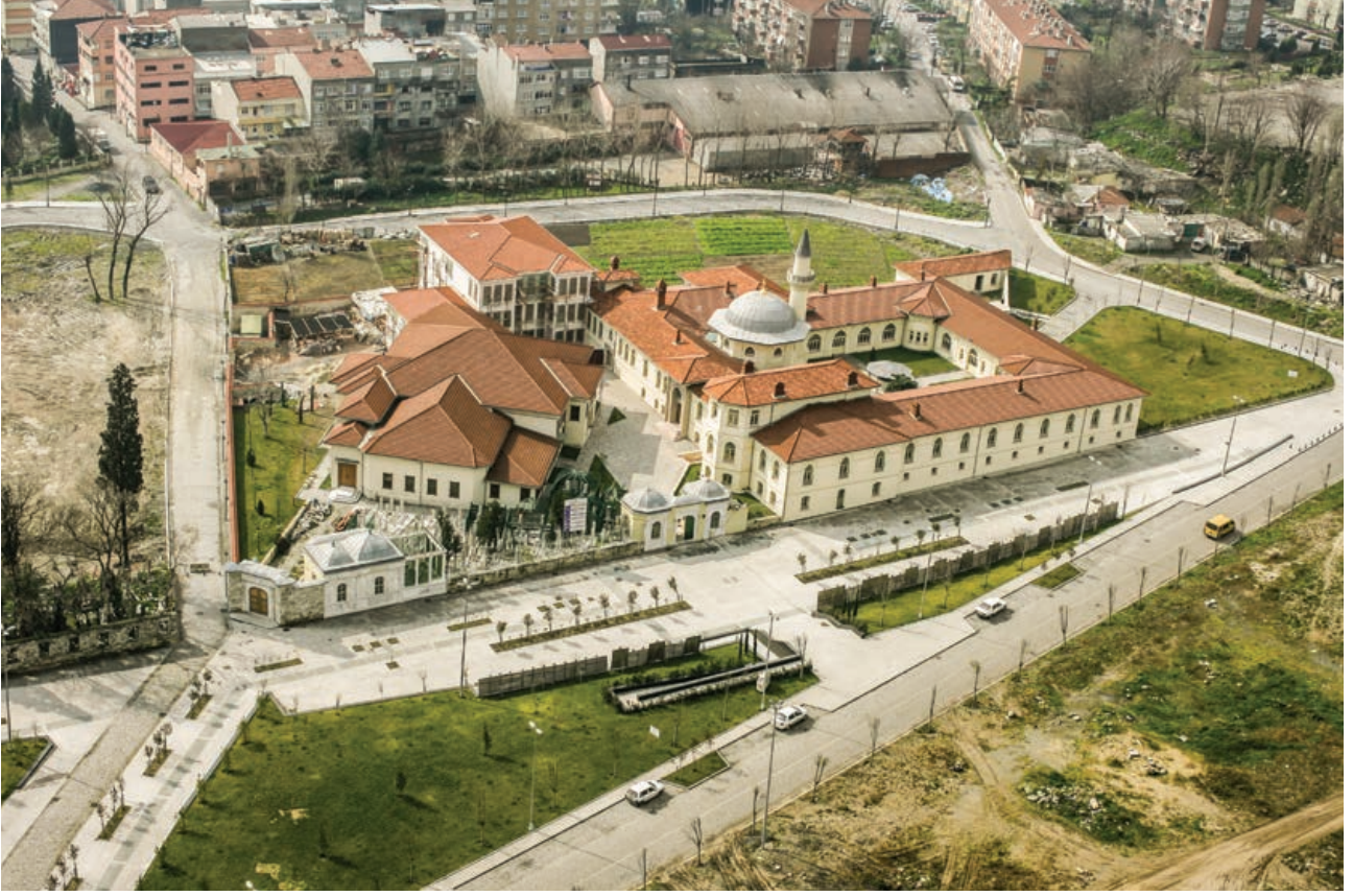
Şekil 1. Zeytinburnu Yenikapı Mevlevihanesi genel görünüm (2010).