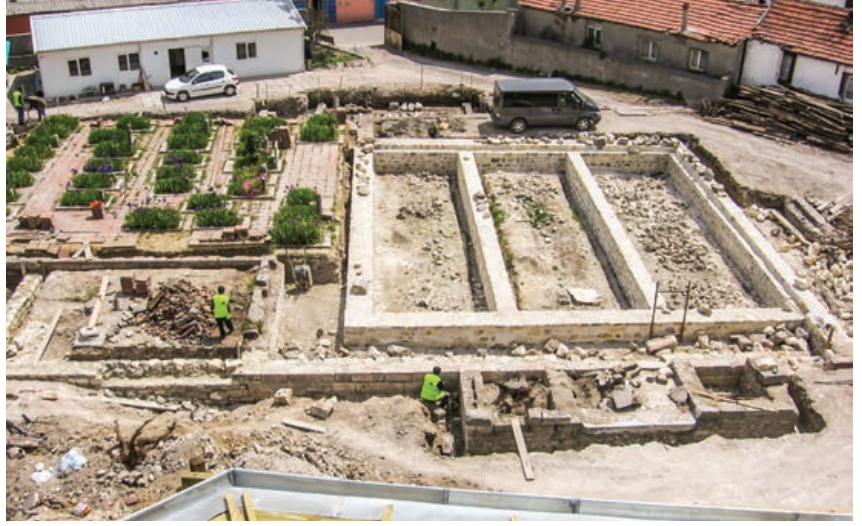
Şekil 9. Semahane temellerinin sağlıklılaştırılması aşaması