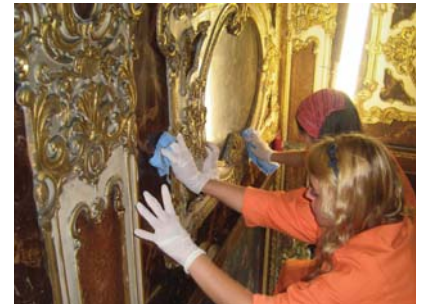
Öğrenci uygulamasından örnekler

tarafından uygulama yapıldı. Proje; Rektörlüğümüz tarafından da desteklenerek maddi ve manevi her türlü olanak sağlanmış oldu.