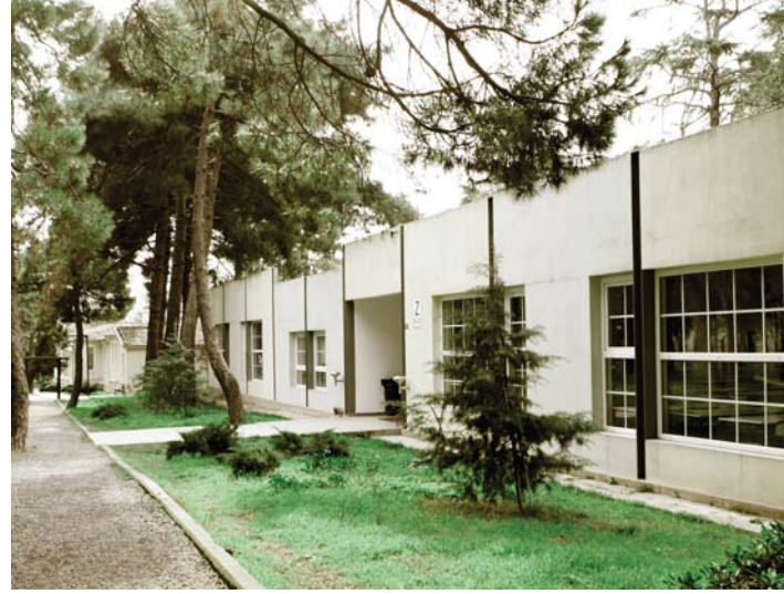
Milli Saraylar Meslek Yüksekokulu atölyeleri ve idari binaları