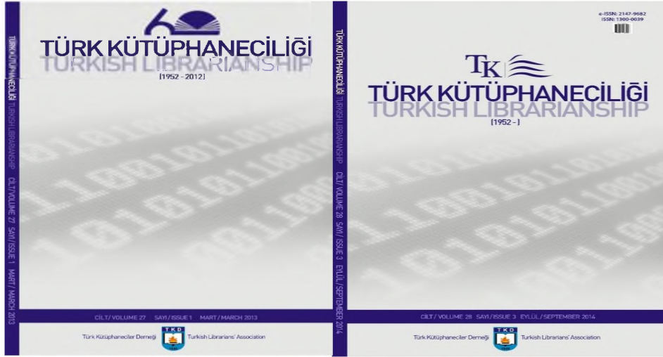
(TK Kapak 2013)