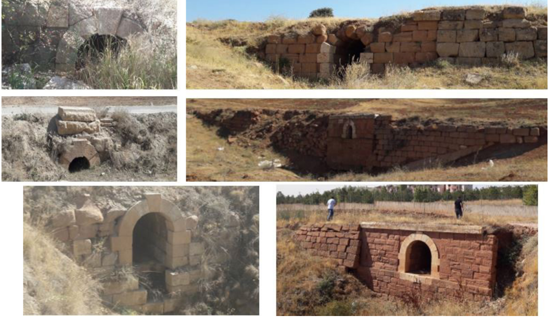
Foto. 9- Yuvarlak Kemerli Menfezler