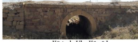
Körtuzla-Ulaş Köprü I