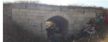
Akgedik-Kangal VIII Köprüsü