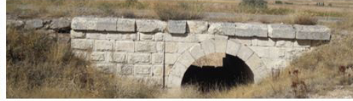
Akgedik-Kangal II Köprüsü