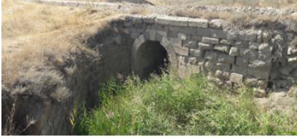
Körtuzla-Ulaş Köprü VI