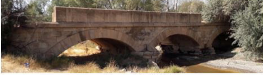
Tecer Köprüsü I