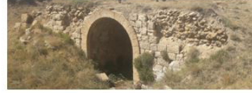
Körtuzla-Ulaş Köprü III (Acısuyun Köprüsü)