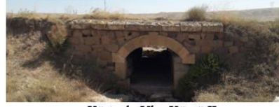
Körtuzla-Ulaş Köprü II