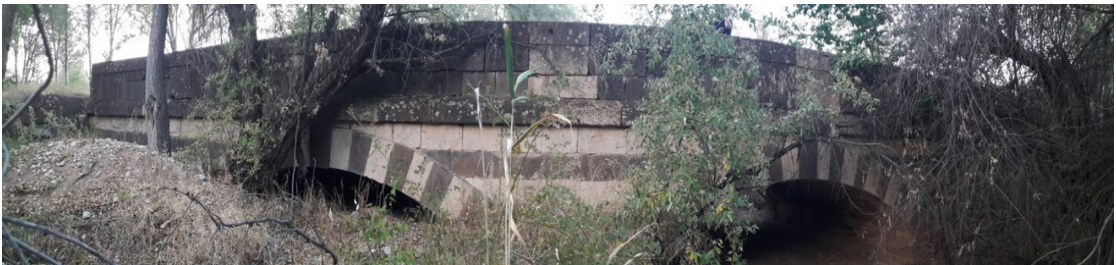
Foto. 6- İki Gözlü Köprüler, Akgedik Köprüsü