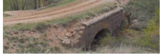
Sipahikoyağı Köprü II