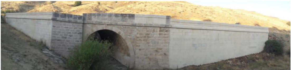
Halil Rifat Paşa (Verev) Köprüsü