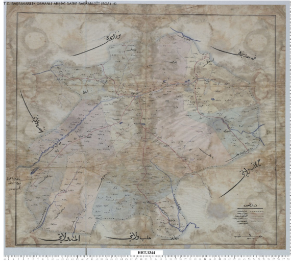
Harita 2. H.1341-M.1922 tarihli Sivas ve Kazalarının Yollarını Gösterir Harita (B.O.A., HRT.h/1344)