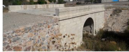
Akgedik-Kangal VI (Bozarmut Köprüsü)