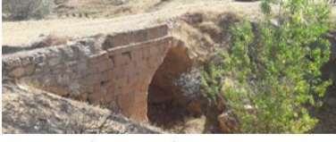
Sivas-Körtuzla Köprü I