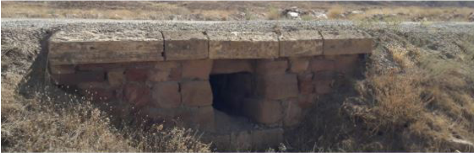
Foto. 7- Üç Gözlü Köprüler