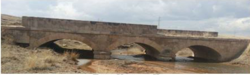
Tecer Köprüsü II