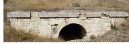
Akgedik-Kangal I Köprüsü