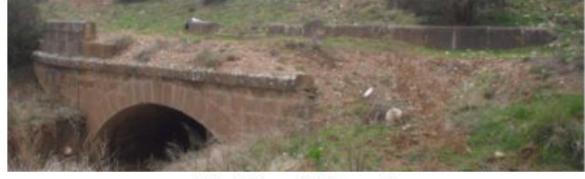
Sipahikoyağı Köprü I