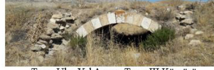
Tecer-Ulaş Yol Ayrımı Tecer III Köprüsü