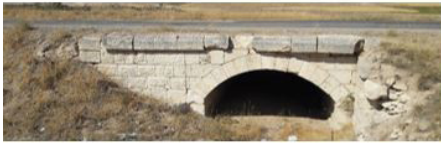
Akgedik-Kangal V Köprüsü