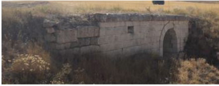
Akgedik-Kangal III Köprüsü