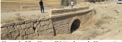
Körtuzla-Ulaş Köprü IV (Ambartarla Köprüsü)