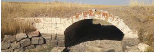
Kangal-Yeşildere Köprü I