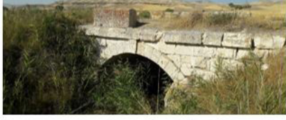
Akgedik-Kangal IX Köprüsü