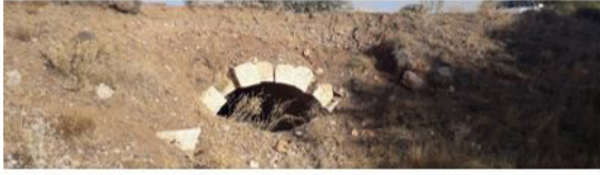
Kangal-Yeşildere Köprü II