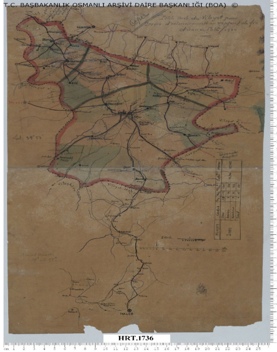
Harita 1. R.1316-M.1900 tarihli Sivas Vilayeti Yolları ile Çevre Vilayetlere Giden Yolların Gösterildiği Harita (B.O.A., HRT.H/1736)