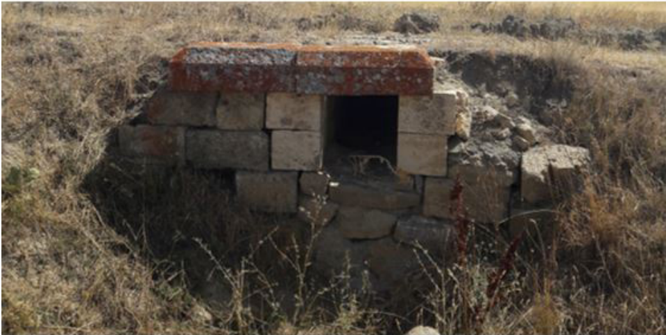
Foto. 8- Düz Atkılı Menfezler