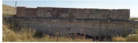
Akgedik-Kangal IV Köprüsü