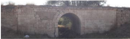
Akgedik-Kangal VII Köprüsü