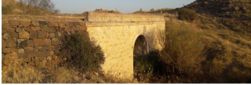
Kötüntün Hanı Köprüsü