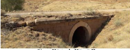
Sivas-Körtuzla Köprü II