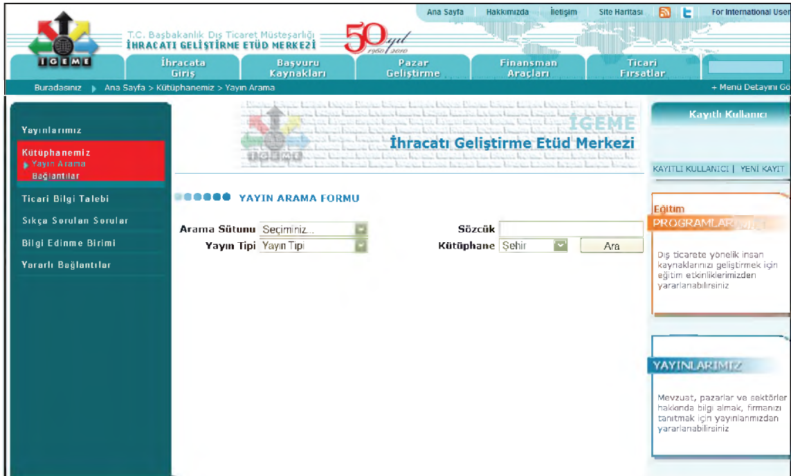
(Şekil 5): Yayın Arama butonuna tıkladığında sayfanın görüntüsü.