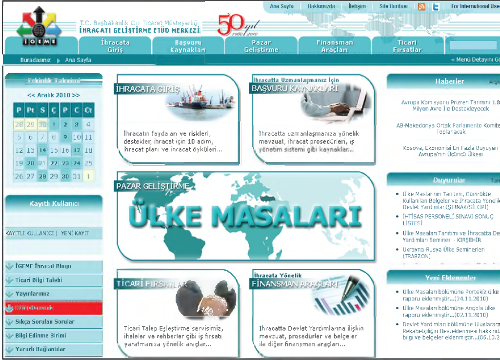
(Şekil 1): İGEME web sitesinin ana sayfa görüntüsü.

ayırt edebilmesi için bağlantıların arka zemini yeşil, yazı rengi beyazdır; başlıkların yazı rengi yeşildir. İGEME' nin web sayfası rengi ile uyumlu olduğundan dolayı renk seçimi uygundur. Her sayfada İGEME logosu altında Buradasınız başlığı altında kullanıcının hangi sayfada olduğunu gösteren bir bölümün olması iyi bir özelliktir.