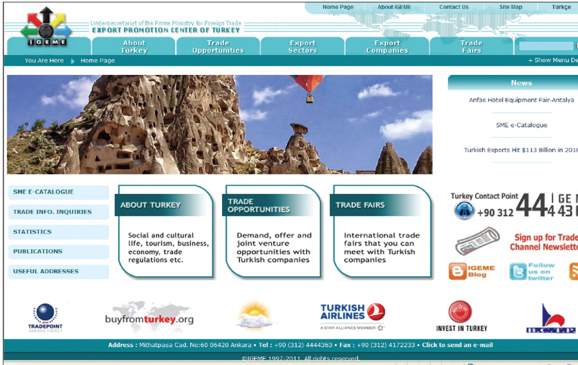
(Şekil 4): For International Users butonu tıklandığında sayfanın görüntüsü.

For International Users butonu : Bu buton tıklandığında İGEME web sitesi ana sayfasının İngilizce ara yüzüne erişilmektedir. İGEME'nin Türkçe ana sayfasıyla arasında bazı farklılıklar bulunmaktadır. Yabancı kullanıcılar için "Turkish Airlines" adı altında bir bağlantı bulunmaktadır. Bu bağlantıdan kullanıcı uçak biletini alabilmektedir. Türkiye'nin hava durumunu gösteren bir bağlantı, Türkiye'nin turistik yerlerini tanıtan bir bağlantı vb. farklılıklar bulunmaktadır. Bu sayfa içerisinde Türkiye'yi tanıtan resimler bulunmaktadır. Resimlerin yan tarafında İGEME ile ilgili haberler bulunmaktadır. Renkli bir sayfadır. Ancak bilgiler dağınık bir şekilde verilmiştir. Daha sade bir ana sayfa hazırlanabilirdi. Sayfanın altında yer alan bilgiler bu şekilde dağınık olarak değil de bir bağlantı halinde verilebilirdi. Sayfanın sağ tarafında İGEME'nin telefon numarası verilmiştir ve sayfanın üst tarafında "contact us" başlığı altında İGEME ile ilgili iletişim bilgileri verilmiştir. Telefon numarasının bu bağlantı altında verilmesi yerinde olacaktır. İngilizce ara yüzde Kütüphane ile ilgili bir buton veya yönlendirme bulunmamaktadır. Bunun nedeni kurumun hedef kitlesinin ağırlıklı olarak yurt içi ihracatçılardan oluşmasıdır. 3