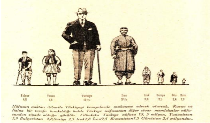
Resim 1: 1929 İtibarıyla Türkiye Nüfusunun Bazı Devletlerle Karşılaştırılması Kaynak: Faik Sabri, Türkiye Coğrafyası, 1929, s.172.

Faik Sabri tarafından yazılan bu kitap 1942 yılına kadar ders kitabı olarak okutulmuştur. Bu ders kitabından sonra Besim Darkot tarafından lise üçüncü sınıflar için hazırlanan ve maarif matbaası tarafından basımı yapılan Türkiye Coğrafyası adlı kitap ders kitabı olarak kabul edilmiş ve 1955 yılına kadar okutulmuştur. Kitapta her kabul edildiği dönemde belirli istatistiksel düzenlemeler yapılmıştır.