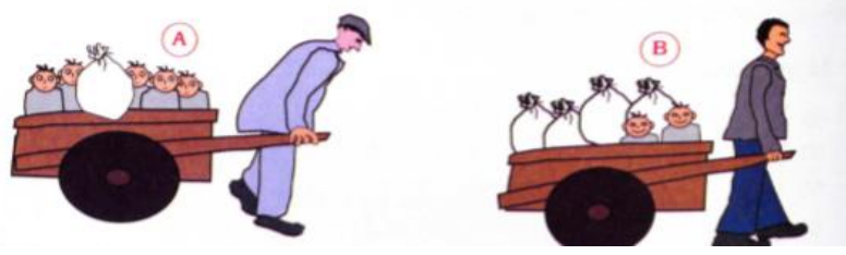
Resim 4: Etkinlik Örneği

gençlerin istihdam edilebilirliğini artıracak yeni mekanizmalara ihtiyaç bulunduğu belirtilmektedir (TBMM, 2006). Yine 2013 yılında nüfus politikalarının bir ülkedeki ekonomiyi nasıl etkilediğine dair öğrencileri düşündürmeye yönelik ifadeler ve görseller mevcut olduğu tespit edilmiştir. Bu görsellerden bazıları örnek olarak aşağıda verilmiştir.