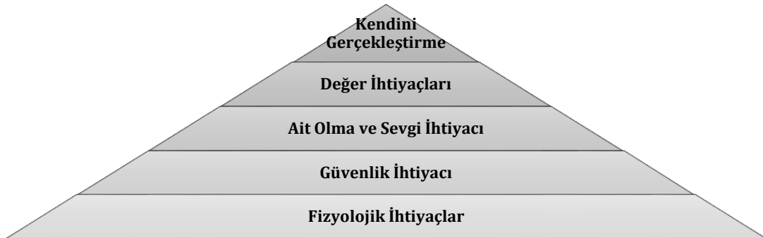
Şekil 1: İhtiyaçlar Piramidi

Güvenlik kelimesinin Latince kökenine bakıldığında “se” (olmaksızın) ve “cura” (endişe, sorun) kelimelerinden oluştuğu görülmektedir (Online Latin Dictionary, 2018). Arends (2009, s. 5) kelimenin Latince kökenin anlam olarak birtakım duygulara karşılık geldiğini ve bunlarla ilişkili olduğunu belirtmektedir. Arapça kökeni ise “aman” ve “amn” kelimelerinden türetilerek emniyet içinde olma anlamına gelmektedir (Etimoloji Türkçe, 2018). Demiray ve İşcan (2008, s. 149) Heisenberg’ten aktararak çalışmalarında güvenliği toplumun emniyet altına alınma isteği ile birey ve eşyaların gelecekte de korunacağına olan inanç anlamını içerdiğini belirtmektedir. Mortimer (1992, s. 6) güvenliği, toplumun şiddet olaylarından ve bunların sonucunda oluşan tehlikelerden uzak bir şekilde yaşamlarını devam ettirebilmeleri olarak ele almaktadır. Sosyal bir varlık olarak insanın öncelikli olarak barınma, ısınma ve yeme-içme gibi ihtiyaçlarını karşılama isteği bulunmaktadır. Bu ihtiyaçların sadece insanlar için değil tüm canlıların yaşamsal fonksiyonları bakımından gerekli olduğu düşünülebilir. Maslow’un (1943, s. 376) ihtiyaçlar hiyerarşisi teorisi, Şekil-1’de görüldüğü gibi bir piramit olarak sembolize edilmektedir. İlk sırada yer alan fiziksel ihtiyaçlardan sonra güvenlik ihtiyacı gelmekte ve insanlar adına güvenlik olgusunun önemine dikkat çekilmektedir.