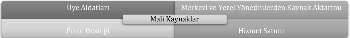
Şekil 4: Çevre Koruma Kooperatiflerinin Mali Kaynakları

Örgüt, çevresel güvenliğe ilişkin hayata geçirdiği hizmetler ve projelerle yerleşim yerindeki ekonomik faaliyetleri etkileyebilir. Bu bakımdan bölge halkında oluşturacağı çevre bilinci sonucunda bireyler, ekonomik olarak yapacakları her türlü faaliyette çevreyi ön planda tutabilir. Böylece hem ekolojik hem de ekonomik kaygılar göz önüne alınarak yatırımlar hayata geçirilebilir ve sürdürülebilir kalkınma hedeflerine ulaşılabilir.