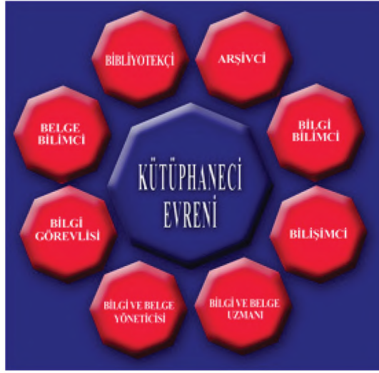
(Şekil 1): Kütüphaneci Evreni

Arapça'da kitaplar manasına gelen "kütüb" ile Farsça'da ev manasına gelen "hane" sözcüğünün bileşiminden oluşan "kütüphane" terimi, mesleği gerçekleştiren kişi anlamında "kütüphaneci" terimi ile Türkçemize kazandırılmış bir sözcüktür. Bugün yerli ve yabancı kelimelerden oluşan birçok sözcük bu mesleki terimle aynı anlamdadır.