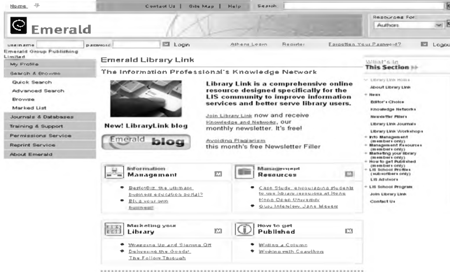
Resim 3: LibraryLink sayfası, kütüphaneciler ve bilgi profesyonelleri için online portal