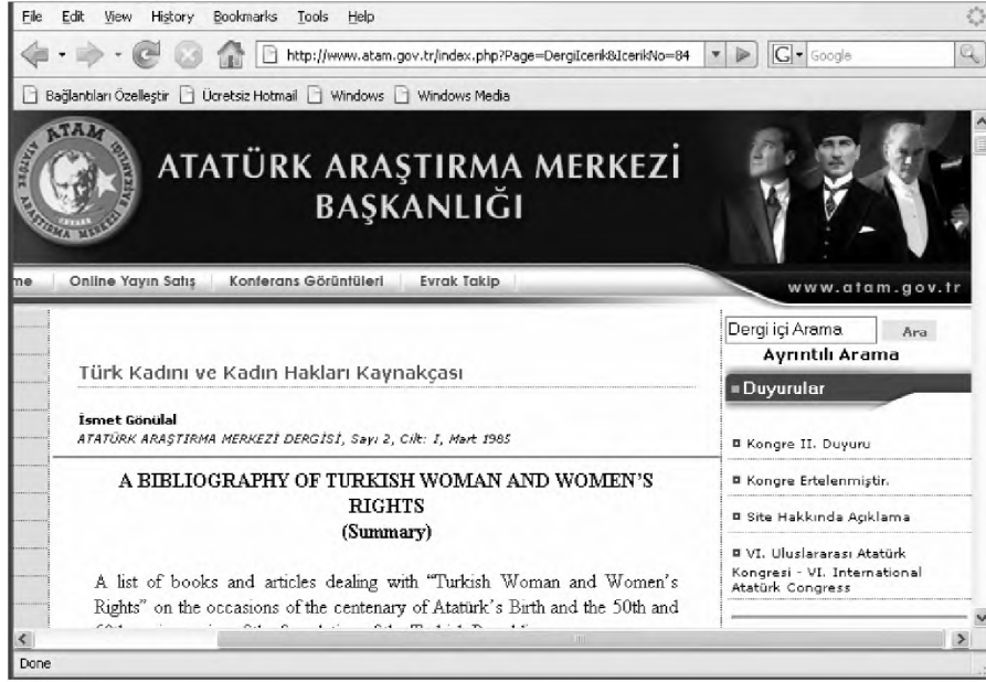
Şekil 3: Katalog Kaydında Yer Alan Bağlantı Adresine Erişildiğinde Kurum Web Sayfası Üzerinden Erişilen Tam Metin Makale.