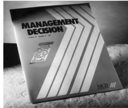
Resim 1: 1967’de Management Decision dergisinin orjinal kapağı

Takip eden yıllarda şirketin uzmanlık alanı işletme yönetiminden mühendislik ve kütüphanecilik alanlarına genişledi. Şirket mütevazı başlangıcından bugüne kadar önemli derecede büyüdü, tanınırlığı ve kalitesi dünyaca kabul edilmiş temel yayınları portföyüne ekledi: European Journal of Marketing , Journal of Documentation , Leadership & Organization Development Journal , The TQM Magazine , Industrial Robot ve diğerleri. 2001’de MCB University Press, İnternet’e başarılı bir şekilde uyum sağlayarak varlığını 21. yüzyıla taşımayı başardı. Şirket, bu elektronik geçişi yansıta- cık şekilde adını Emerald Group Publishing olarak değiştirdi (Emerald kısaltması, Electronic Management Research Library