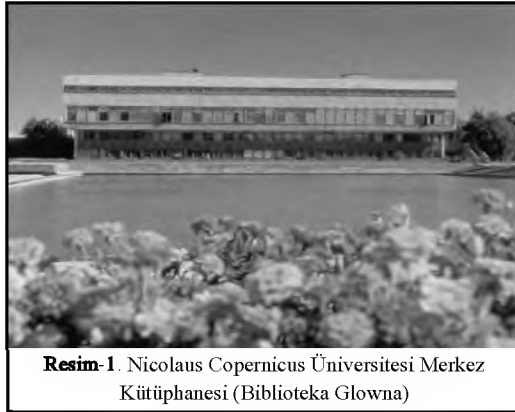
Resim-1. Nicolaus Copernicus Üniversitesi Merkez Kütüphanesi (Biblioteka Glowna)

Nicolaus Copernicus Üniversitesi Kütüphanesi 24 Ağustos 1945 tarihinde Toruń'da üniversite kampusu içerisinde kurulmuştur. Ancak kütüphane, hizmetlerine Mayıs 1947'de başlamıştır. Kütüphane açıldığında dermesinde yalnızca 44.000 cilt eser bulunmaktaydı. Bu dermenin büyük bölümü, çeşitli şehirlerdeki malikâneler, okullar ve özel koleksiyoncuların