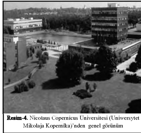
Resim-4. Nicolaus Copernicus Üniversitesi (Uniwersytet Mikolaja Kopernika)'nden genel görünüm

Bu bölümde, Polonya patentlerinin yazılı açıklamaları, Lehçe, diğer Avrupa dilleri ve Japonca belgelerden oluşan CD-ROM veri tabanlarının patent ve markaları, Polonya standartlarının tam bir seti; dergiler, kataloglar, kayıt defterleri, Polonya Standartlar Komitesi ve Polonya Cumhuriyeti Patent Ofisi tarafından yayımlanan sınıflamalardan oluşan destek yayınlarını içeren 100.000 materyal bulunmaktadır.