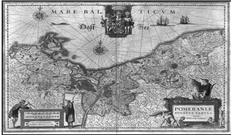
Resim-8. Eilhardus Lubinus'un 1618 tarihli Pomeranya haritası

Doğu ve Batı Pomeranya, Litvanya, Letonya ve Estonya, Baltık Denizi, Hanseatic Birliği 3 ülkeleri ve İskandinavya tarihine ilişkin 1800 yılı sonrası