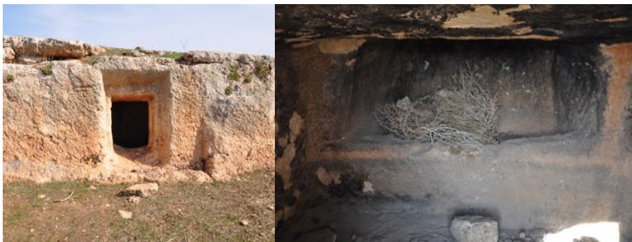
Resim 6. Selamet Köyü Kasr Mevkii Kaya Mezarı Girişi ve İç Bölümü.