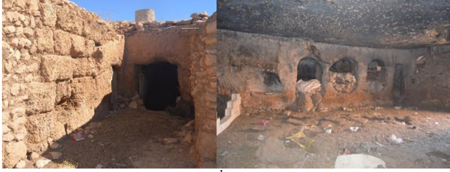
Resim 3. Sarıtaş Köyü Kaya Mezarı Girişi ve İç Bölümünü.