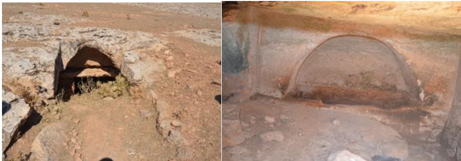
Resim 2. Halime Köyü Kaya Mezarı Girişi ve İçinin Görünümü (Foto. Semih Mutlu).