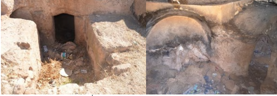
Resim 4. Uluhan Köyü Kaya Mezarı Girişi ve İç Bölümü (Foto. Semih Mutlu).