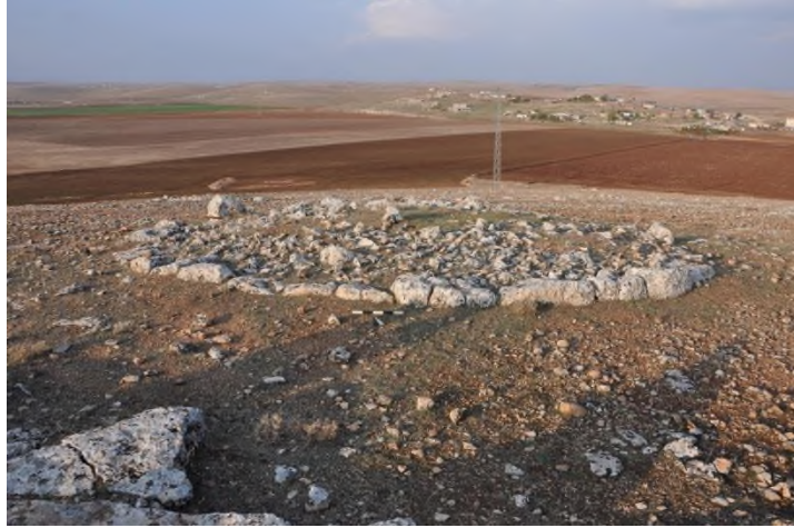
Resim 9. Terzi Köyü Batı Mevkii Silindirik Kaya Mezarı.