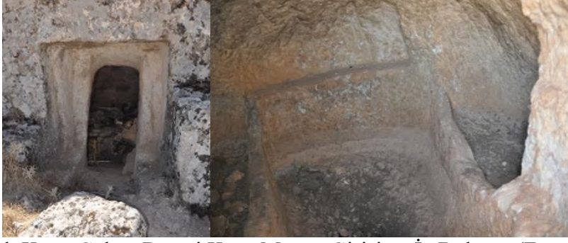
Resim 7. Kapaklı Köyü Çoban Deresi Kaya Mezarı Girişi ve İç Bölümü.