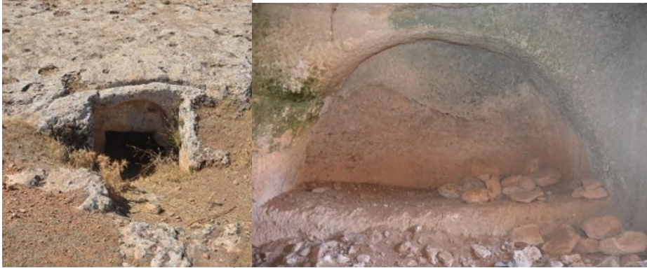
Resim 5. Karahisar Köyü Kaya Mezarı Girişi ve İç Bölümü (Foto. Semih Mutlu).