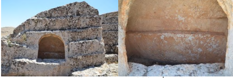
Resim 8. Kapaklı Köyü Kasr Mevkii Kaya Mezarı Girişi ve İç Bölümü.