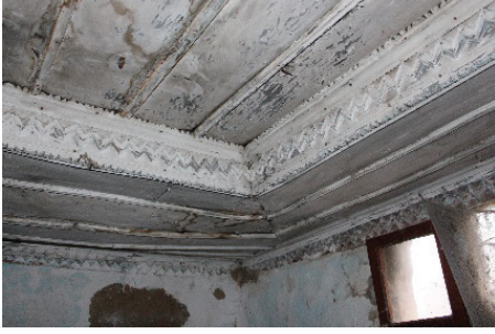
Görsel 9. Gelin odası tavanı pervazları

etrafında kalan tavan yüzeyi, 6 çıtalı düz ahşaplardan oluşmaktadır. Çukur kısmı çevreleyen pervazın ortasında zikzak motifler yer almaktadır. Ayrıca pervazın alt ve üst yüzeyleri geometrik motiflerle şekillendirilmiştir.