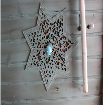
Görsel 13. İşlengili tavan göbeği

İç tavanın merkezinde yedi kollu bitkisel bezemelere sahip yıldız pano bulunmaktadır. Yıldız kolları merkezde daire formu bir ahşapla birbirine bağlanmaktadır. Tavan göbeğinde yer alan yıldız panonun kollarında farklı motiflerin kullanıldığı görülmektedir. Aplike tekniğiyle yapılan göbek yıldızı, ana hatlarıyla birbirine benzer motifler barındırır da el işçiliğinin de yaratmış olduğu farklılıklar göze çarpmaktadır (bkz. Görsel 13 ).