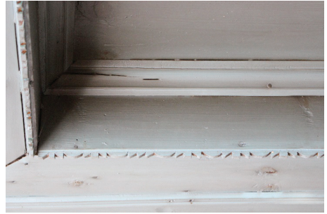
Görsel 12. Pervaz detayı

Gelin odası tavanı tekne tavan şeklinde yapılmıştır. Duvardan tavana geçiş pervazlarıyla sağlanmıştır (bkz. Görsel 12 ). Pervazdan iç tavana kadar olan kısım çıtalı ahşaplarla kaplanmıştır. Göbeğin etrafında kalan tavan yüzeyi, 6 çıtalı düz ahşaplardan oluşmaktadır. Çukur kısmı çevreleyen pervazın üst yüzeyleri geometrik motiflerle şekillendirilmiştir.