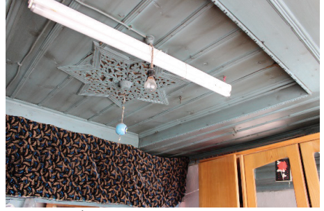
Görsel 11. İşlengili gelin odası tavanı