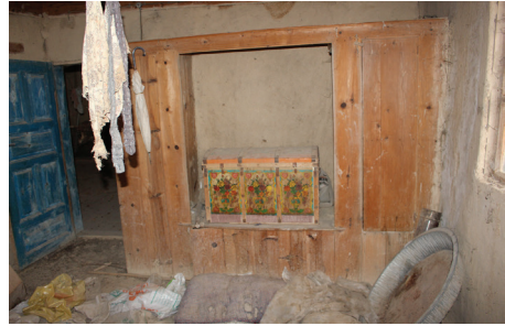
Görsel 2. Bölgedeki Çeyiz Sandıklarına Örnekler (kişisel arşiv)