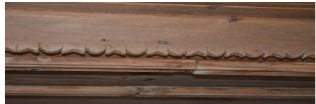
Görsel 16. Tekne tavan pervaz detayı

Yapılan görüşmelere göre, işlengili tavanlardan tekne tavan (bkz. Görsel 14 ) olan evin büyük oğlu Mustafa bey için, bindirmeli tavan (bkz. Görsel 15 ) ise Ahmet bey için hazırlanmıştır. Tekne tavanın duvardan tavana geçişi pervazlarla sağlanmıştır (bkz. Görsel 16 ). Pervazdan iç tavana kadar olan kısım çıtalı ahşaplarla kaplanmıştır.