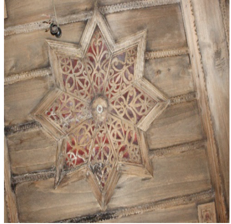
Görsel 6. Tavan göbeğinde yer alan sekiz köşeli yıldız motifi

desenlerle sağlanmıştır. Yıldız kollarının birleştirilmesi sırasında motifler, tekrar etmeyecek ve birbiri arkasına gelecek şekilde yerleştirilmiştir. (bkz. Görsel 6, Tablo 1).