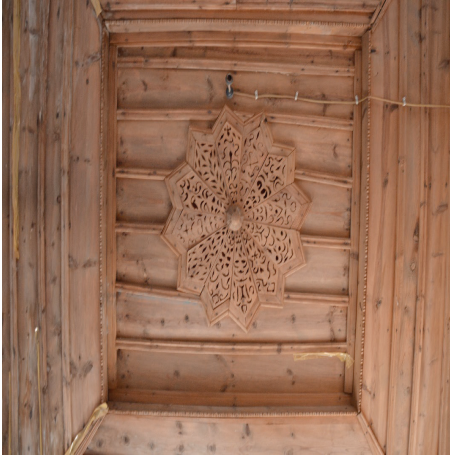
Görsel 17. Tekne tavana göbeğinde yer alan yıldız pano

merkezde daire formlu bir ahşapla birbirine bağlanmaktadır. Göbeğin etrafında kalan tavan yüzeyi, çıtalı düz ahşaplardan oluşmaktadır. Çukur kısmı çevreleyen pervazın üst yüzeyleri motiflidir. Aplike tekniği kullanılan tekne tavanın göbeğindeki yıldız kollarında detaylarda farklılıklar gözlenmektedir.