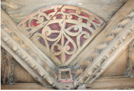
Görsel 5. Çeyrek daire panolar (kişisel arşiv)

Gelin odası bindirme tavan olarak yapılmıştır (bkz. Görsel 4). Duvardan tavana geçiş pervazlarla sağlanmıştır. Pervazların ortasında zikzak motifler yer almaktadır. Tavan kurgusu iç içe iki kare, ikinci karenin içine çapraz yerleştirilmiş kare ve onun içinde bir kare olmak üzere toplam 4 kareden oluşmaktadır. En içteki karenin merkezinde sekiz köşeli bitkisel bezemelere sahip yıldız pano bulunmaktadır. Yıldız kolları merkezde daire formulu bir ahşapla birbirine bağlanmaktadır. İkinci karenin ve en içteki karenin dört köşesinde iç içe karelerden oluşan bir motif bulunmaktadır. Bu motifler applike denilen ahşap işleme tekniğiyle yapılmıştır. Çıtakârî tekniği kullanılan tavanda yer alan çıtalar düz çıta değil geometrik motifli çıtalar olarak tercih edilmiştir. Çapraz yerleştirilen karenin birleşim noktalarında çeyrek daire bitkisel motifli panolar bulunmaktadır (bkz. Görsel 5). Bu çeyrek daire şeklindeki motiflere baktığımızda her birinde farklı detaylar kullanıldığı görülmektedir.