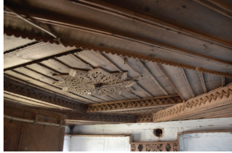
Görsel 15. Damar ailesi evi işlengili gelin odası tavanı-2

Yapılan görüşmelere göre, işlengili tavanlardan tekne tavan (bkz. Görsel 14 ) olan evin büyük oğlu Mustafa bey için, bindirmeli tavan (bkz. Görsel 15 ) ise Ahmet bey için hazırlanmıştır. Tekne tavanın duvardan tavana geçişi pervazlarla sağlanmıştır (bkz. Görsel 16 ). Pervazdan iç tavana kadar olan kısım çıtalı ahşaplarla kaplanmıştır.