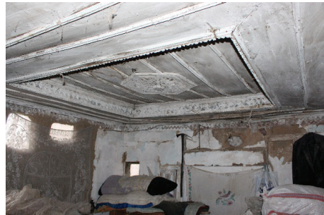
Görsel 8. Yaşar ailesine ait evin gelin odası