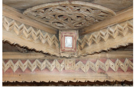
Görsel 7. Köşelere yerleştirilen aynalara örnek

Bu motiflerin ve tavan göbeğinde yer alan panonun ahşap oymalarının alt kısmının kırmızı renkte boyandığı görülmektedir. Ayrıca bu kesişim noktalarında, ortasında ayna bulunan kare panolar yer almaktadır (bkz. Görsel 7). Sözlü kaynaklarla yapılan görüşmelerde aynanın neden kullanıldığına dair sorduğumuz sorulara herhangi bir cevap alamadık. Aynanın mitolojik anlamlarına baktığımız zaman ise Türk kültüründe fani dünya ile ölümden sonraki hayat arasındaki sınırı sembolize ettiği bilinmektedir. Ayrıca İslam kültüründe de kişiye güzelliği gösteren bir imge olarak anılmaktadır. Bu nedenle tavadaki aynaların hem diğer dünyanın varlığını hem de yeni çifte güzelliklerini hatırlatmak için yerleştirildiği varsayılabilir.