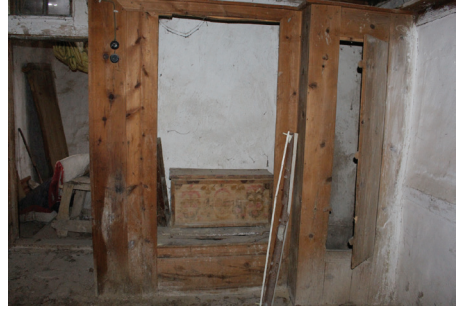
Görsel 1. Bölgedeki Çeyiz Sandıklarına Örnekler

daki Fatma Evkaya ve 90 yaşındaki Hatice Keleş'in verdiği bilgilere göre 3 gün boyunca hazırlanan çeyizler odaya gerilen ipler üzerinde sergilenmiş. Daha sonra da toplanan çeyiz, sandıklara yerleştirilerek gelinle birlikte yeni gelin odasına gidermiş (bkz. Görsel 1, Görsel 2). Yukarıda bahsettiğimiz gibi Evkaya ve Keleş'in verdiği bilgileri literatür de destekler niteliktedir.