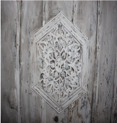
Görsel 10. Gelin odası tavan göbeği

Ayrıca her duvarın orta noktasında iç içe iki kareden oluşan bir kare yer almaktadır. Pervazdan iç tavana kadar olan kısım ahşaplarla kaplanmıştır. Birleşim noktalarında üç köşede iki, bir köşede üç adet çıtayla kapatılmıştır. İç tavanın merkezinde altıgen şeklinde bitkisel bezemelere sahip bir pano bulunmaktadır. Altıgeni oluşturan üçgen parçalar, merkezde dairesel formlu bir ahşapla birbirine bağlanmaktadır (bkz. Görsel 10 ). Göbek yapımında aplike tekniği kullanılmıştır.