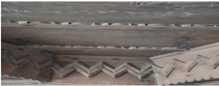
Görsel 18. Bindirmeli tavan pervaz detayı

Bindirme tavanın duvardan tavana geçişi ince pervazlarla sağlanmıştır. Tavanda yer alan çıtalar için, düz çıta değil geometrik motifli çıtalar tercih edilmiştir. İç içe kareler arasındaki geçişlerde kullanılan pervazların ortasında zikzak motifler yerleştirilmiştir (bkz. Görsel 18).