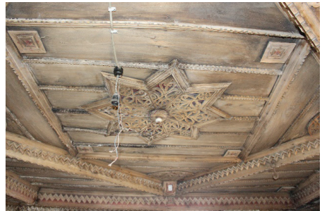
Görsel 4. Damar ailesine ait evin gelin odası tavanı