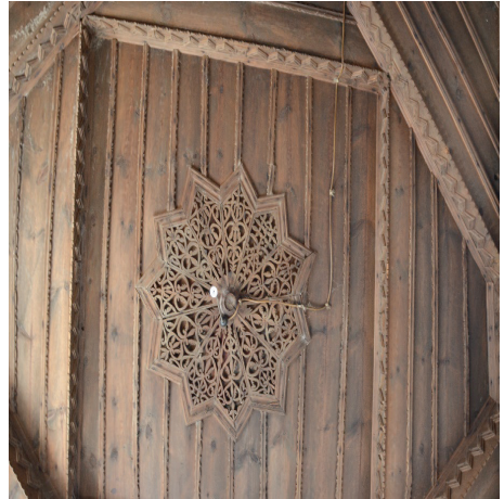
Görsel 19. Bindirme tavan göbek detayı

Tavan kurgusu iç içe iki kare, karenin içine çapraz yerleştirilmiş kare ve onun içinde bir kare olarak toplam 4 kareden oluşmaktadır. En içteki karenin merkezinde on bir köşeli bitkisel bezemelere sahip yıldız pano bulunmaktadır (bkz. Görsel 19). Yıldız kolları merkezde daire formlu bir ahşapla birbirine bağlanmaktadır. Bindirmeli tavanın göbeğindeki yıldız kollarında, el işçiliğinden kaynaklı ufak farklılıklar dışında herhangi bir fark bulunmamaktadır.