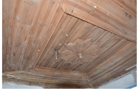
Görsel 14. Damar ailesi evi işlengili gelin odası tavanı-1