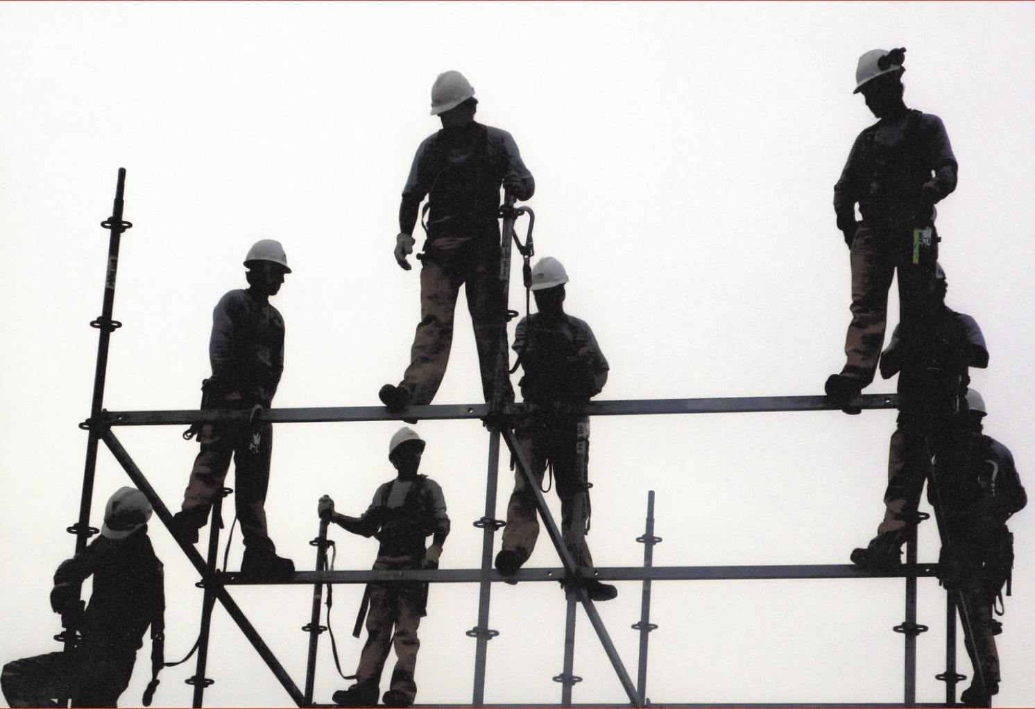
Emeđin Dansı

ile iř yerinde sađlık ve gúvenlik kúltürünün oluřturulması konusunda yol alınmasını da gúçleřtirmektedir. İř kazalarının sınıflandırılması ve nedenlerinin tespiti konusundaki tartiřmaların bir b÷lümü kazalara iliřkin yeterli bilimsel arařtırma ve veriye sahip olmayiřımızla iliřkiliyken temel belirleyenin iřçi sađlığı ve iř gúvenliđi alanına bakıřta sahip olunan ideolojik yaklařım olduđu unutulmamalıdır.