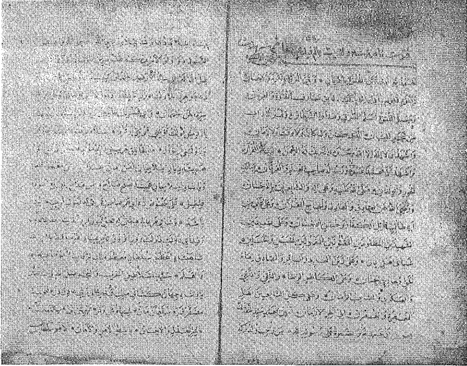
Şeyh Seyyid Huseyn'in Fütüvvet-Nâmesi'nin birinci ve ikinci sahifeleri