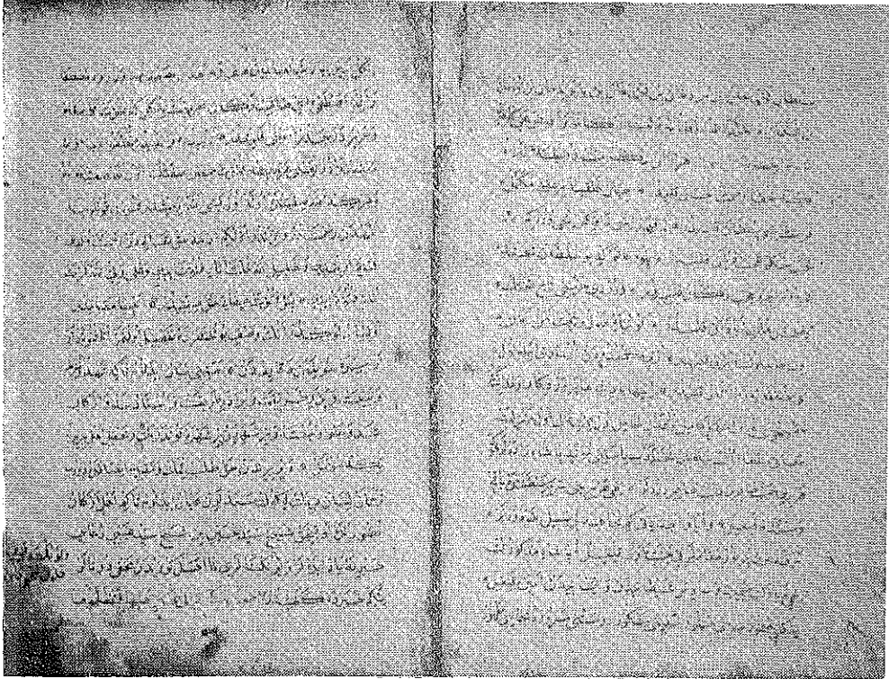
Üçüncü ve dördüncü sahifeleri