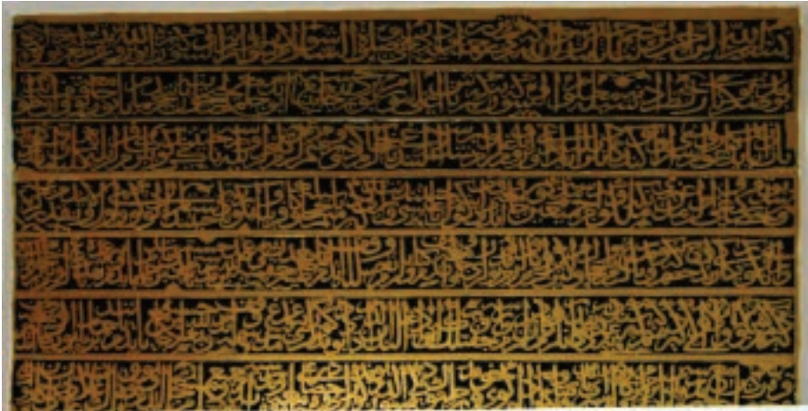
Figür 3. Doğudaki yazıt.

Ve Karahisâr'da bir câmi' ve bir medrese yapdım yânında bir hamâm ve kervânsaray yapdım ve Sârûca Bınâr adlû köy ve Hûma'da bir celtûk dingî satûn aldım ve bu mezkûrları Karahisâr'dağı câmi'e ve bir medreseye vakf itdüm ve cemî' vakıflarım mü-scecel itdüm ve vakıflarım ğallâtından Gulyâ'dağı kârvânsaray