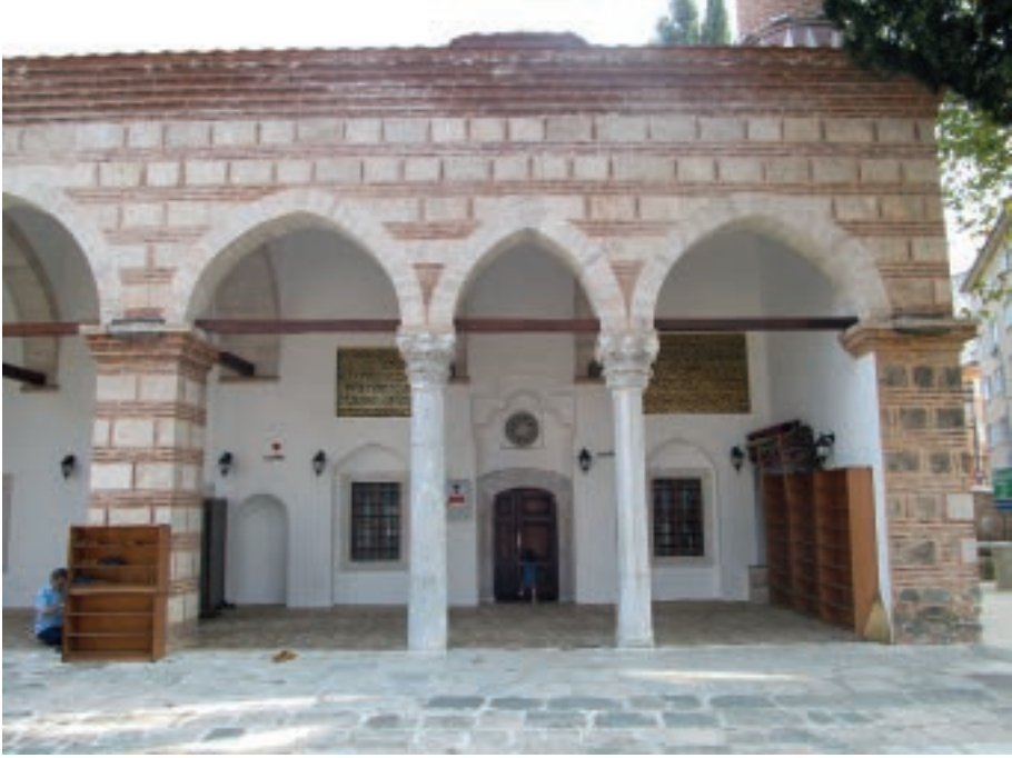
Figür 2. Bursa'da Umur Bey Camisi Son Cemaat yeri ve taş vakfiyeler.

Umur Bey'in, taş vakfiyesi caminin kuzey duvarında yer almaktadır. Vakfiye metni, cümle kapısının sağ ve solundaki pencerelerin üzerinde iki farklı yazıt halinde bulunmaktadır (Figür 2). Mermere kabartma tekniği ile yapılmış yazıtların zemini yeşil, harfleri sarı renge boyanmıştır. Sağdaki yedi satırlık yazıt, 1.35 x 2.15 metre boyutlarında, içerik bakımından onu takip eden soldaki altı satırlık yazıt ise 1.20 x 1.40 metre boyutlarındadır (Figür 3, 4).