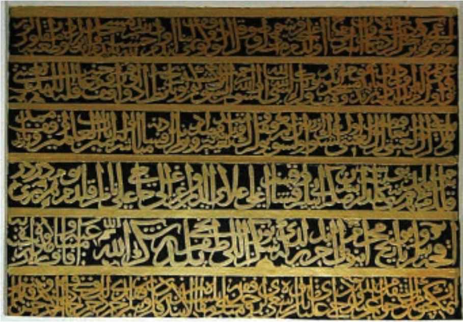
Figür 4. Batıdaki yazıt.

Taşınabilir nitelikteki [diğer bir deyişle kağıt üzerindeki] vakfiye metinleri, genellikle, sırasıyla; vakfiyeyi onaylayan kadı ya da kadıların imza ve mühürleri; vakıf sahibinin Allah'a hamd ve Peygamber'e dua ile vakfın kurmaktaki amacı; vakıf sahibinin adı ve nesebi ile tanıtımı; hayır işleri için inşa edilmiş yapılar ve işletilebilmesi amacıyla vakfedilen menkul ya da gayri-menkul gelir kaynakları; vakıf bütçesinin kullanımı ve vakıf personelinin maaş ve görevleri; vakfiye şartlarını