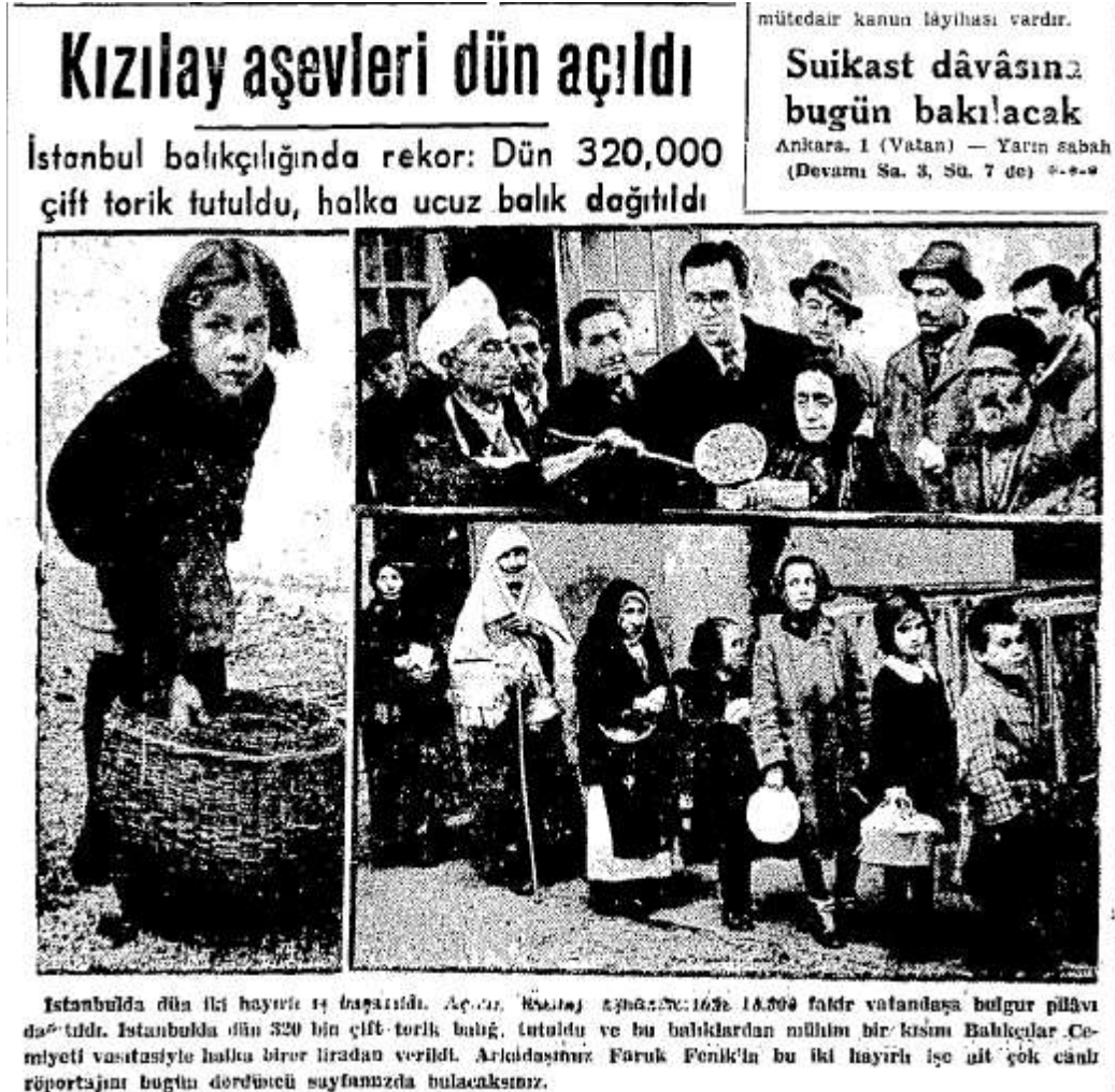
Ek 1 : Vatan Gazetesi, 2 Aralık 1942.