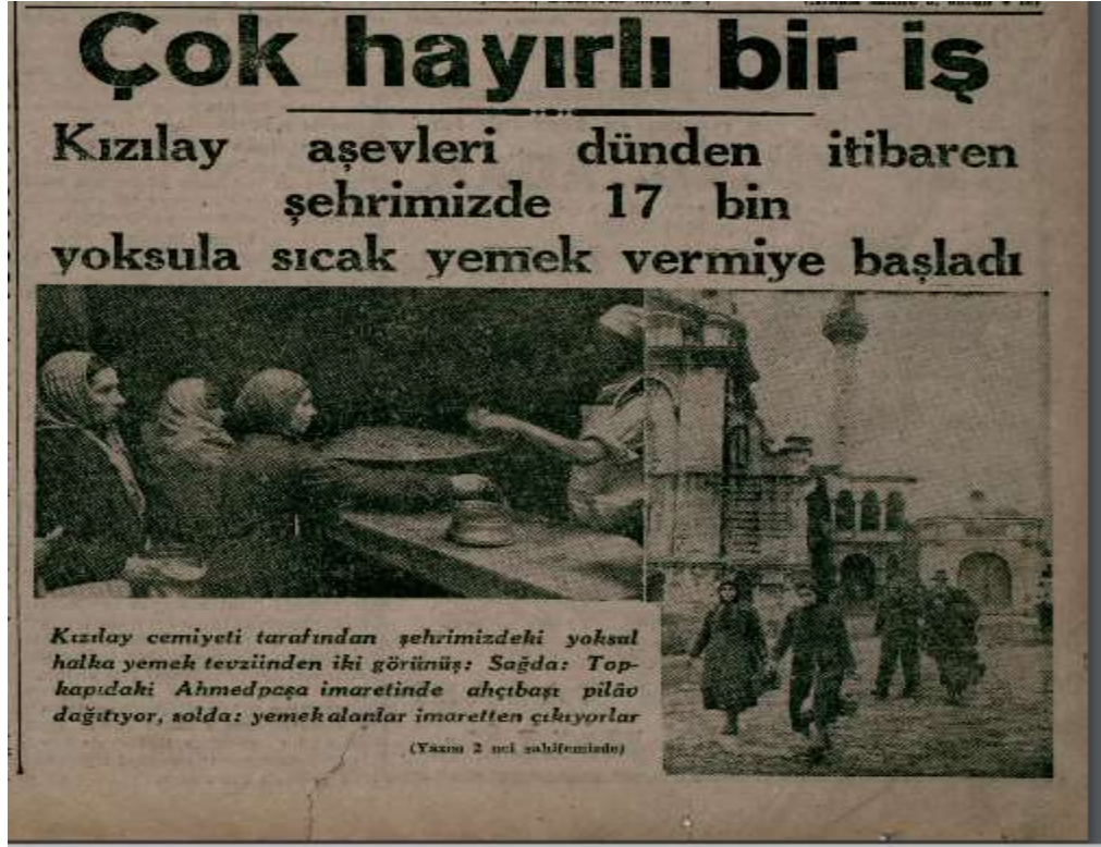
Ek 2: Cumhuriyet Gazetesi, 2 Aralık 1942.