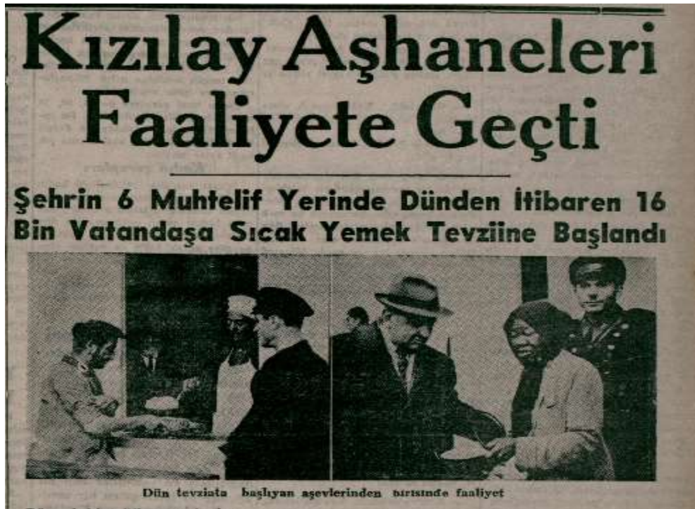
Ek 3: Tan Gazetesi, 2 Aralık 1942.