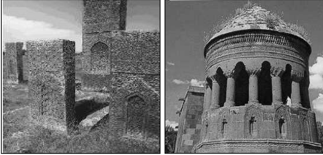
Figure 1. Graveyard stones and vaults of Selçuklu era (10) Şekil 1. Selçuklu mezar taşları ve kümbeti (10)