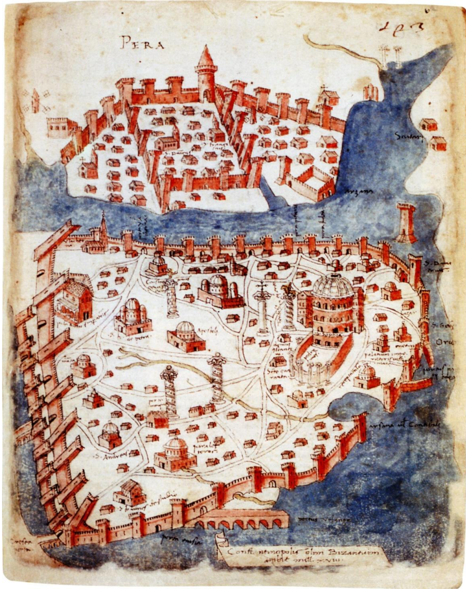
Şekil 1. Cristoforo Buondelmonti Konstantiniyye Haritası 1422, Liber Insularum Archipelai, Metropolitan Museum, New York, Dc

Çöküntünün nedenleri arasında -belki de en önemlisi- Osmanlı'nın 14 ve 15. Yüzyıla yayılan hem Anadolu'da hem de Rumeli'deki toprak kazanımları sonucu Bizans'ın adeta boğulmuş, hemen hemen Konstantiniyye surlarına kadar küçülmüş olmasıdır (Runciman 66) (Broquiére 206, 229). 11 Berger, "Konstantiniyye'yi gerçek bir şehir olmaktan çok 'yoğun şekilde iskan edilmiş bir kırsal alan'" olarak tanımlar; "... nüfusunun çoğunu kaybetmişti ve kalanlar da ziyadesiyle geniş olan bir alanı çevreleyen surların içinde, daha ziyade kırsal bir hayat sürüyorlardı" (Berger 14, 35). 12 Benzer şekilde Runciman da, "Uzunluğu yirmi iki kilometreyi bulan surların çevirdiği