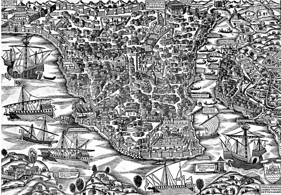
Şekil 2: Konstantinopolis, 16. yüzyıl. Artist: Giovanni Andrea Vavassori

kişi ile Fil Damı, 4 kişi ile Molla Hüsrev Camii ve 2 kişi ile Fener Kapı mahallelerinde bulunan akareti tasarruf ettiklerini görmekteyiz. Aynı bağlamda 23 mahalleye dağılmış bulunana Yahudi (ve Yahudiyye) hane reisinin -frekans büyüklükleri sıralamasıyla- 15'i Edirneli Yahudiler, 14'ü Acemoğlu Mescidi, 12'si Günkoz, 7'si Halil Paşa Burgoş'u, 6'sı Bozahaneler, 6'sı Fil Damı ve diğer mahallelere dağıldıkları görülmektedir. Eminönü'nde kümelenmiş Acemoğlu Mescidi, (adı üstünde) Edirneli Yahudiler, Halil Paşa Burgoş'u ve Kara Şems Mescidi ile Günkoz tipik Yahudi mahalleleri olarak gözükmektedir. Benzer şekilde Fener Kapısı bir Hıristiyan mahallesi olarak belirmektedir. İlginçtir bu etnik mahallelere karşın 5 Hıristiyan ve 6 Yahudi ailenin yerleştiği ve toplam 14 akaretin kayıtlı bulunduğu Fil Damı Müslüman, Yahudi ve Hıristiyan karışık; toplam 17 akaretin bulunduğu Bozahaneler, toplam 12 akaretin bulunduğu Hızır Bey Mescidi, toplam 7 akaretin bulunduğu Hoca Alaüddin, toplam 13 akaretin bulunduğu Sarı Timurcu mahalleleri Müslüman ve Yahudi karışık; toplam 11 akaretin bulunduğu Kırk Çeşme, toplam 10 akaretin bulunduğu Molla Hüsrev Camii Müslüman ve Hıristiyan karışık mahallelerdir.