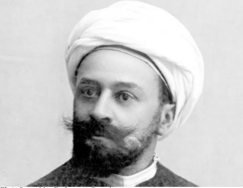
Ek 1. Baron Max Freiherr von Oppenheim