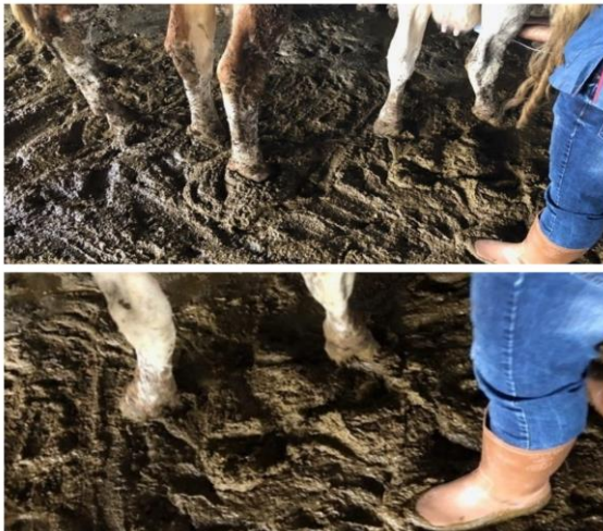
Şekil 4. Dışkı skoru 4 olan olgular. Dışkı daha kalın ve çizmeye yapışarak, istiflenmekte.