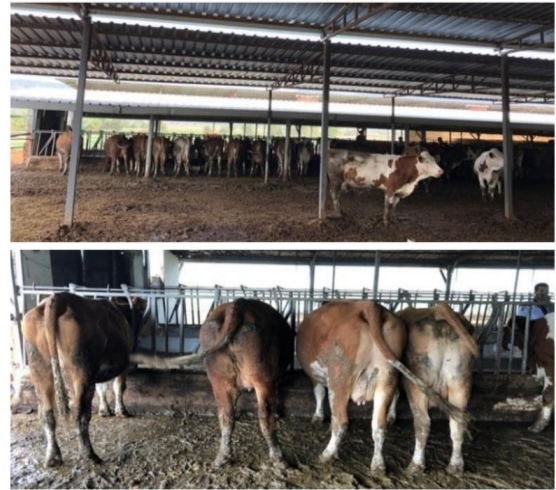
Şekil 1. İzmir, Tire İlçesine bağlı 50 başlıklı Fleckvieh popülasyonunun a) dıştan görünümü b) morfolojik muayene öncesi hazırlık ve inspeksiyon.

Şekil 3'de belirtildiği gibi sol baştan ilk 3 olguda dışkı skorları 2 iken, en sağdaki olguda skor 3'e yakın bulundu.