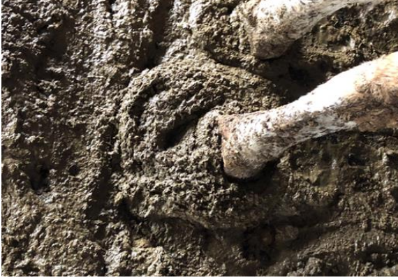
Şekil 2. Dışkı skoru 4 olan olgu. Figure 2. Case with fecal score 4.