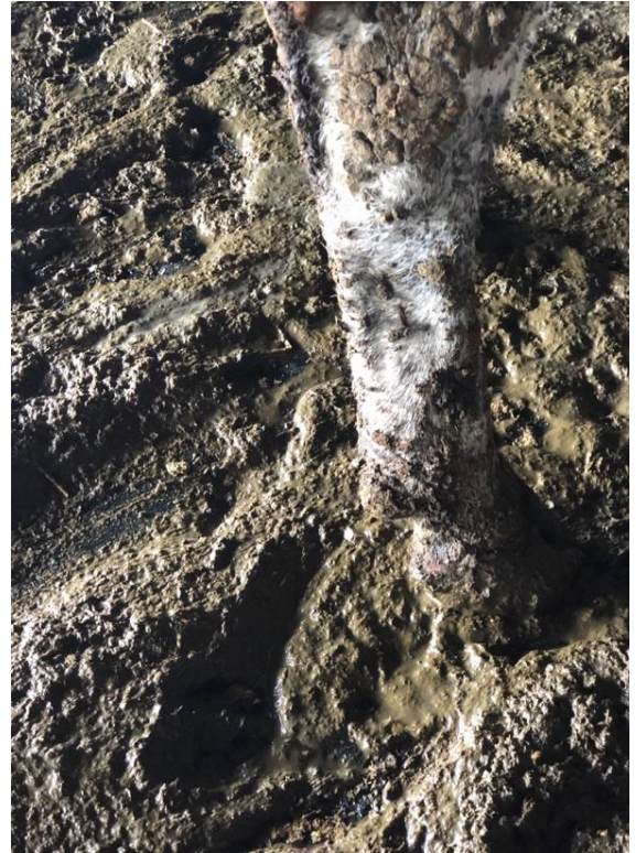
Şekil 6. Dışkı skoru 5. Bu dışkı sağlam dışkı topları olarak görünür.