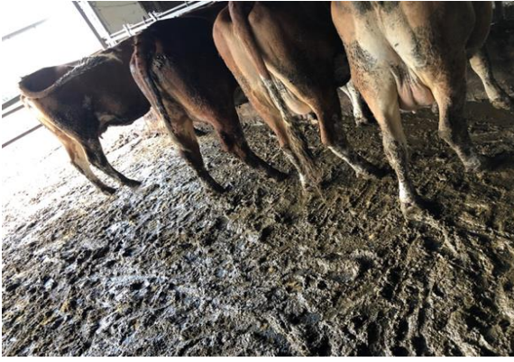
Şekil 3. Sol baştan ilk 3 olguda dışkı skorları 2 ve en sağdaki olguda skor 3'e yakın. Her 3 olguda diareyik kıvamda dışkı görüntüsü.