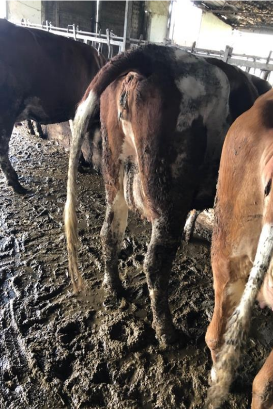
Şekil 7. İdeal skor 3 saptanan Fleckvieh inekte (buzagılama sonrası) net olmasa da gastrointestinal sistemin etkin çalıştığına delalet (bağırsak mikrobiyatasında biyoçeşitliliği iyi olarak öngörülebilecek bir olgu).

Figure 7. The ideal score is 3 of Fleckvieh cows (after parturition), although it is not clear, it is indicated to the gastrointestinal system function is effective (biodiversity of the gut microbiata might be predicted as a good case).