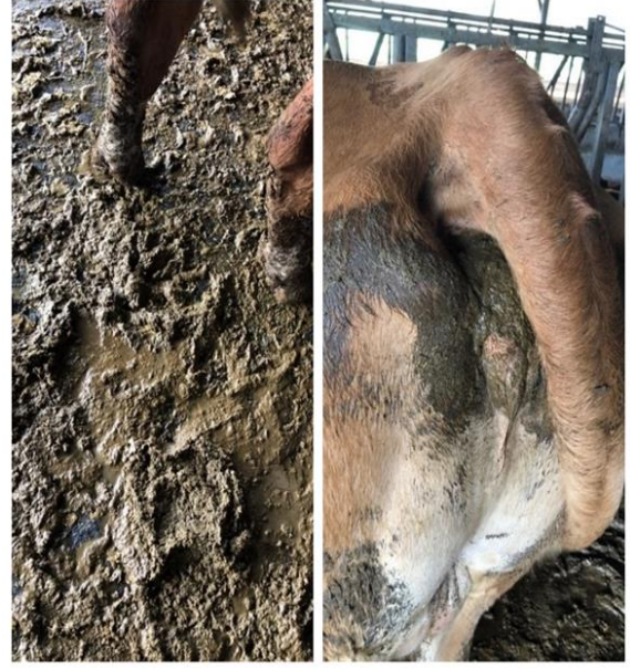
Şekil 5. Etraftaki diğer hayvan dışkıları ile karışmış olan olguda merkezi yerleşimli dışkı skoru 1 ile uyumlu, anal bölge diareyik dışkı ile bulaşık.