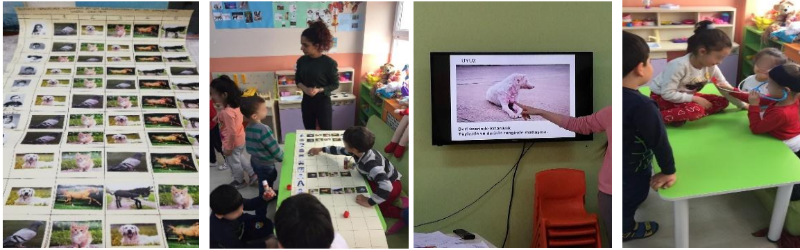
Fotoğraf 6. Sokak hayvanları grafiği ve hayvan sağlığı etkinlikleri.

Matematik etkinliği: En Çok Hangi Hayvanları Görüyoruz? Bu etkinlikte ‘Sokakta en çok ve en az hangi hayvanları görüyoruz?’ sorusuna cevap arayan çocuklar resimli grafik hazırlamışlardır. Bilmecelerle etkinliğe dikkat çekilmiş ve köpek, kedi, kuş, at ve eşek resimleri çocuklara dağıtılmıştır. Daha sonra her çocuk Fotoğraf 6’daki gibi kendi resminin karşısına sokakta en çok gördüğü hayvandan, en aza doğru kendi sıralamalarını yapıştırmıştır.