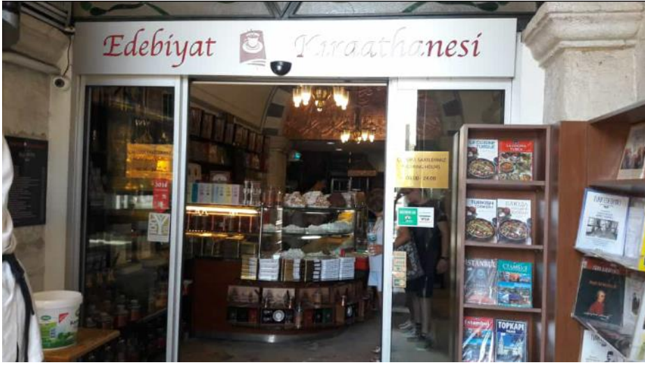
Girişte kısmında yer alan Edebiyat Kırathanesi