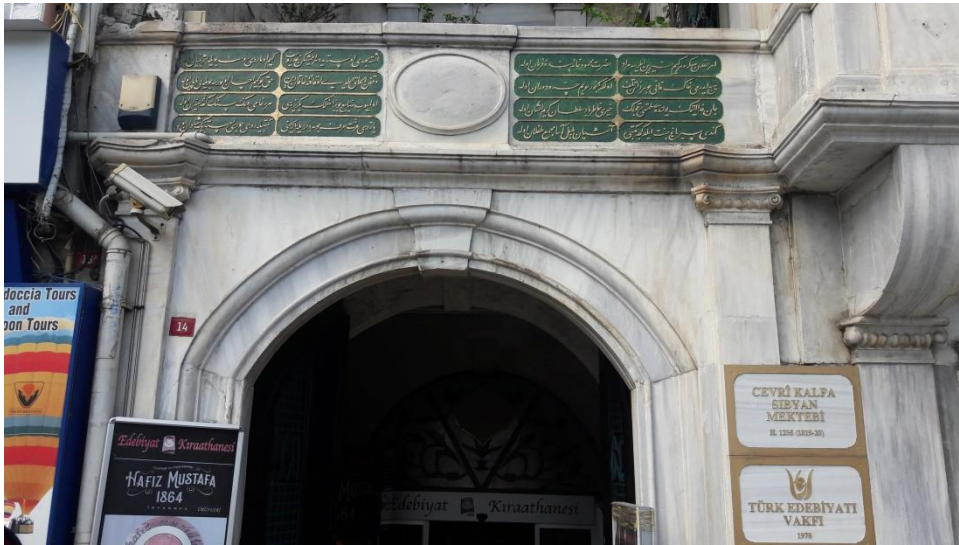
Cevri kalfa Mektebi'nin giriş kısmında bulunan, tuğrası kazınmış kitâbe