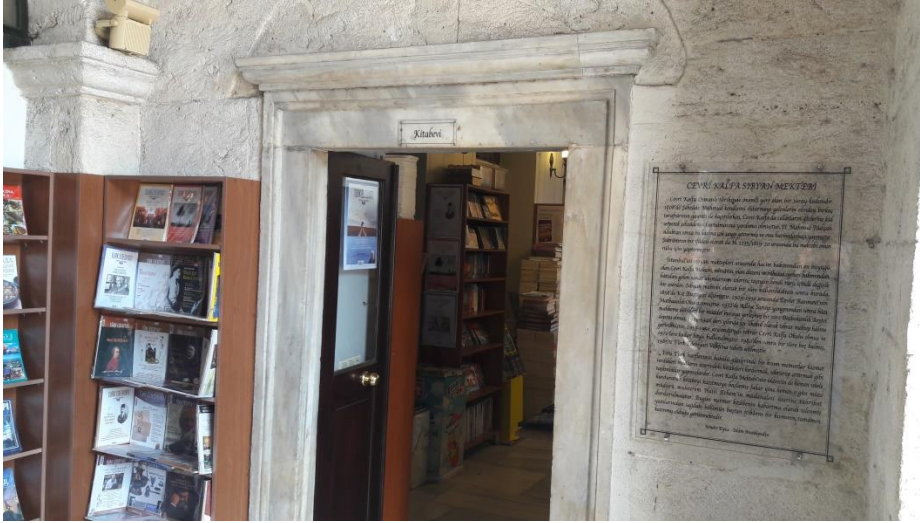
Girişte sağda yer alan kitabevi