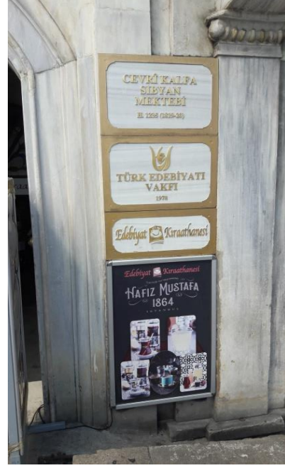
Giriş kısmından fotoğraflar