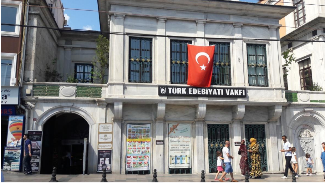
Sultanahmet Divanyolu üzerindeki Cevri Kalfa Mektebi'nin günümüzdeki hâli