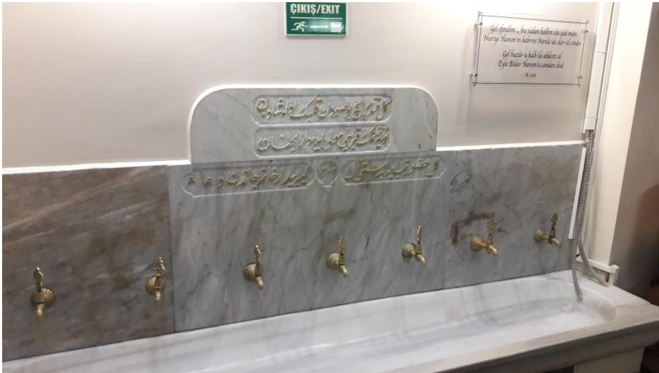
Edebiyat Kırathanesi'nin içinden bir görünüm, el yıkama yerleri