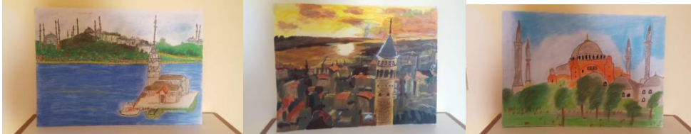
Görsel 1. Öğretmenlerin Atölye Çalışmalarından Seçilmiş Birkaç Örnek

17 Şubat 2019 (4.Uygulama): Son gün atölye çalışmasına diğer günlerde olduğu gibi 8 kişi katılmıştır. Portre çalışması sonlandırılmıştır. İstanbul konulu çalışmaya geçilmiş, malzeme konusunda katılımcılar serbest bırakılmıştır. Bu güne kadar yapılan çalışmalar sunuma açılmıştır. Çalışmalar hakkında değerlendirmeler yapıp, görüşler alınmıştır. 4.günün sonunda üretilen çalışmalar fotoğraflanarak arşivlenmiştir.