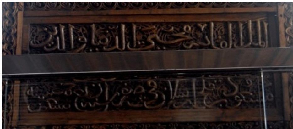
Görsel 6. Minber kapısındaki kitabe

İkinci tamir kitabesinde, yine ikinci satırın orta kısmındaki “عملة” kelimesindeki “lam (ل)” harfinin kendinden önceki harf grubuna göre satırın aşağısına sarkıtılarak yazılması da başka birçok Selçuklu kitabelerinde görülen özelliklerdendir. Genel itibarla satırlar incelendiğinde harf meyillerinin fazla oluşu ve birbirine bağlanan harflerin bazılarında görülen satır nizamının dışında kalacak derecede eğik yazılmış olmaları da Anadolu Selçuklu dönemi kitabelerinde sıkça rastlanılan durumlardandır. Kitabe içerisinde harekeler neredeyse hiç kullanılmadığı gibi tezyini işaretlere de yer verilmemiştir. Harf bağlantılarının kalın ve harf dönüşlerinin keskin olması da Selçuklu sülüsünün karakteristik özelliklerindedir. Ayrıca yazı içerisinde “kef (ك)” harfinin serin adı verilen üst çizgisi nadiren kullanılmıştır. Bu durum başka dönemlere ait yazıtlarda da görülen bir özellik olmakla beraber Anadolu Selçuklu yapı kitabelerinin çok özenli yazılmamış olması, bu tip ihlalleri artırmaktadır. Zira bu özensizliklerden biri de yine bu kitabede görülen dil bilgisi hatasıdır. İlk satırda geçen mescit kelimesi müzekker (eril) olduğu için devamında gelen “هذه” ifadesi doğru bir kullanım değildir; “هذا” ifadesi daha doğru olacaktır. Buna benzer dil bilgisi hatalarıyla daha önceki yıllarda yapılan araştırmalarda da karşılaşmıştır. Yapının son özgün kitabesi olan minber kapısındaki kitabe, ceviz ağacına oyma olarak işlenmiştir.