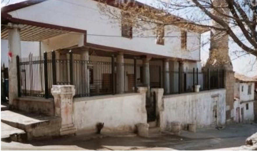
Görsel 1. Alaeddin camii. M. 1178, Ankara