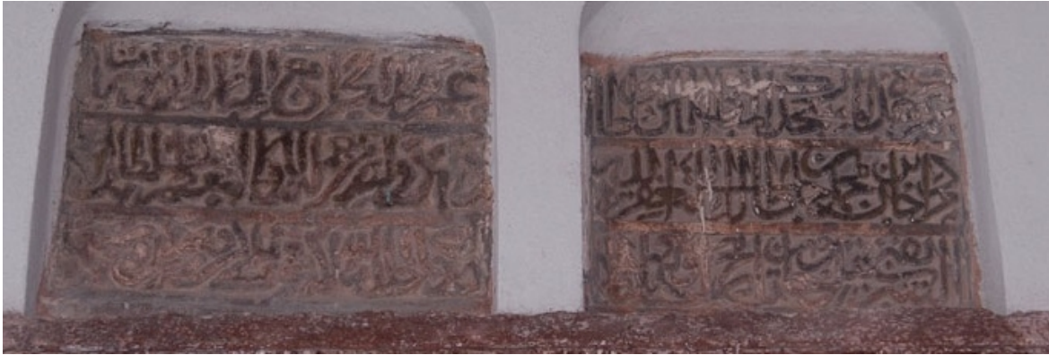
Görsel 2. Alaeddin camii tamir kitabeleri

Mabedin kapısı üzerinde üçer satırdan oluşan iki adet tamir kitabesi ve minberde imar kitabesi bulunur. Minberdeki kitabenin üst kısmındaki aynalıkta Kelime-i Tevhid ve onun üstünde de birbirine bakan iki hilal içerisinde yıldız motifi kalemışı olarak işlenmiştir.