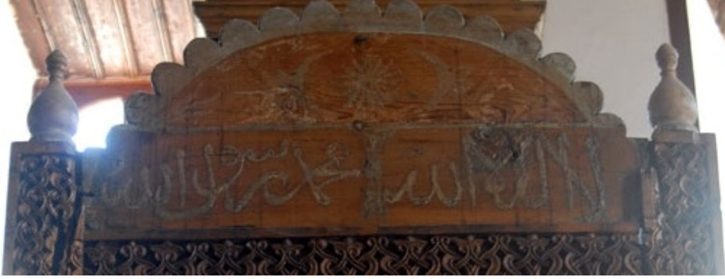
Görsel 7. Minber kapısı üstündeki Kelime-i Tevhid

yazı elemanlarının yüzeyleri keskin bırakılmamış, yuvarlatılarak yumuşak bir görünüm elde edilmiştir. Bunun yanı sıra çizgiler yazılma sırasına göre birbirinin altından veya üstünden geçirilerek oldukça ince işçiliğe sahip, sanat yönünden üst seviye bir eser meydana getirilmiştir. Özellikle dik harflerin zülfeleri rumi motifini andırır şekilde yapılmıştır ki bu da Selçuklu sülüsünün karakteristik özelliklerindedir. Harf geçişleri, tamir kitabelerinde olduğu gibi burada da olabildiğince yumuşak ve kıvrak hareketlerle tamamlanmıştır. Selçuklu sülüsünde görülen bu özellik, 14. yüzyıla gelindiğinde şekillenen Türk hat sanatı ekolünde yerini biraz daha sert geçişlere bırakacaktır. Burada bahsedilen orijinal kitabelerin haricinde caminin mihrabında yer alan alınlık panosu ve minber kapısının üst kısmında kelime-i tevhid yazısı bulunmaktadır.