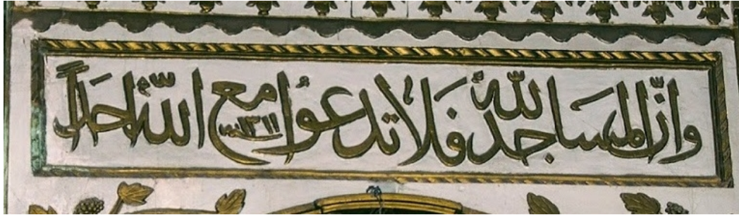
Görsel 8. Mihrap alınlığındaki yazı

Minber kapısı üstündeki yazı günümüze daha yakın bir dönemde yazılmıştır. Levha üzerinde yazılı olmadığından, kesin bir tarih belirtmek imkânsızdır. Ancak yazı karakteri dikkate alındığında 18. yüzyıl sonrası olduğu düşünülmektedir. Bu yazıda hareketlere yer verilmemiştir. İki parça ahşap üzerine kazınarak işlenen yazı daha sonra birleştirilmiştir. Kelime-i tevhidi oluşturan iki cümle arasında bu birleştirmeden dolayı gereksiz bir boşluk oluşmuştur. Yazı panosunun üstünde yarım oval form üzerine birbirine bakan iki hilal arasında güneş motifi işlenmiştir. Mihrap üstündeki alınlık panosunda Cin Suresi'nin 18. Ayeti yazılmıştır. Bu yazıda da lüzumlu hareketler dışında tezyini işaretlerin hiçbiri kullanılmamıştır. Alınlık panosunda hicri 1311 (1894-1895 miladi) tarihi okunmaktadır.