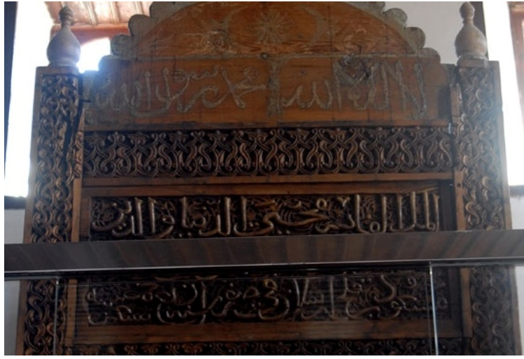
Görsel 3. Alaeddin camii minber kitabesi

الملك القاهر محي الدنيا و الدين ملك بلاد الروم و اليونان ابو نصر مسعود بن قلع ارسلان في صفر سنة اربع تسعين حمسنة 594