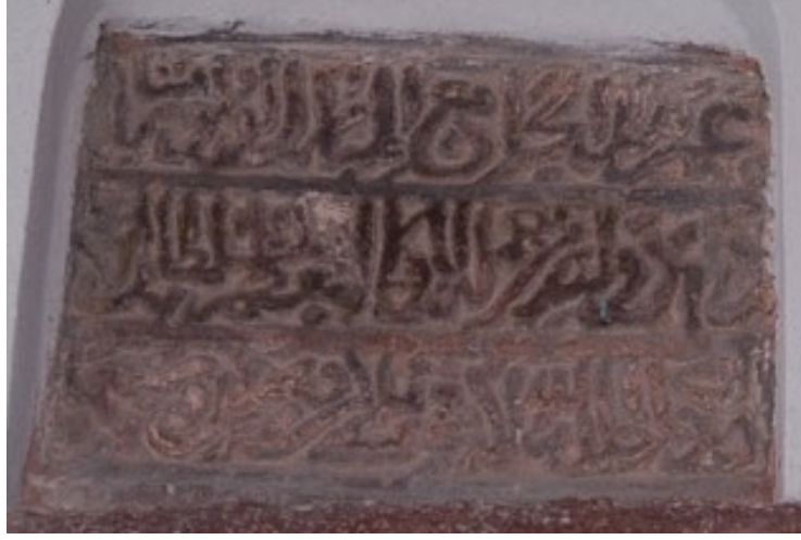
Görsel 5. İkinci tamir kitabesi

Sağdaki birinci tamir kitabesinde görülen sıkışıklık ve sonlara doğru yazının daha rahat bir istifle yazılmış olması Anadolu Selçuklularına ait birçok yapının kitabesinde görülen bir özelliktir. Bunun yanı sıra Selçuklu dönemi yazı sanatının estetik özelliklerinden biri olarak dik harflerin bir arada bulunduğu kısımlarda, bu harfleri ortadan kılıç gibi kesecek şekilde yatay bir çizginin (harfin) kullanıldığı görülmektedir. Zira ikinci satırın ortasındaki “الی” ifadesinin sonundaki “ye (ع)” harfinin çanak çizgisi soldan sağa doğru uzatılarak dikey harflerin ortasından yatay bir hat olarak geçirilmiştir.