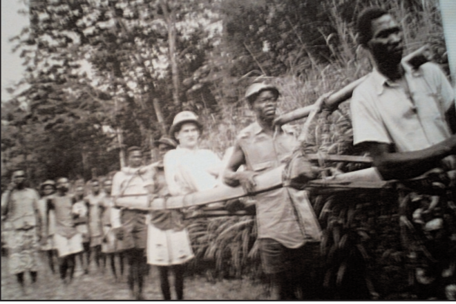
Resim 1: Kongo'da Afrikalıların Taşıdığı Bir Avrupalı

Bu noktada, konunun biraz daha netleşmesi için Belçika yönetiminin DKC'de uygulamalarından ikisi analiz edilecektir. Bu hususlardan bir tanesi sömürge dönemlerinde Kongo'da uygulanan eğitim sistemi ve Kongoluların eğitim koşullarıyla ilgilidir. Bu dönemlerde, Kongolu öğrenciler Avrupalıların Kongo'da açmış oldukları okullara kabul edilmemektedirler. Kongo'da, Kongolu öğrencilerin Avrupalıların okullarına kabul edilmeleri çok kısıtlı sayıda da olsa ancak 1950 yılından sonra gerçekleşmiştir (Young, 1965, s.93). Elbette bu kabul de ancak pek çok engeli aşmayı müteakip mümkün olmaktadır. Kurulan özel komisyonlardan başarı ile geçen Kongolular, Avrupalıların okullarında öğrenci olma şansını yakalayabilmişlerdir. Okullu olabilen Kongolular ile Avrupalılara okullarda yapılan muamele de farklıdır. Yine bu yıllarda, bir Afrikalı öğrencinin hijyenik olmadığı için aşağılanması ve okuldan kovulması, yaşanan sıradan olaylardan olmuştur.