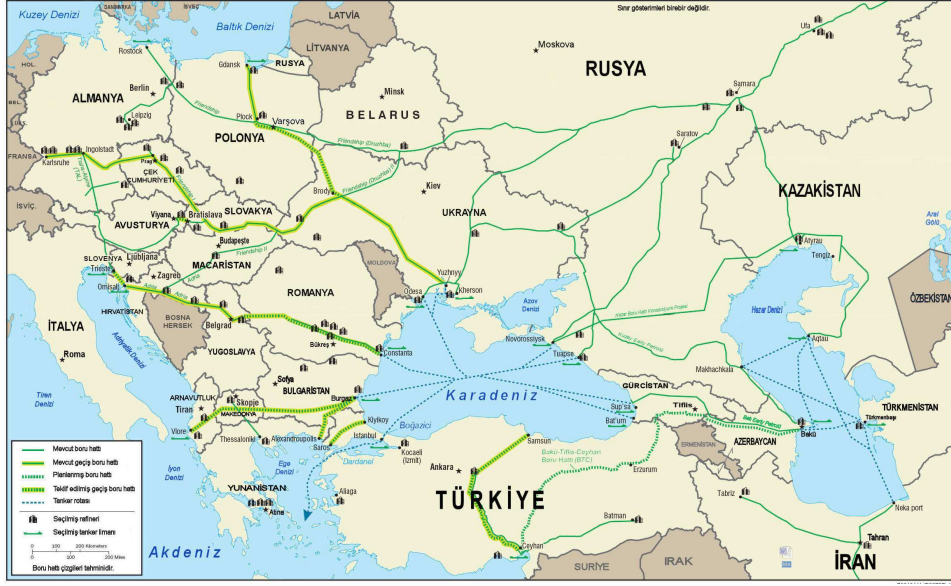
Grafik 2 Türkiye'nin Çevresini Dolaşan Boru Hatları