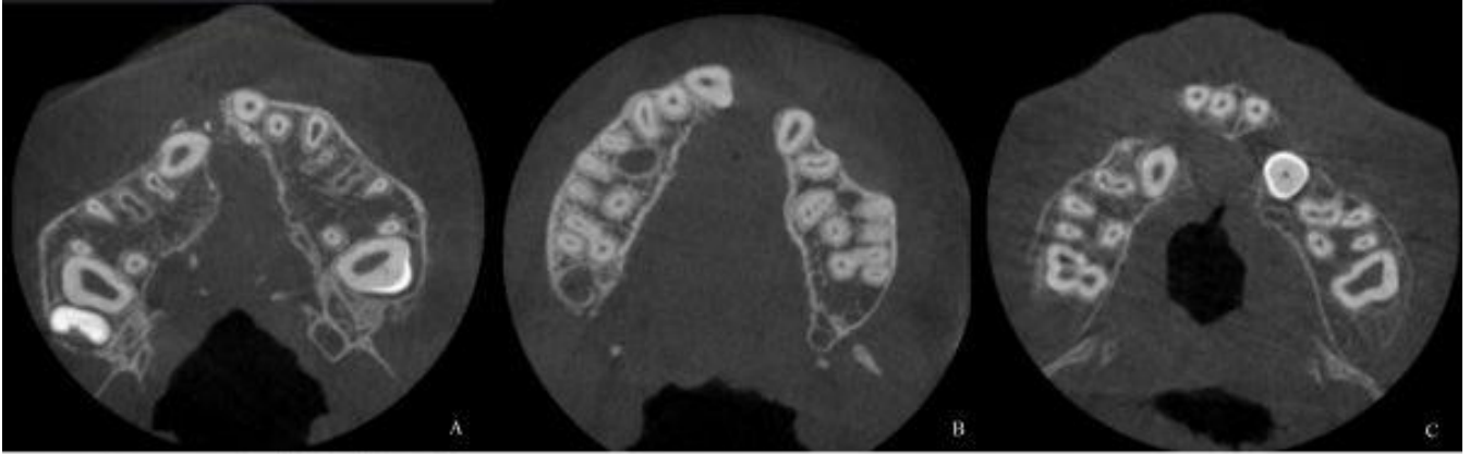
Resim 1. DDY* lokalizasyonunu gösteren, endomodda çekilmiş, aksiyal kesit KIBT** *Dudak-damak yarığı **Kistik epulid bölgeye ait kistozitefi A: Sağ tek taraflı DDY; B: Sol tek taraflı DDY; C: Çift taraflı DDY

Resim 1. A: 18 yaşındaki hastada 3 tane 2PM♦, 2 tane 3M● agenezisini gösteren OPG*; B: 16 yaşındaki hastada 1 tane 2PM♦, 4 tane 3M● agenezisini gösteren OPG*