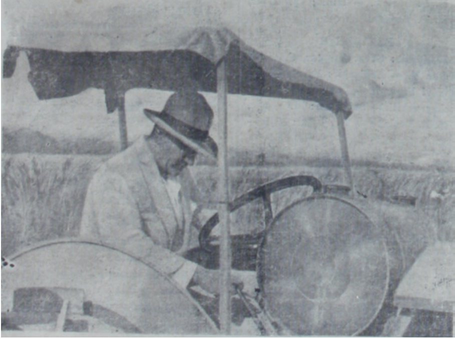
Atatürk Traktör Üzerinde Çalışıyor, Ulus Gazetesi, Orman Çiftliği On birinci Yılına Girdi, 15 Mayıs 1935