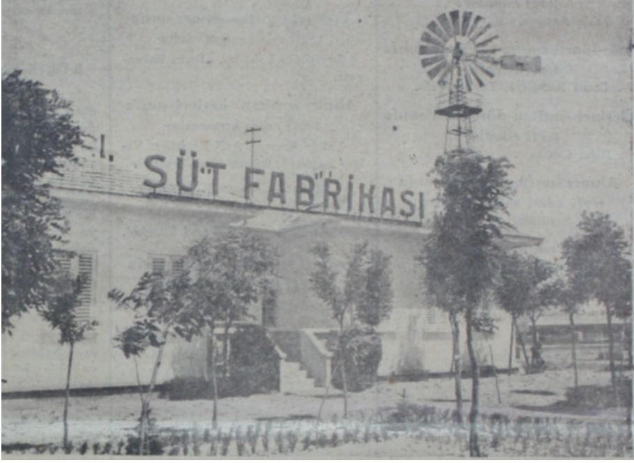
Süt Fabrikası, Ulus Gazetesi, Orman Çiftliğinin Yeni Eseri, 30 Ağustos 1936