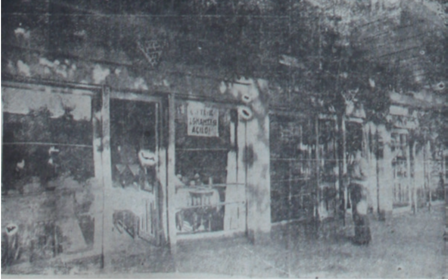
Çiftlik Lokantasının Dış Görüntüsü, Ulus Gazetesi, Orman Çiftliğinin Ankara'ya Yeni Bir Hizmeti, 3 Temmuz 1935