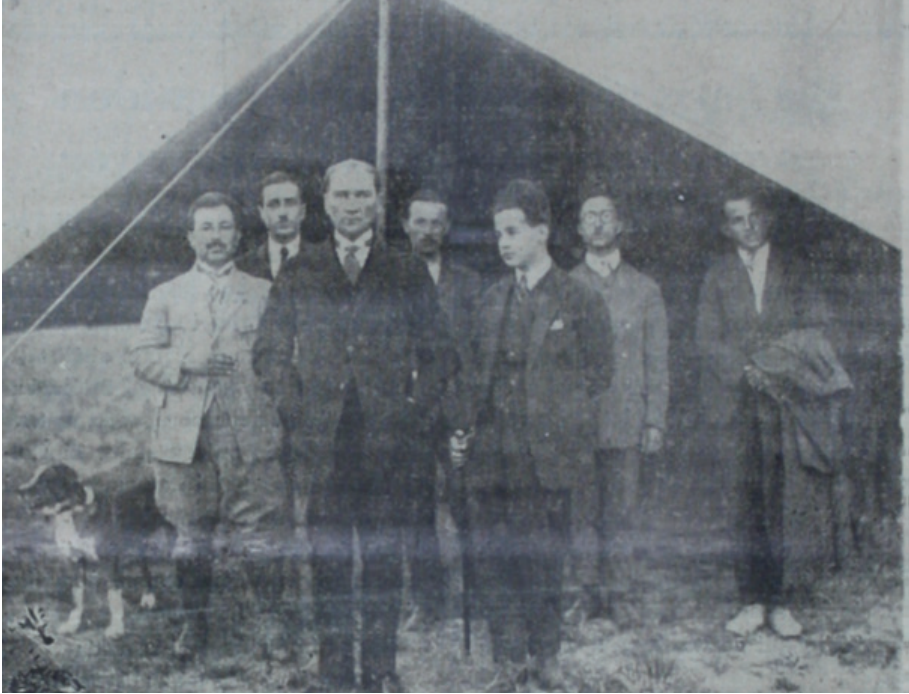
Çiftlikte Hiçbir Yapı Yokken Çadır Önünde Atatürk ve Birlikte Çalışanlar, Ulus Gazetesi, Orman Çiftliği On Birinci Yılına Girdi, 15 Mayıs 1935