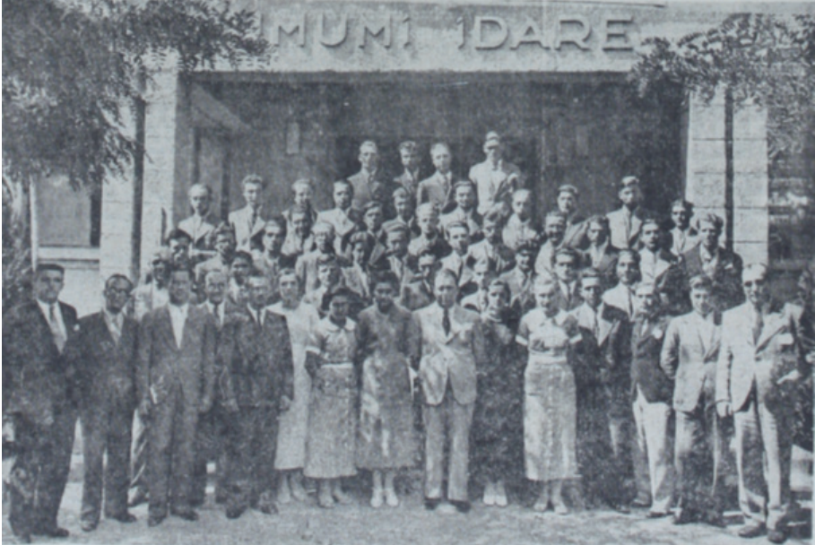
Orman Çiftliğinde Staj Gören Öğrenciler, Ulus Gazetesi, Orman Çiftliğinde Staj Gören Öğrenciler, 18 Ağustos 1935