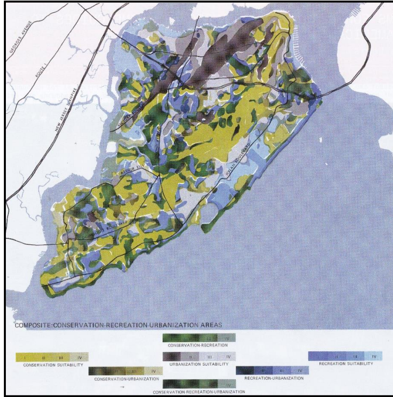
Şekil 2. Staten Adası için kompozit harita: Koruma-Rekreasyon-Kentleşmeye uygun alanlar [35]

kültürel tüm faktörlerin bir arada göz önüne alınması gerekliliğine önemli vurgular yapmıştır. McHarg, kitabında, New York kenti için eşsiz bir kaynak olan, fakat değeri hızla yitirilen Staten Adası için bir çalışma gerçekleştirmiştir. Bu çalışmada, planlama için bazı değerlendirmeler yapılmasının gerekli olduğunu; bu durumda hangi alanların korumaya, hangilerinin aktif ve pasif rekreasyona, hangilerinin ticaret ve sanayiye ve hangilerinin yerleşime uygun olduğunun tespit edilmesi gerektiğini belirtmiştir. McHarg, 30'dan fazla faktörü göz önüne almış ve bunları; iklim, jeoloji, fizyografi, hidroloji, toprak, vejetasyon, yaban hayatı habitatları ve alan kullanım kategorileri altında toplamıştır. Gerçekleştirdiği çakıştırmalar sonucu elde ettiği kompozit harita örneği Şekil 2'de görülmektedir.