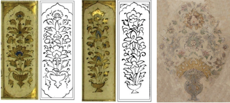
Fotoğraf 12: Varak 209a, 21a ve Edirne Üç Şerefeli Camii vazodan çıkan buket örneği 16

Saksılardan Çıkan Buketler: Timur Devri sanat üslubuyla etkileşimlerin izleri mimariden kitap sanatlarına pek çok alanda kendini göstermektedir. Bursa, Edirne gibi şehirlerde çinide ve kalemişinde vazolardan çıkmış demetler yer alır. Bu Kuran'da gördüğümüz demetler hem form hem motif açısından zikrolunan devrin işlerinin adeta bir devamı niteliğindedir. Vazolardan çıkmış demetler 38 tane koltuk tezhibinde kullanılmıştır. Renk olarak Kur'an genelinde olduğu gibi altın ve lacivert tercih edilmiştir(Fotoğraf 12).