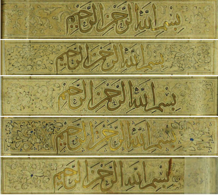
Fotoğraf 18: Orta satırda sülüs Besmele örnekleri 185b, 196b, 224a, 232a, 242a

Üst veya alttaki iri yazılmış satırlarda da besmele denk geldiğinde bazılarının keşidesi üzerine süslemeler yapılmıştır. Mushafın genelinde bu satırlarda sülüs yazı tercih edilirken(Fotoğraf 20), bazı satırlarda muhakkak yazı tercih edildiği görülmektedir(Fotoğraf 19).