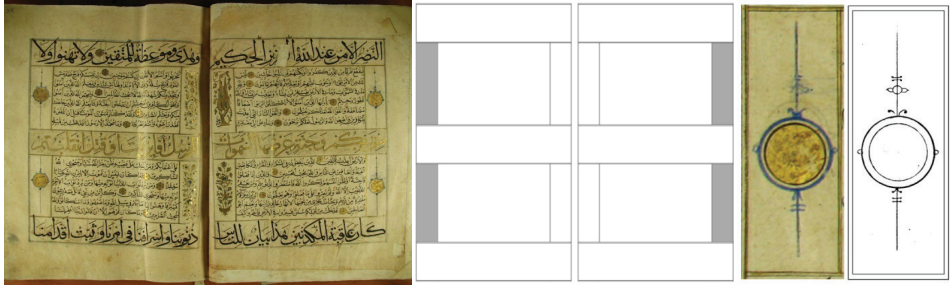
Fotoğraf 3: 06 numaralı Mushafın sayfa formu ve güllerin yerleştirildiği alanlar

doldurularak parlatılmıştır. İçlerinde altın zemin üzerine kırmızı mürekkeple küçük rumiler ve yazılar dikkat çeker fakat renk çok solgun olduğu için detayları görmek kabil olmamaktadır. Dış kısmı ise lacivert renkli bir iplik ve tıgla nihayetlenmektedir. Bazı sayfalarda bu alanların boş olduğu görülmektedir. Muhtemelen Mushaf çevresel faktörler veya başka bir menfi unsur neticesinde zarar görmüş ve bir konservasyon sürecine tabi tutulmuştur. Özellikle Mushafın baş kısmındaki sayfalarda gerek kâğıttaki renk farkı, gerekse hattatın yazısındaki değişiklik sebebiyle tamir edildiğini anladığımız kısımlar bulunmaktadır. Bunun neticesinde aslında eserde bu madalyonlu alanlardan 974 tane olduğu fakat mevcut sayısal veriye noksan kısımlar dahil edilmediğinden 968 tane madalyon/gül tezhibi bulunduğu müşahede edilmektedir.