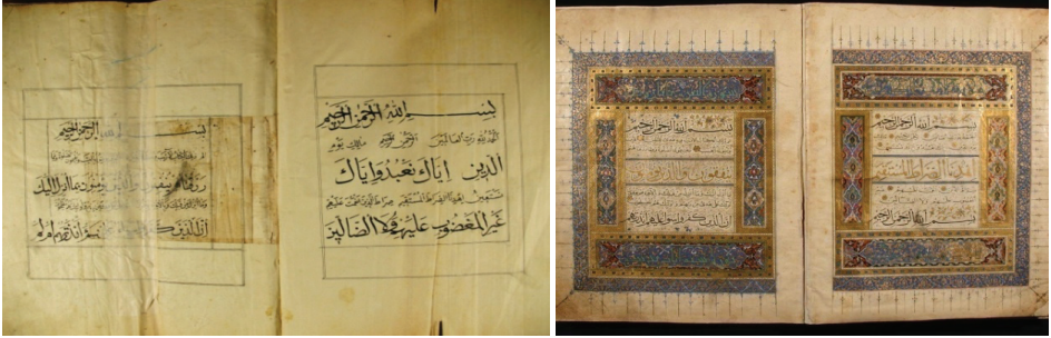
Fotoğraf 22: Rodos Ve Mevlana'daki Mushaf'ların Serlevha Sayfaları