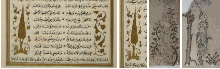
Fotoğraf 11: Servi Örneği S.K., Fatih 2571, v2a 14 - Edirne Muradiye Camii 15

sarılmış hatayi çiçeklerle bezeli helezonlar tasarımı zenginleştirmiştir. Süleymaniye Kütüphanesi Fatih 2571 numarada kayıtlı kelim konulu kitabın sayfa içi tezhiplerinde de benzer süslemelere rastlanmaktadır(Fotoğraf 11).