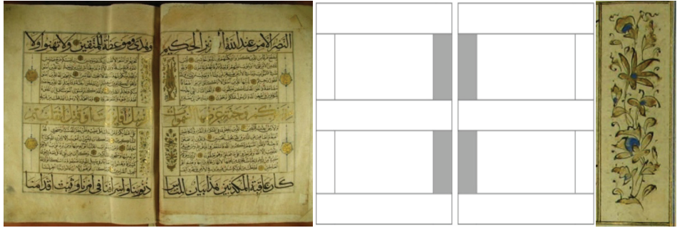
Fotoğraf 4: 06 numaralı Mushafın sayfa formu ve desenlerin yerleştirildiği alanlar

İç kısımda kalan koltuklar ise müstakil desenlerle tezhiplenmiştir (Fotoğraf 4). Mushafta bu alanlardan 974 tane olmasına karşın tamir edilen sayfalarda 4 tanesi noksan olduğundan 970 tane tezhipli alan incelenmiştir.