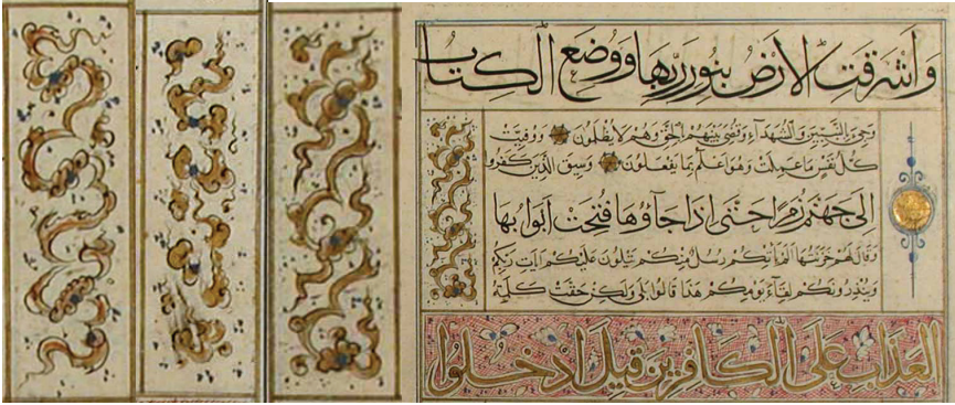
Fotoğraf 8: Mevlana Müzesi 07 Nolu Mushaf, varak 38a, 163a ve 179b'den bulut örneği

Rumi: Rumi pek çok dönemde olduğu gibi Fatih Dönemi'nde de oldukça revaç bulmuş bir motif olmasına karşın, bu Kur'an tezhiplerinde sadece 2 tane koltukta tercih edilmiştir (sülüs satırlarda birkaç örnek daha mevcuttur). Bunlardan biri üç iplik rumi olarak adlandırdığımız kenar suyu deseni şemasiyle uygulanmış olup, içinde bulunduğu alanın ölçülerine göre yapılmıştır(Fotoğraf 9a). Diğer rumili tasarım adeta bir cilt gibi düzenlenmiştir. Ortada şemse formu uçlarda ise rumi tepelik motifinden müteşekkil salbekler mevcuttur. Köşebent olarak nitelendirebileceğimiz alanlar sadece dendanlarla oluşturulmuş, zemini altınla doldurulmuştur. Şemse ve salbeklerin içine basit rumi helezonlar altın üzerine siyah mürekkep ile uygulanmıştır(Fotoğraf 9b).