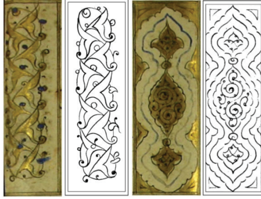
Fotoğraf 9a: Varak 48 b (solda) Fotoğraf 9b: Varak 209 a (sağda), rumi örnekleri

Ağaç: Fatih Dönemi mushaf tezvinatında fazlaca örneğini görmediğimiz ağaçlar incelediğimiz Mushaf'ta 189 tane koltukta tezyini bir unsur olarak kullanılmıştır (Fotoğraf 10). Bunlardan 100 tanesi servi ağacıdır (Edirne ve Bursa da bulunan erken devir kalemişi örneklerinde de servilere rastlanılmaktadır) 13 (Fotoğraf 11).