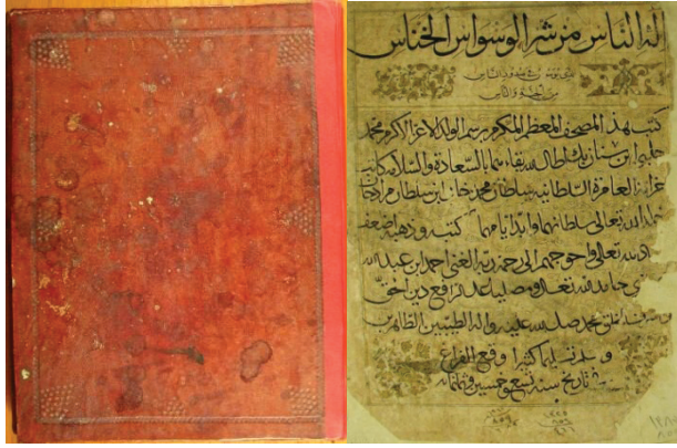
Fotoğraf 1: Rodos Kütüphanesi 06 numaralı Mushafın cildi ve ketebe sayfası

Eserin cildi kahverengidir ve oldukça sade bir tezyinata sahiptir. Kenarda bir cetvel ve köşelerde buna bitişik minik dairelerden oluşan köşebentler yer alır (Fotoğraf 1). Kapak, sertap ve miklep kopuktur. Kuran'da müzehhep kısımlar; sayfa ortalarındaki altınla yazılmış sülüs satırlar, güller, koltuklar ve duraklardır. İlginç bir uygulama olarak güller koltuk tabir edilen alanlar içine yerleştirilmiştir. Mushaflarda yoğun tezyinat içeren zahriye sayfası bu Kur'anda yer almazken yine tezhipli görmeye alışkın olduğumuz serlevha sayfası sonradan bir tamirle eklendiğinden, elimizde asıl tezyinatına dair bir veri yoktur. Mevcut serlevha ise bezemeli değildir. Hatime/ketebe sayfası ise çok sade birkaç tezyini unsur içerir. Hafız Ahmet Ağa Kütüphanesi Vakıf mühürleri vardır. Yazım yeri belli değildir fakat Rodos'a İstanbul'dan getirilmiş olduğu için saray nakışhanesinde yapılmış olma ihtimali düşünülebilir. Üç yıl önce aynı hattat tarafından yazılmış bir başka Kur'an nüshasının ketebesinde Edirne'de yazılmış olduğu bilgisi yer almaktadır. Bu bilgiye istinaden, kesin olmamakla birlikte, incelediğimiz eserin de Edirne'de üretilmiş olabileceği hükmüne varılabilir.