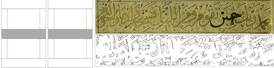
Fotoğraf 16: Sayfa ortalarındaki altınla yazılmış sülüs satırlar varak 209a

Mushaftaki diğer tezhipli alanlar sayfa ortalarında yer alan altınla yazılmış sülüs satırlardır. Yazının arasında, beyne's-sütur uygulamalarında görülen küçük rumiler, yapraklar ve küçük çintemaniler yer alır. Ayrıca zeminde Selçuklu beyne's-sütur tezhiplerinde görmeye alışkın olduğumuz altınla ince çizgiler halinde tarama yapılmıştır (Fotoğraf 16). Bu alana besmele denk geldiğinde ise kenardaki boş kalan kısımlar ot kümelerini andıran küçük çiçek demetleri, aralarında minik bulutlar veya rumilerle biraz daha yoğun şekilde bezenmiştir (Fotoğraf 17,18).