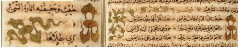
Fotoğraf 7: Süleymaniye Kütüphanesi, Fatih 2571, v.89a bulut örnekleri(Aşıcı, 2007, 169)