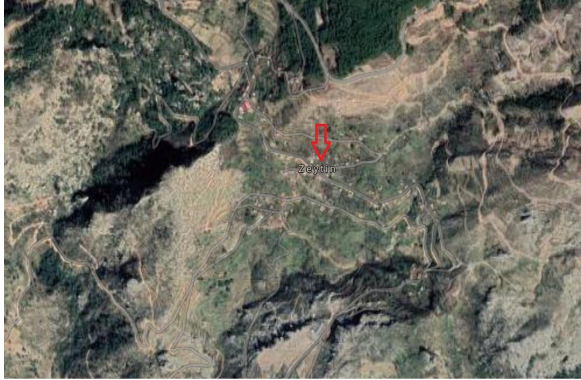
Şekil 1. Zeytinköy Uydu Görüntüsü