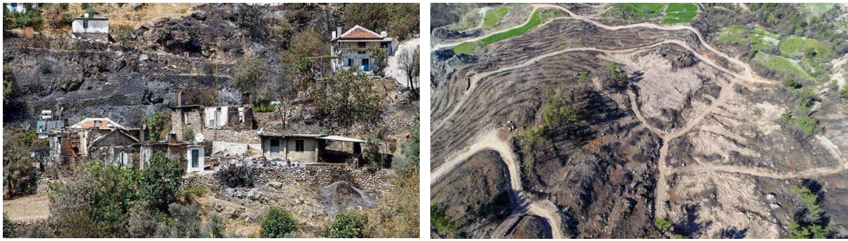
Şekil 4. Zeytinköy, Yangın Sonrası

Orman yangınları çevre için bir sonuç oluştururken orada yaşayan köylü için bir sosyal problem haline dönüşerek yeni bir başlangıç olmaktadır. Orman yangınları, o toplumsal yapıda yaşayanlar için geri dönülmesi uzun yıllar alan bir sosyal sorun haline dönüşmektedir. Özellikle yangınlardan sonra köylünün toplu olarak psikolojik tedaviye tabi tutulması gerekmektedir. Yangın çıkan köylerde yapılan gözlemlerde bu köylerde yaşayanların ortamlarının birden değişmesi nedeniyle büyük bir bedbinlik ve yaşama sevincinin yitmesi gözlemlenmiştir (Oktik, 2001: 72).