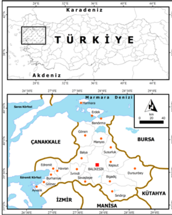
Şekil 1: Çalışma alanı lokasyon haritası

ve bunlara ait mahalleler dikkate alınmamaktadır. Balıkesir ilinde ilçe merkezi olan yerleşmelere ait toplam 187 mahalle bulunmaktadır. Balıkesir 39 mahalle ile en çok mahallesi olan şehir yerleşmesi iken, Balya ilçe merkezi sadece iki mahalle-den oluşmaktadır.