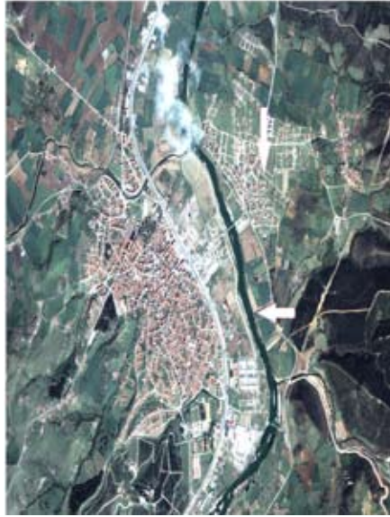
Fotoğraf 1: Karşıyaka Mahallesi'nin (dikey ok) kuş bakışı görünümü. Yatay ok Susurluk Çayını göstermektedir.