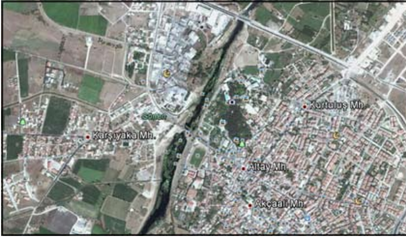
Şekil 2: Karşıyaka Mahallesi'nin asıl Gönene göre konumu (Google Earth, 2013).